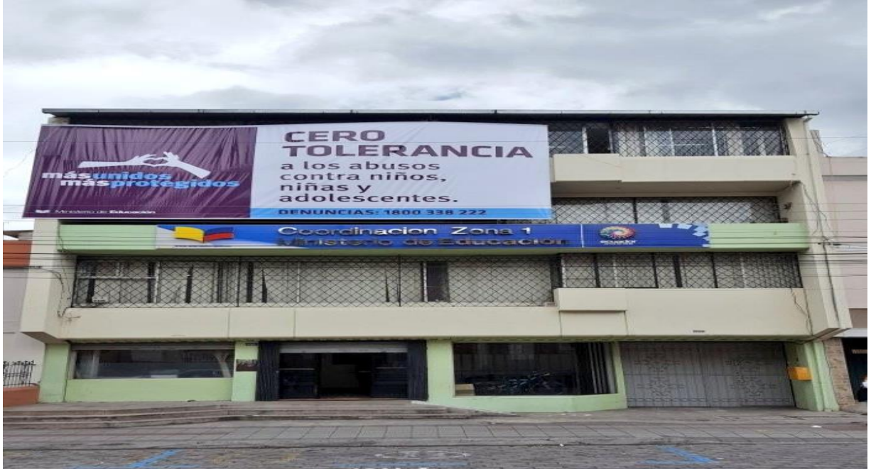
Ministerio de Educación Zonal 1 Ibarra