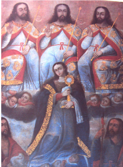
Santísima Trinidad en el Cielo con la Virgen María, Puno-Perú, S. XVI

También surgieron nuevos modelos iconográficos como el de la serie de arcángeles arcabuceros, vestidos a la usanza de la guardia del Virrey. Los estudiosos consideran que la creación de estas imágenes es una representación del espíritu militante de la Contrarreforma.