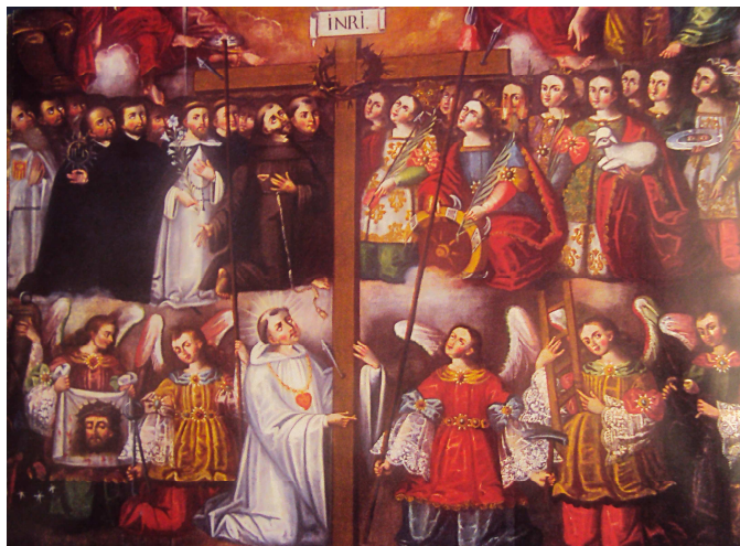
El Cielo Concebido en torno a la Cruz y los Símbolos de la Pasión (detalle), José López de los Ríos, Iglesia de Carabuco, La Paz-Bolivia

Este tipo de denominación de los ángeles, como fenómenos celestes o naturales, nos lleva a un estado primigenio de su creación, en el que en realidad eran considerados como tales. De ahí que la adoración a los ángeles, dentro del mundo indígena, se deba más bien a una suplantación del culto a los astros por el de los ángeles. El resto de la iconografía, en cuanto a la pintura, no varía, aunque no se hallan mayormente en ellas las normas rígidas establecidas por la Contrarreforma, pero se mantiene la inspiración en los grabados populares y manuscritos, sobre los que trabajarán los artistas pero les añadirán nuevos elementos.