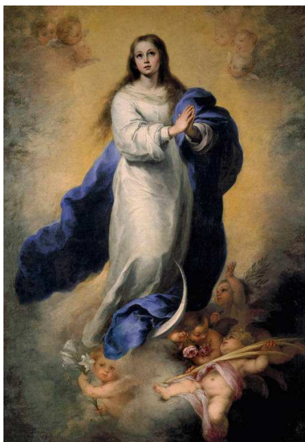
Inmaculada Concepción, Bartolomé Murillo Siglo XVII, Museo del Prado, Madrid

Es de esta manera que se empieza a representar a la Inmaculada Concepción con estos parámetros y quien mejor la representará será el pintor español Bartolomé Murillo con su representación de la Inmaculada Concepción , en la que se muestra el cumplimiento de los parámetros dados anteriormente. Este tipo de representación será representada y copiada por otros afamados pintores de la época.