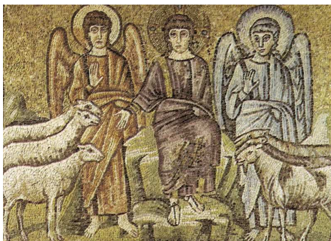
Cristo separa las ovejas de las cabras, San't Apollinare Nuovo, Ravenna, Italia

Barton Russel resalta que es posible que el rojo de Seth (el dios egipcio de la destrucción) ayudase a convertir el rojo en el color más común, después del negro, del Diablo cristiano. 39