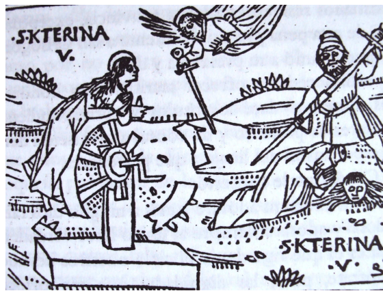
Santa Catalina, La Leyenda Dorada, Santiago de la Vorágine

nacerán también los símbolos que identificarán iconográficamente a cada uno de los santos, ya sea por la forma en la que sufrió su martirio o por alguna característica que éste pudiera tener en vida. Podemos tomar como ejemplo el caso de Santa Catalina de Alejandría, quien fue martirizada e iba a ser puesta en una rueda de cuchillas, al acercase la Santa a ésta la rueda se rompe, al final de su martirio muere decapitada. Es precisamente esta rueda con cuchillos, el principal ícono con el que ha sido representada e incluso la rueda ha sido llamada Rueda Catalina en su honor. 32