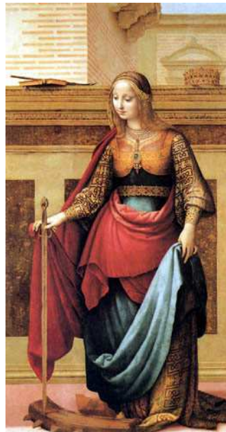
Santa Catalina de Alejandría, Fernando Yáñez de la Almedina, 1501/21