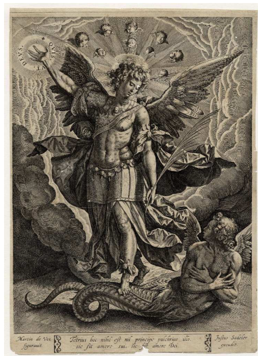
El Vencimiento del Diablo, Marten de Vos, 1584-1585

Tenemos además una representación importante de la misma obra que me pareció importante señalar para motivos de este trabajo, tenemos un grabado realizado por Marten de Vos, pintor y dibujante flamenco, que trabajó sus obras a finales del siglo XVI. 104 Tenemos un grabado realizado entre 1584 y 1585 llamado “El Vencimiento del Diablo” en el que plasma una imagen idéntica a la que se encontramos representada la imagen de San Miguel, claro que con algunas variaciones propias del artista. Tenemos mayor claridad en cuanto a los detalles del peto del Arcángel y en su cabello no podemos observar la corona de laurel, además la imagen del demonio tiene una importante variación, la serpiente es mitad humana y mira desde el suelo a San Miguel. Además al pie de la imagen tenemos la siguiente inscripción: “ Tetrius hoc nihil est príncipe pulchrius illo. Sic fit amore sui, sic ficta more Dei ” que significa “Tetris, esto no es el príncipe más hermoso que él. Y lo que es el amor a sí mismo, por lo que de esta manera el amor de Dios”.