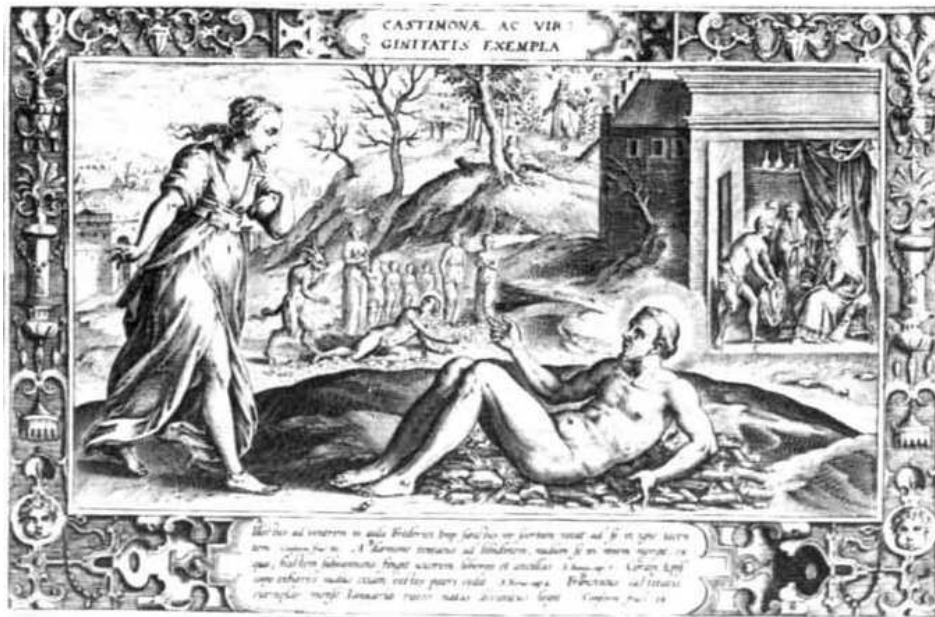
CASTIMONIAE AC VIRGINITATIS EXEMPLA, Philip Galle, No. 6

Tenemos una serie de grabados realizados por Philip Galle, que es parte de una serie hecha entre 1585 y 1587 titulada Seraphici Francisci Totius Evangelicae Perfectionis Exemplatis, Admiranda Historia 93 , en el que observamos la referencia que se hace a la imagen que hemos estado trabajado y que se puede observar con mucho más detalle el relato al que se refiere la obra, claro que para mayor entendimiento, el autor de la obra quiteña ha estructurado la composición de una manera más didáctica en la que la lectura de la misma sea más fácil de entender y que su mensaje llegue más claramente.