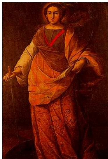
Santa Catalina, Gregorio Vázquez, 1696