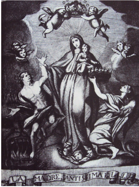
Virgen de la Luz Grabado de Bustamante, 1758