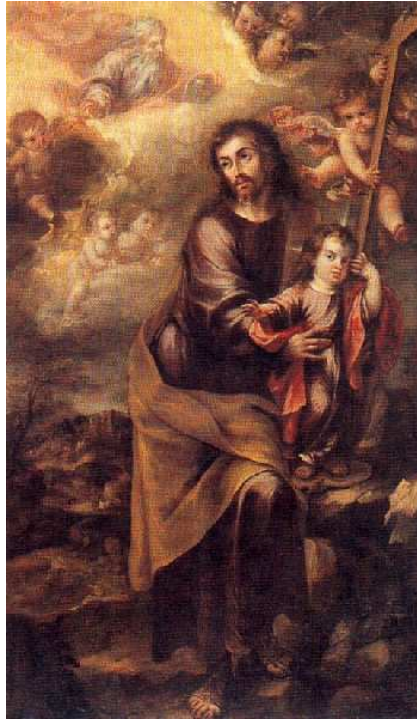
San José y el Niño Jesús Juan de Valdés Leal (1675)

Tomando en cuenta el caso español podemos notar que empieza bajo el influjo del barroco italiano, ante esto y con la llegada del Concilio de Trento surge una nueva gama de imágenes y representaciones Contrarreformistas con varios representantes trascendentales, y son artistas como Francisco Pacheco o Francisco Zurbarán, quienes representarán en ellos no solo las nuevas temáticas sino las nuevas ideas de salvación que se difunden a través de los Santos y de la Virgen María que son considerados intercesores de los hombres ante Dios. Francisco Pacheco en su obra El Arte de la Pintura , establece un tratado en el que se establecen las normas a través de las cuales debe trabajar el artista. En lo referente al arte y la Iglesia Pacheco menciona en su obra: