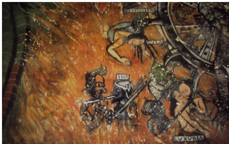
Juicio Final (detalle), Anónimo, Curahuará de Charangas, Oruro - Bolivia

Claro que esta influencia no solo se verá reflejada en la pintura sino también en los sermones que se daban en las iglesias, los mismos que mostraban el panorama de salvación o perdición a cada uno de los fieles y los caminos que llevaban a estos.