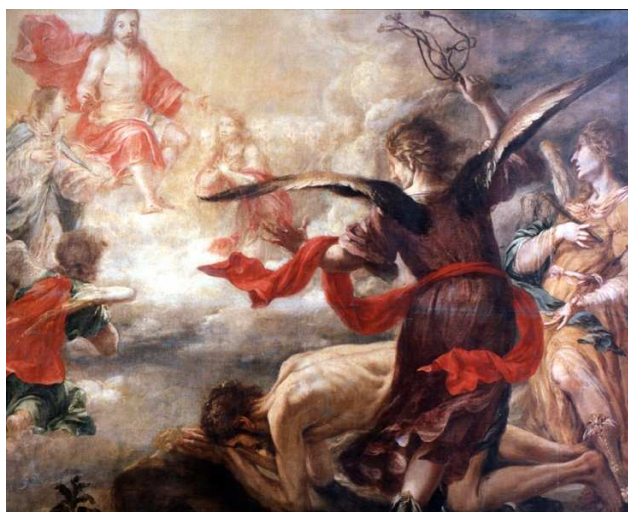
Serie de la Vida de San Jerónimo: San Jerónimo azotado por los Ángeles Juan de Valdés Leal Museo de Bellas Artes de Sevilla (1657)

Otro ejemplo del desarrollado barroco español es el de representaciones pictóricas como vidas de Santos o pasajes bíblicos en los que plasmas en las imágenes el verdadero espíritu contrarreformista, y a través de cada trazo se trata de mover a los espectadores hacia las obras de caridad y penitencia.