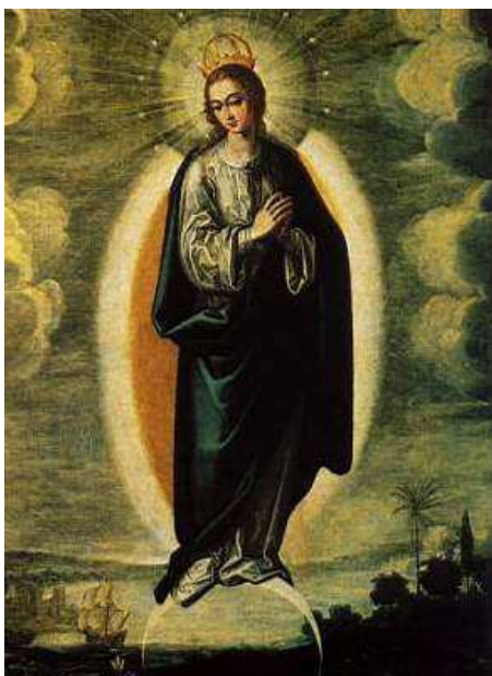
Inmaculada Francisco Pacheco (1621-35)