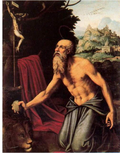
San Jerónimo – Juan de Juanes Siglo XVI

De la misma forma, al tener en cuenta a los santos como intercesores de los seres humanos ante Dios, se convierte a los mártires en los temas principales de muchas de las representaciones religiosas que se realizan a partir de la Contrarreforma, se toma especial atención en aquellos santos que recibieron de Dios mucho más que milagros, como es el caso de Santa Teresa o San Francisco; ambos elegidos por el Padre Eterno para entregarle su alma, ya sea con éxtasis o con estigmas, estos santos movieron profundamente los sentimientos de fe y devoción dentro de los fieles de la época y posteriores.