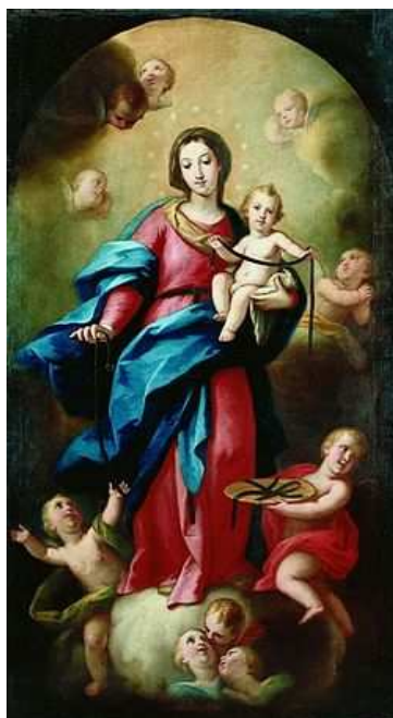
Nuestra Señora de la Consolación y Correa, José Bergara Jimeno, Colección Juan J. Gavara, Valencia, 1760

A pesar de que la advocación original de la Virgen de la Correa no haga mención a sacar las almas condenadas, tenemos una amalgama de nuevos elementos que dotan a esta obra de una veneración aun mayor de la que otorga su origen. Debemos tomar en cuenta el papel que juega en este caso el Purgatorio, que es reconocido como aquel lugar y estado donde con fuego transitorio se purgan ciertamente los pecados, pero no los criminales o capitales que no hubieran sido antes perdonados por la Penitencia, sino los pequeños y menudos que pesan aun después de la muerte. 148