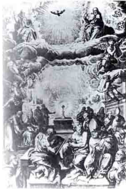
Adoración de la Eucaristía, Matthaus Greuter, Missale Romanum, Madrid, 1595

Además de esto tenemos a la imagen de la virgen como una de las principales representaciones en América y una de las más populares dentro de la devoción posterior a la llegada española a los territorios americanos: