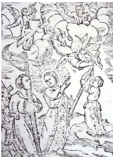
El Seguimiento de la Cruz, Benedictus van Haeflen