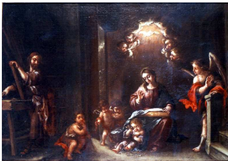
Taller de Nazaret - Juan de Valdés Leal Museo de Bellas Artes de Sevilla, 1680-1685

Uno de los principales dogmas a los que ataca la Reforma es la Virgen y es principalmente es a esta imagen a la que la Iglesia toma como emblema, y le añaden algunos elementos como los del Cantar de los Cantares y los artistas se nutren de estos textos para crear las imágenes de las que se pudieron haber tomado ejemplos en América como las imágenes de Murillo o Montañés, denominada la Virgen Inmaculada, con las manos juntas, del pie sobre las nubes o el creciente de la luna, y complementada con una profundidad pasional reflejada en el rostro. 82 Otro de los temas que toman gran importancia a partir de la Contrarreforma son los referentes a la vida de Jesús, como su nacimiento, la huída a Egipto, la vida familiar en Nazaret y su Pasión, Muerte y Resurrección.