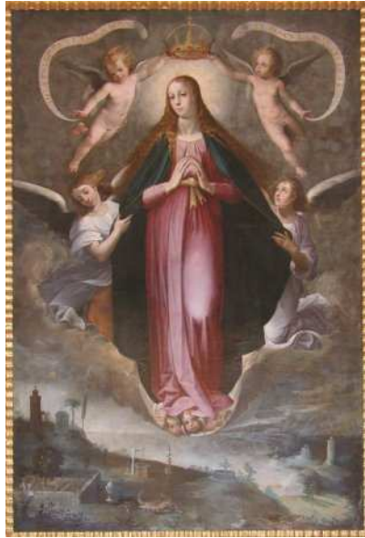
Virgen Tota Pulchra, Giuseppe de Arpino, Iglesia Parroquial de Santo Domingo, Huelva, Siglo XVI