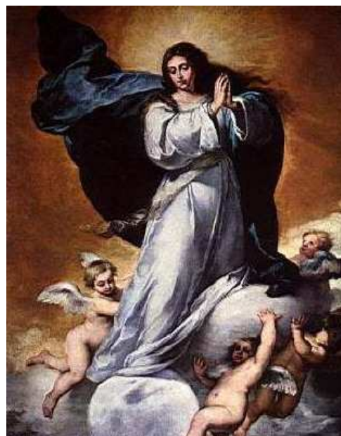
Inmaculada Concepción Esteban Murillo (1650)

Otro ejemplo del desarrollado barroco español es el de representaciones pictóricas como vidas de Santos o pasajes bíblicos en los que plasmas en las imágenes el verdadero espíritu contrarreformista, y a través de cada trazo se trata de mover a los espectadores hacia las obras de caridad y penitencia.