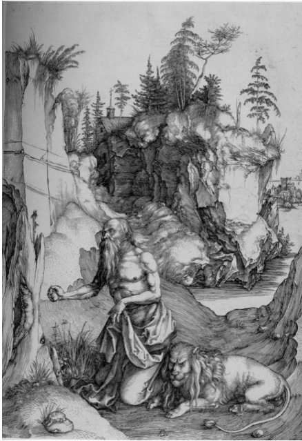
San Jerónimo – A. Dürero (1496)