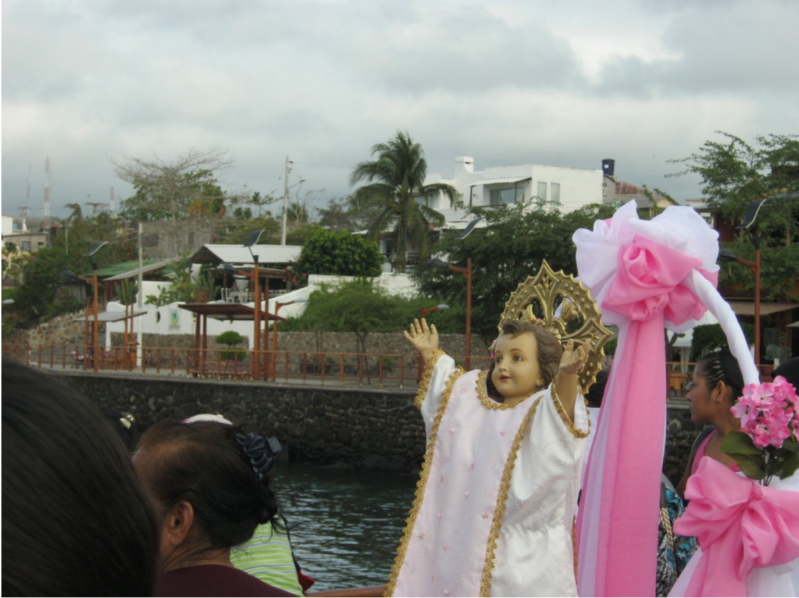
3.11 Fotografía 11: Uno de los murales de la Catedral –Puerto Baquerizo Moreno