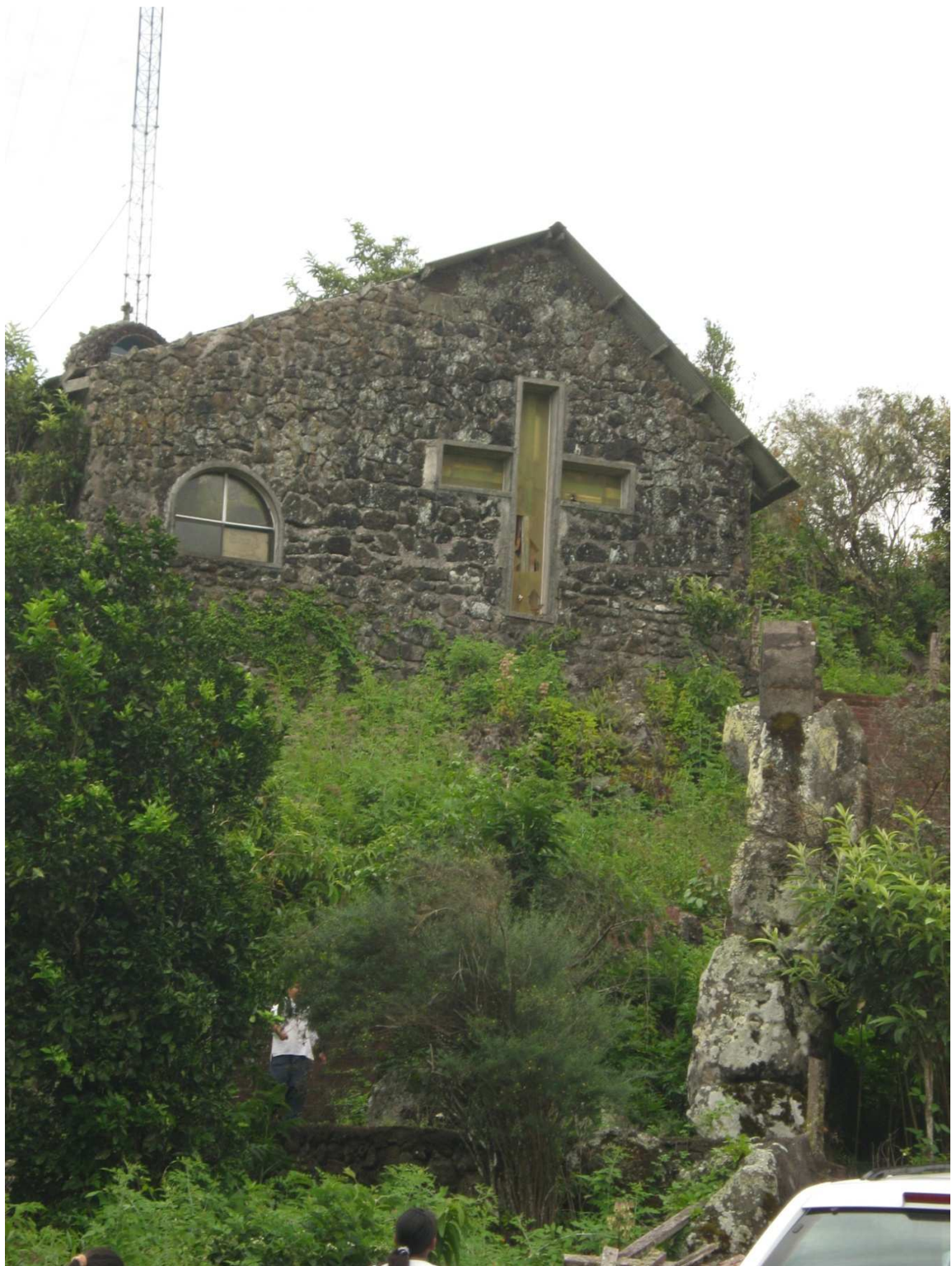
3.16 Fotografía 16: Mesa del altar de la Iglesia de la Virgen del Cisne – Puerto Baquerizo