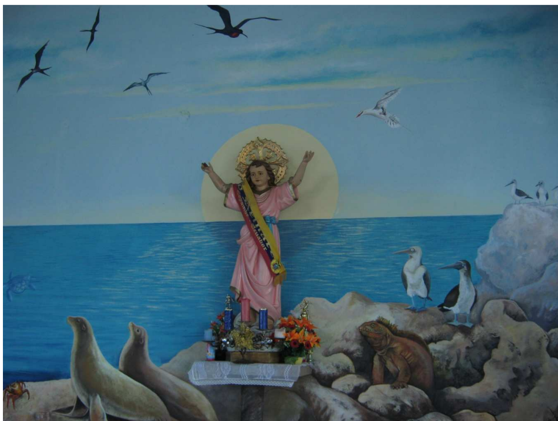
3.4 Fotografía 4: Imagen de San Francisco de Asís –El Progreso