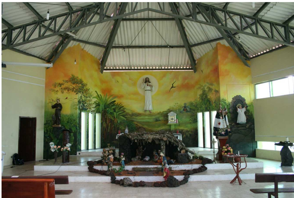
3.8 Fotografía 8: Altar Iglesia Cristo Redentor –El Progreso