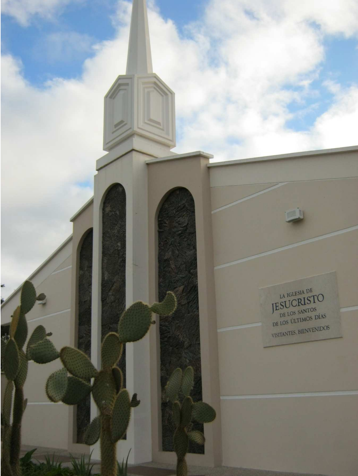
3.15 Fotografía 15: Iglesia de La Soledad –Parte Alta de San Cristóbal