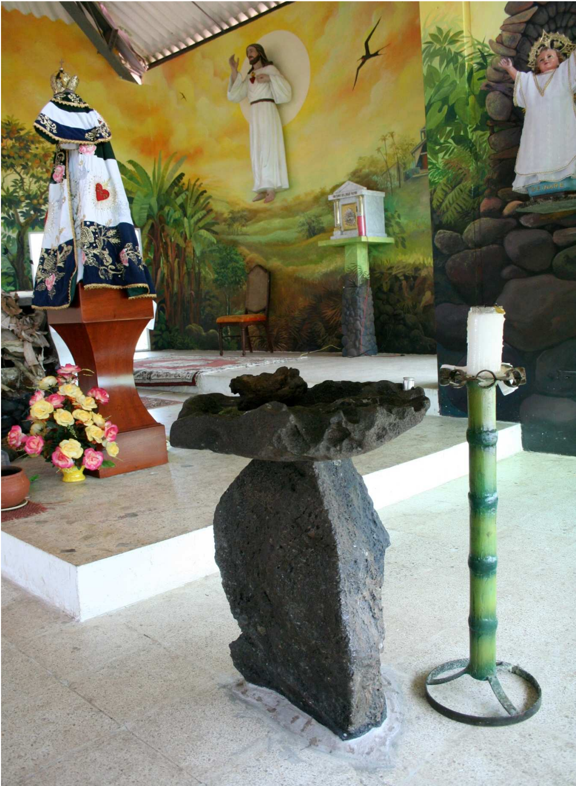
3.9 Fotografía 9: Peregrinación Náutica del Divino Niño –Puerto Baquerizo Moreno