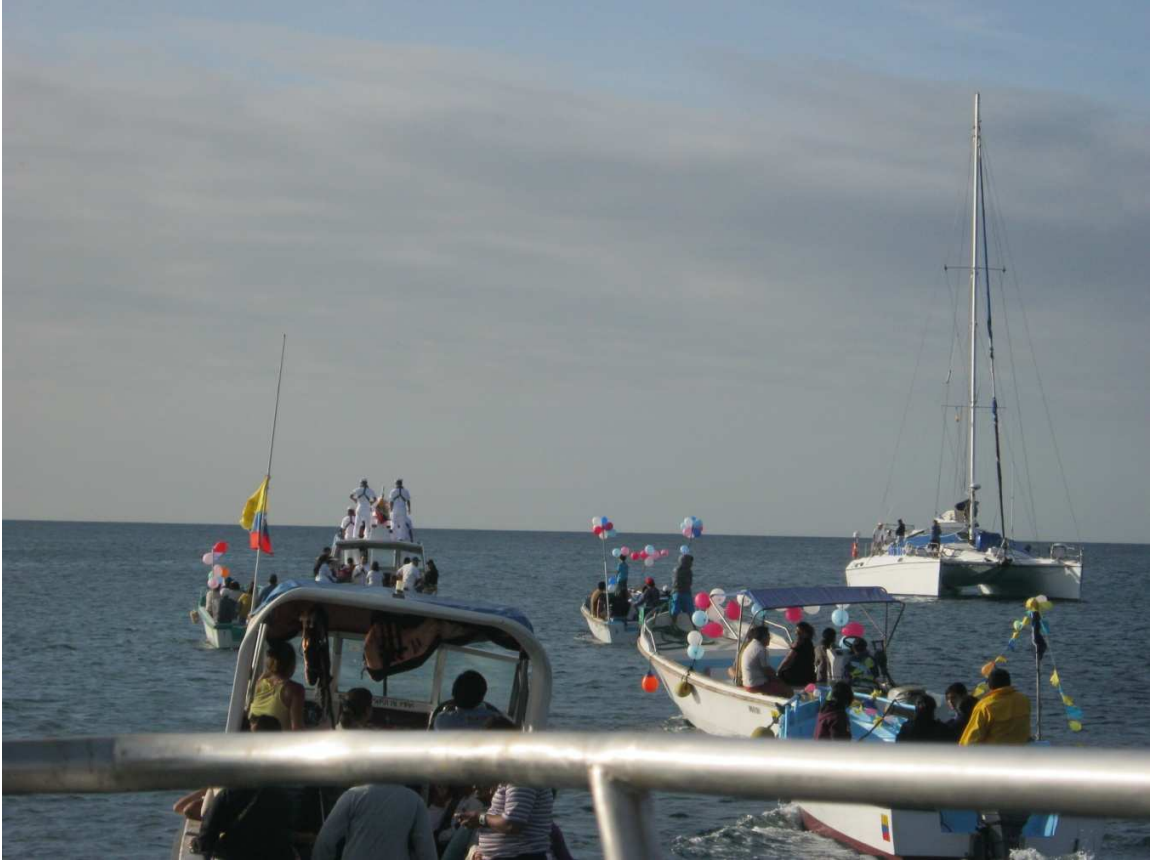
3.10 Fotografía 10: Peregrinación Náutica del Divino Niño –Puerto Baquerizo Moreno