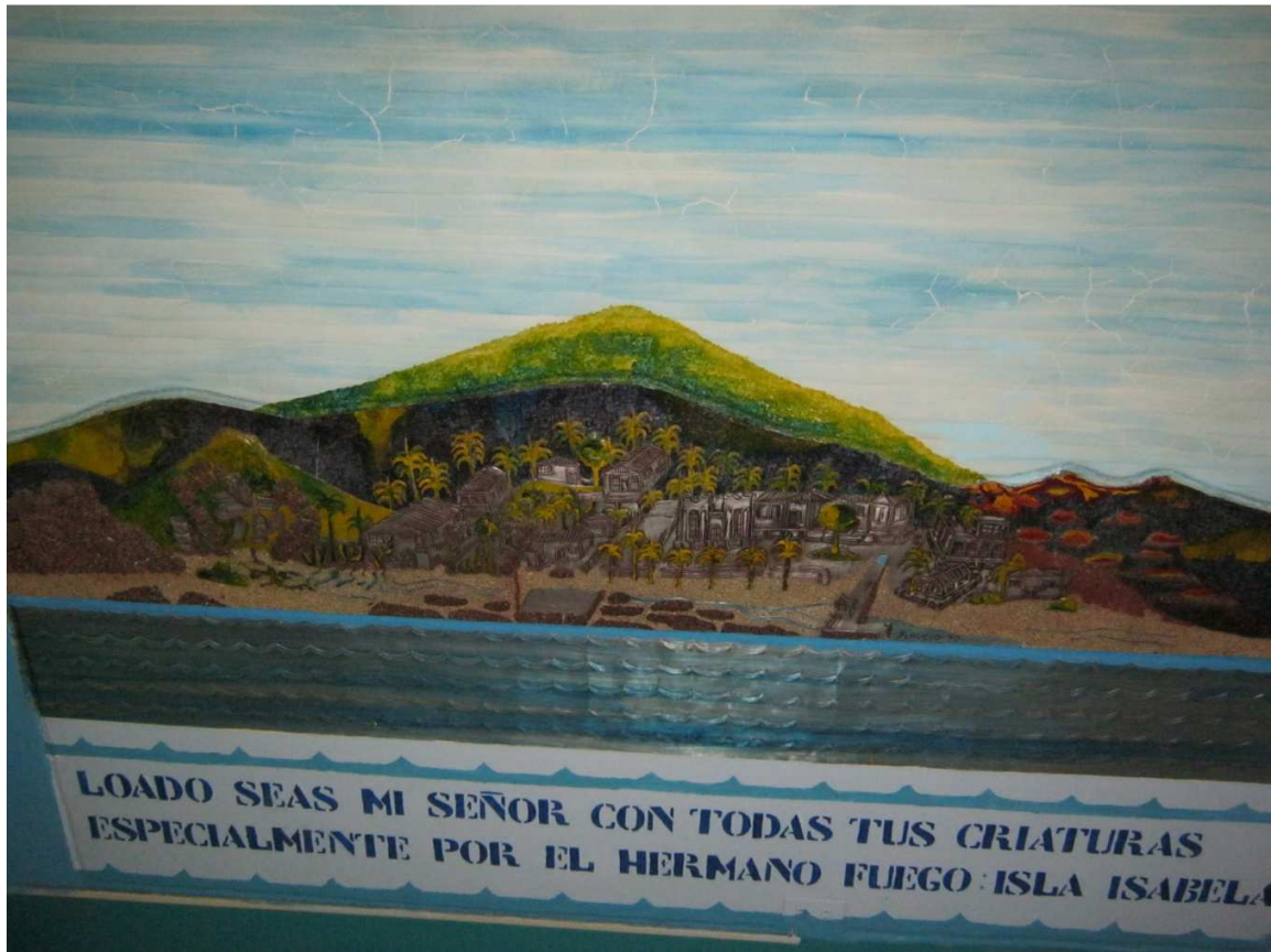
3.12 Fotografía 12: Uno de los murales de la Catedral –Puerto Baquerizo Moreno