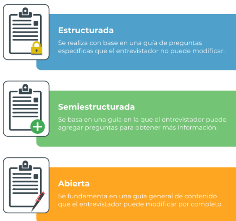
Figura 2. La entrevista

Nota. La figura presenta los tipos de entrevista, por Grinnell y Unrau, 2007 (como se citó en Ramírez, N. L., 2018).