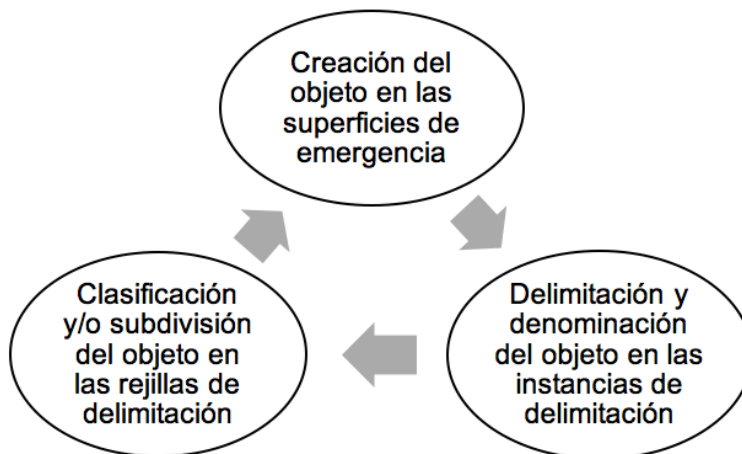
GRÁFICO 2: PROCESO DE CREACIÓN DE CONCEPTOS SEGÚN FOUCAULT

Fuente: Foucault, 1969: 65-69 Elaborado por: Samanta Andrade