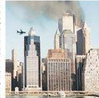
With flames for the New York Times. SECOND PLANE United Airlines Flight 175, crashing near the trade center's south tower.

Then an American Airlines Boeing 757, Flight 77, left Washington's Dulles International Airport bound for Los Angeles, but instead hit the western part of the Pentagon, the military headquarters, where 24,000 people work, at 9:40 a.m. Finally, United Airlines Flight 93, a Boeing 737 flying from Newark to San Francisco, crashed near