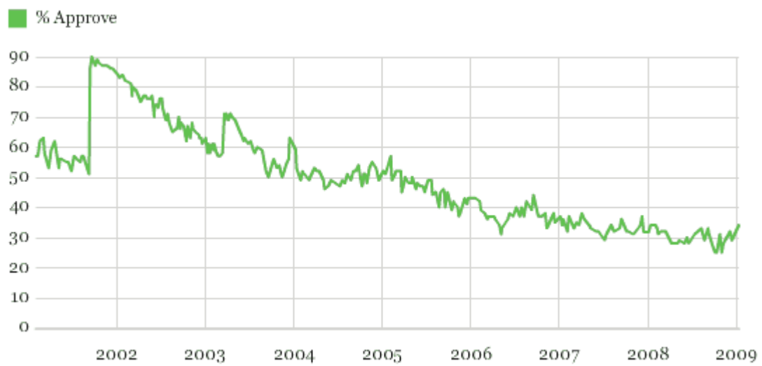
George W. Bush's Job Approval Ratings Trend