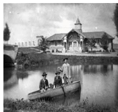
Fotografía 4: Parque de la Alameda, Kiosko de la Escuela de Bellas Artes, Ministerio de Cultura y Patrimonio.

Según los informes del Ministerio de Instrucción pública, el museo se llegó a inaugurar el 14 de mayo de 1917 cuando el presidente Baquerizo Moreno y la Dirección General de Bellas Artes, establecieron el Museo Arqueológico y Galerías Nacionales de Pintura y Escultura en el Kiosko de la Alameda 33 , para esto se dispuso recoger los objetos de arte, antiguos o modernos, cuadros y esculturas pertenecientes al Estado que se