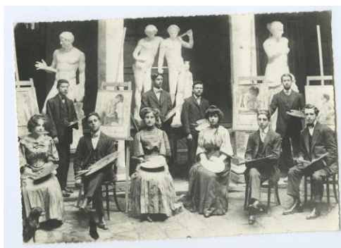
Fotografía 1: Escuela de Bellas Artes, Instituto Nacional de Patrimonio Cultural.

La fundación de la Escuela de Bellas Artes en 1904 marcó un hito en la construcción de la nación moderna a través de la educación y producción de las Bellas Artes. En el primer momento de creación, se enfocó en el desarrollo estético del arte y la representación de la naturaleza, en sus diferentes formas: el dibujo, la escultura, la arquitectura, la litografía, la fotografía, etc. (Registro oficial N° 791, 1904,