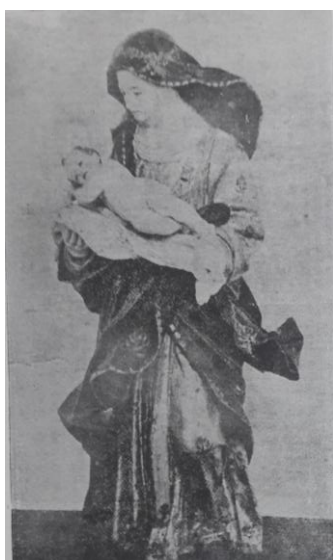
Fotografía 5: Santa Rosa de Lima Atribuida a Miguel de Santiago XVIII. Publicada en el texto Museo Arte Colonial en Quito.

Francisco de Quito ” (Pedro Pablo Traversari, 1914); “ Contribuciones a la Historia del Arte en el Ecuador ” (José Gabriel Navarro, 1921) “ El arte de la época Colonial, Gorivar y otros artistas ” (Jesús Vaquero Dávila 1939). Durante de la segunda mitad del siglo XX, se realizaron publicaciones del hacendado, arqueólogo e historiador Jacinto Jijón y Caamaño “ Breves Contribuciones Históricas sobre Arte Quiteño ” (1976); “ ¿Quién pintó los profetas de la Iglesia de la Compañía? ” (1950)” aportes con los cuales, el arte colonial adquirió valor, como un elemento justificativo de progreso y civilización.