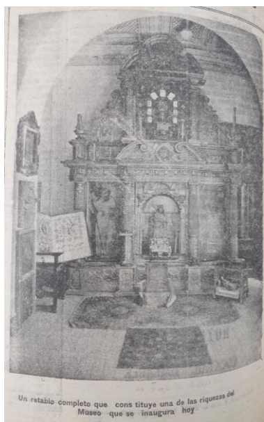
Fotografía 9