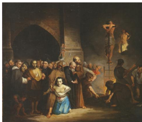
Fotografía 8: La Inquisición de Joaquín Pinto XIX. Ministerio de Cultura y Patrimonio.

La colección de arte colonial contaba con obras de Miguel de Santiago, Samaniego, Gorívar, Caspicara, Manosalvas, Cadena, Antonio Salas, Joaquín Pinto entre otros pintores y escultores, así como objetos arqueológicos (Ministerio de Instrucción Pública, 1928, p. 126). Existió un proceso de selección, descarte, clasificación y definición de aquello que merecía ser preservado en un espacio en el que confluyeron relaciones entre el gusto y el conocimiento. La adquisición