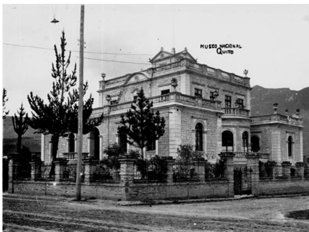
Fotografía 7: Quinta Presidencial. Ministerio de Cultura y patrimonio.

hasta aquí. Este museo se inauguró como uno de los más célebres eventos dentro de los festejos del 24 de mayo de aquel año en la Quinta Presidencial ubicada en el sector del Girón. 41 (Ver fotografía 7). La apertura del Museo de Arte Nacional, fue anunciada con anticipación en varios periódicos del país. Durante la intervención del Ministro de Instrucción Pública, Manuel María Sánchez habló sobre la