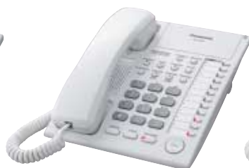
■ KX-T7720 Unidad con Altavoz