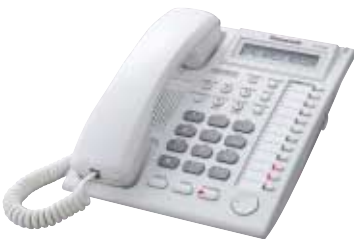
■ KX-T7730 Unidad con LCD y Altavoz