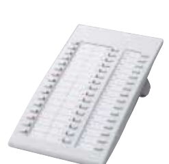
■ KX-T7740 Consola DSS