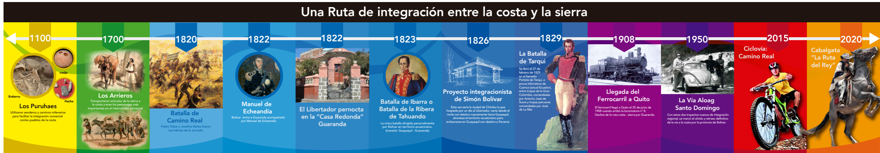
Gráfico N° 44: Línea de Tiempo total, estructura cromática y modular.