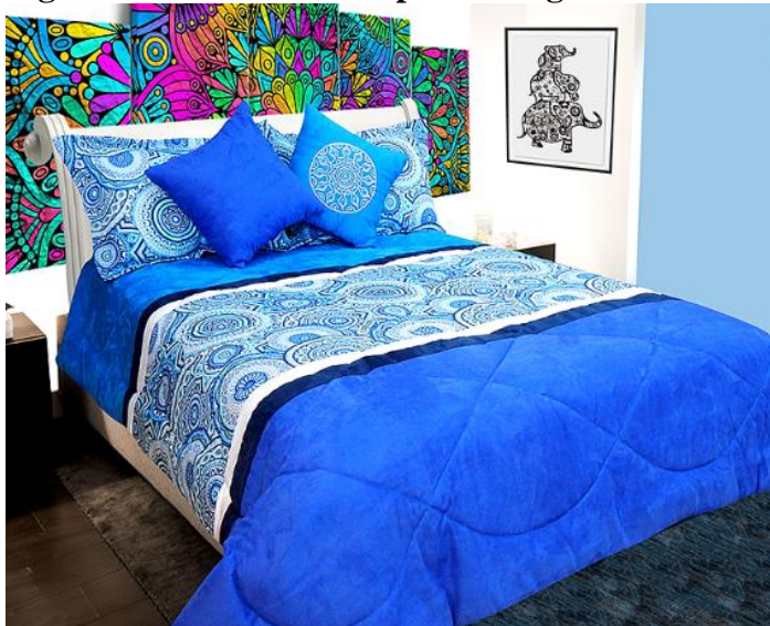
Figura 1. Productos línea para el hogar