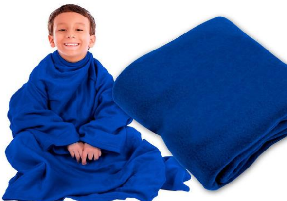
Figura 3. Producto línea promocional