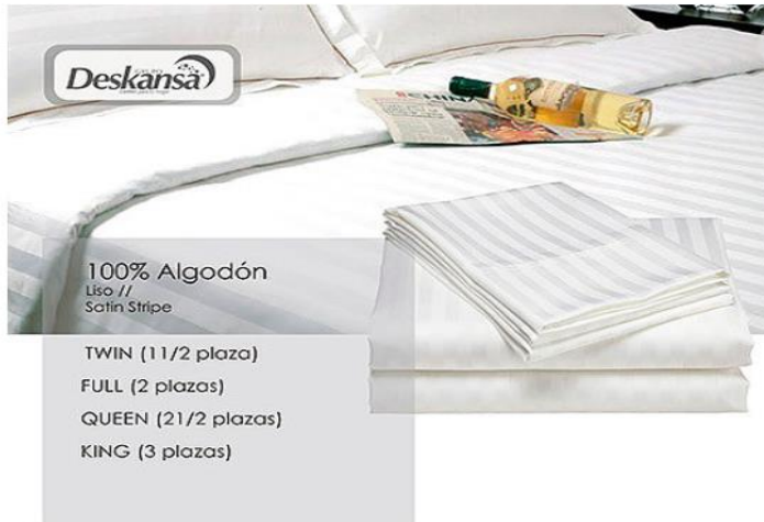
Figura 2. Productos línea hoteles