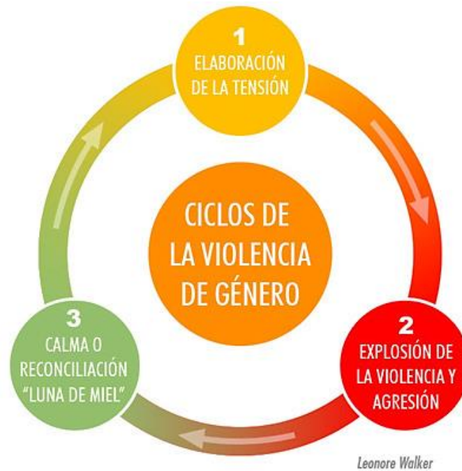
Gráfico 1-1: Ciclo de la Violencia

Elaborado por: Perspectiva Criminológica