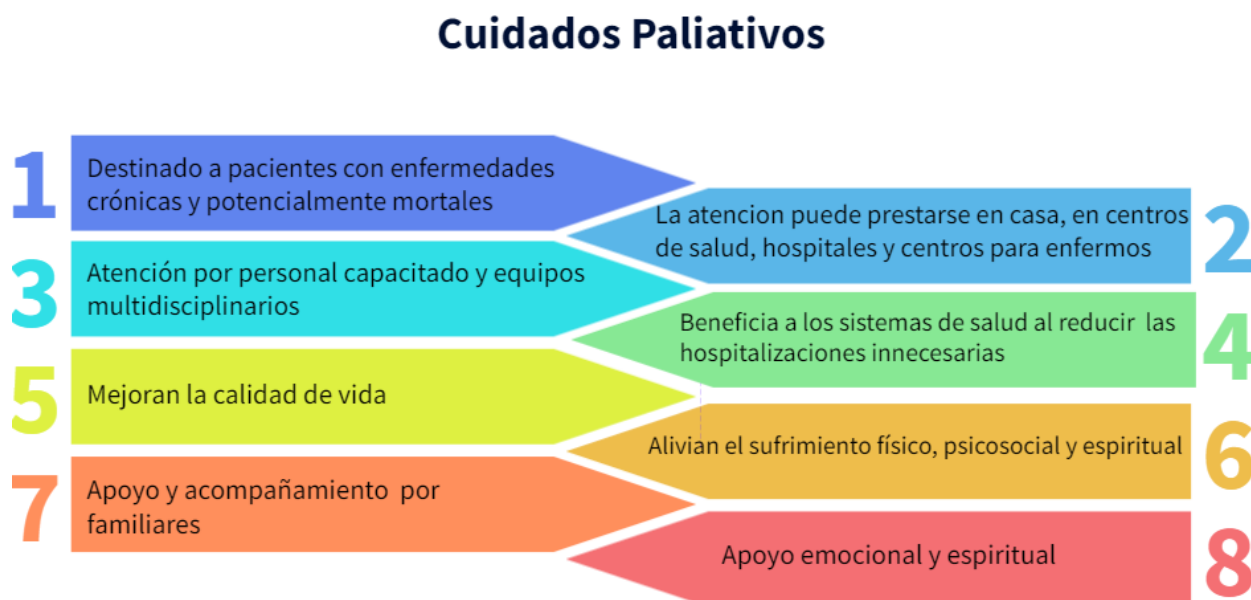
Figura. 1 beneficios

Elaboración propia a partir de información de la (OMS, 2021).