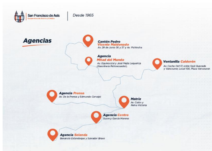
Ilustración 1. Mapa de Agencias