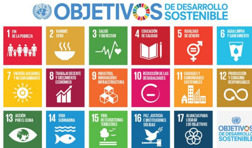
Ilustración 4 Objetivos de Desarrollo Sostenible ODS 2030.

Fuente: NACIONES UNIDAS Elaboración: Autora/Naciones Unidas