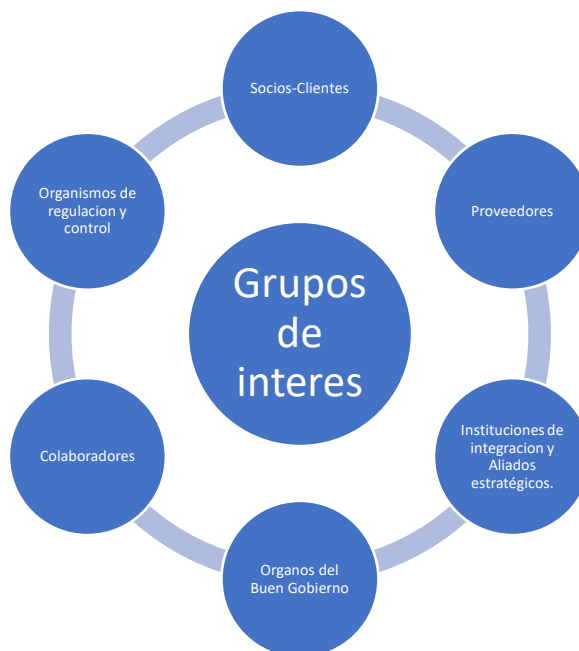
Ilustración 3: Grupos de interés de la Cooperativa San Francisco de Asis.