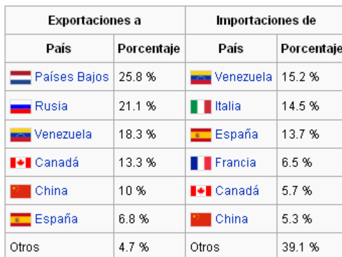
TABLA1 CUBA, PRINCIPALES SOCIOS COMERCIALES