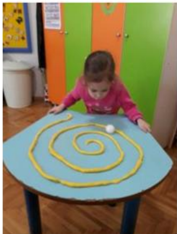
Imagen de referencia "Laberinto"