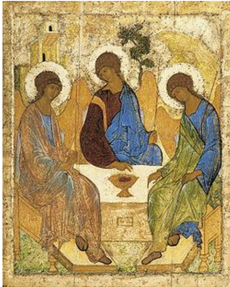
El icono de "La Trinidad del Antiguo Testamento", pintura de Andréi Rubliov, comienzos del siglo XV.