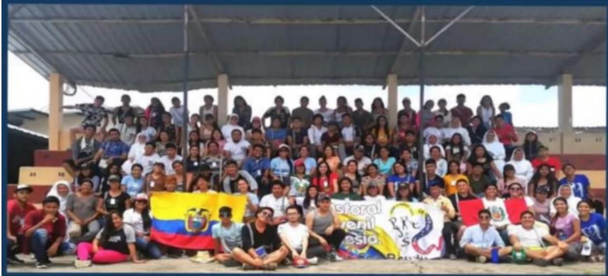
Encuentro binacional Ecuador- Perú realizado en Viche en febrero de 2020