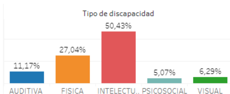
Gráfica 1: Estudiantes con Discapacidad por Tipo de Discapacidad