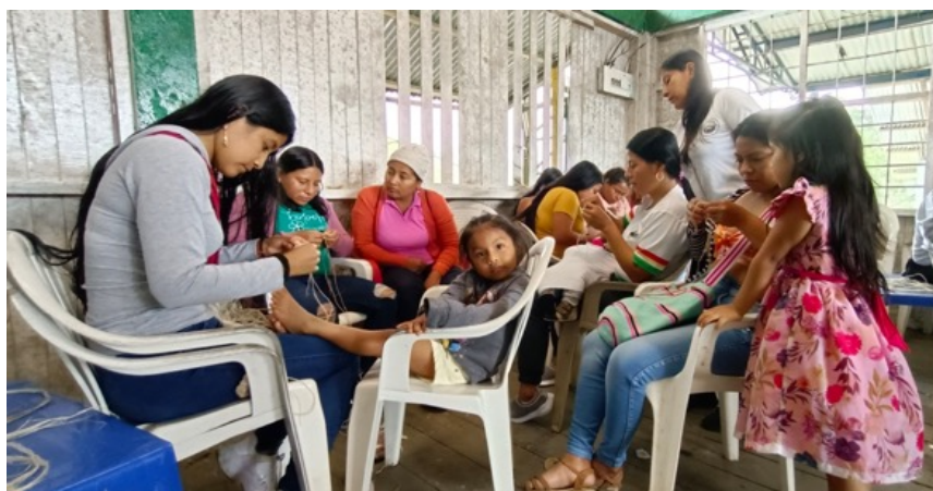
FOTOGRAFIA Predio El Verde, Resguardo del Gran Sábalo, 1 de octubre 2022

logrado llevar su situación a instancias como la ONU y la OEA. Esta visibilidad ha permitido ejercer presión sobre el gobierno colombiano y sobre otros actores relevantes para que adopten medidas concretas de protección. Además, ha fortalecido las redes de apoyo que los Awá han construido junto con otras comunidades indígenas y organizaciones de la sociedad civil, lo que les ha permitido intercambiar estrategias de resistencia y obtener recursos para hacer frente a los desafíos que persisten (Montero, 2022).