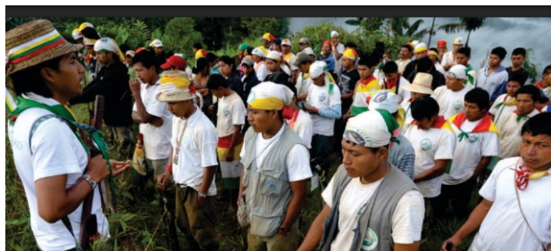
Fotografía de la guardia indígena posterior a la masacre de Tortugaña Telebí, marzo 2009.

La masacre de Tortugaña-Telebí se constituyó como un acontecimiento emblemático y profundamente doloroso para el pueblo Awá, mostrando las consecuencias devastadoras del conflicto armado. Diez años después, este hecho fue documentado como parte del proceso de restitución de derechos territoriales, marcando un hito que también significó un punto de inflexión para la organización y movilización de las comunidades indígenas. Desde el mismo suceso, en abril de 2009, se llevó a cabo la “Minga Humanitaria y de Resistencia Indígena por la Vida y la Dignidad del Pueblo Awá”, la cual culminó en una audiencia pública que incluyó un acto simbólico en memoria de dos niños Awá asesinados durante la masacre. Estos niños fueron arrancados del vientre de sus madres y sus nombres, Ñambí y Telebí Cuazaluzan, remiten a los ríos que bañan el territorio de Tortugaña-Telebí. Este acto no solo honró la memoria de las víctimas, sino que también reafirmó el compromiso de la guardia indígena en la defensa de la vida, el territorio y la dignidad de su pueblo. La masacre, en este sentido, se erige como un símbolo de la lucha Awá por la justicia, la verdad y la reparación en el marco del conflicto armado colombiano.