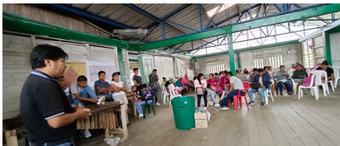
FOTOGRAFIA Predio El Verde municipio de Barbacoas, 8 de octubre 2022

Solo a partir de los años ochenta comenzó un proceso de movilización y organización que se consolidó en los noventa con la creación de la Asociación de Autoridades Tradicionales del Pueblo Indígena Awá (UNIPA). Esta surge como respuesta a los crecientes abusos contra los territorios ancestrales cometidos por empresas palmicultoras y camaroneras en el municipio de Tumaco. A través de este proceso organizativo, el pueblo Awá define cuatro pilares fundamentales que rigen su vida colectiva: unidad, territorio, cultura y autonomía.