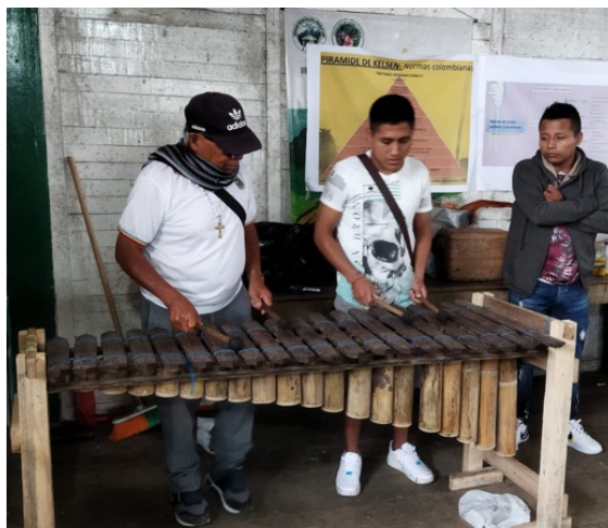
Fotografía Predio el Verde, Resguardo del Gran Sábalo, Barbacoas 8 de octubre del 2022.

ejemplo de ello es la delimitación de zonas destinadas exclusivamente al pan coger , así como las zonas de protección y los sitios sagrados, que son primordiales para la existencia del bosque húmedo y tropical que rodea al pueblo Awá.