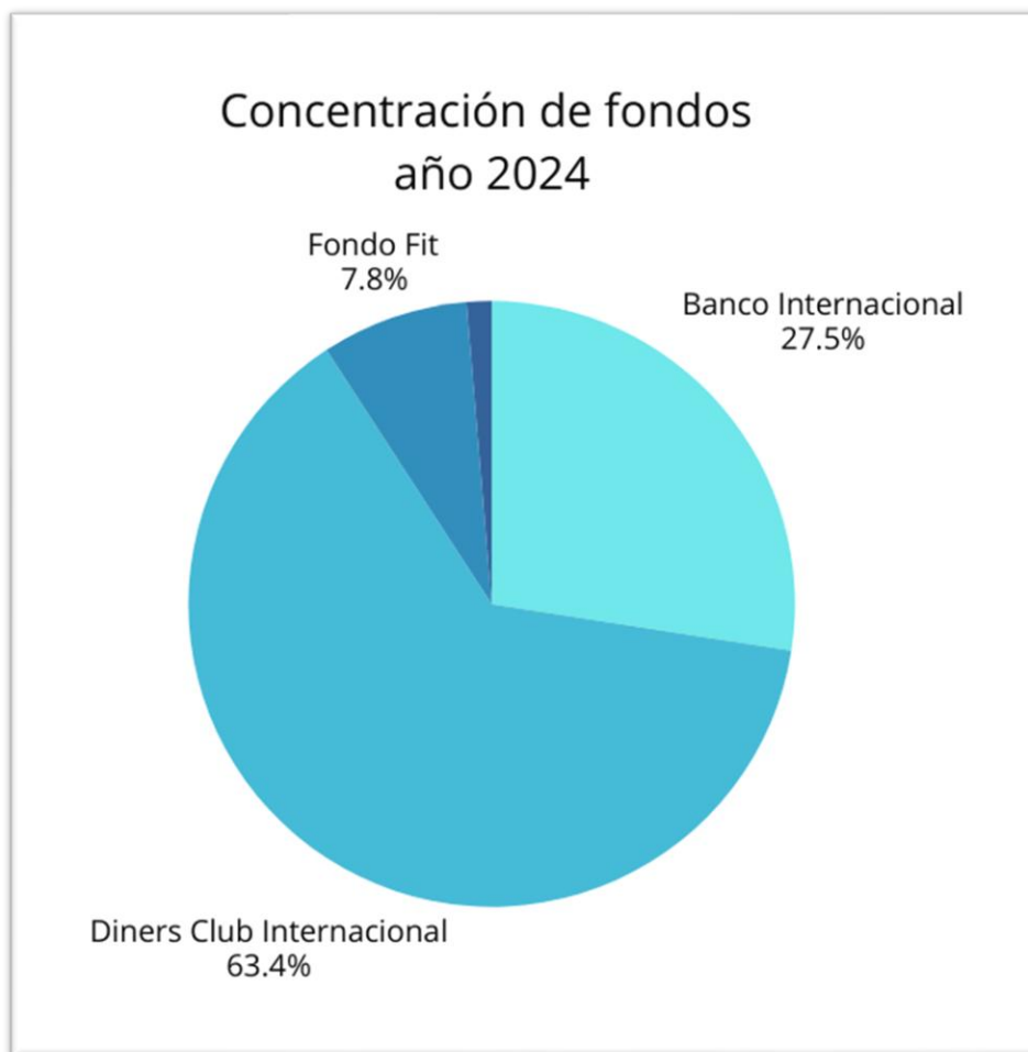
Figura 4. Concentración de fondos año 2024