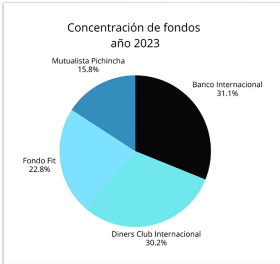
Figura 3. Concentración de fondos año 2023

Estas concentraciones se pueden visualizar en las siguientes figuras, donde se muestran los porcentajes invertidos por institución.