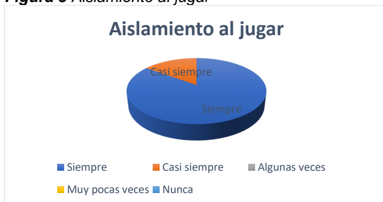
Figura 5 Aislamiento al jugar

Nota: La figura muestra en términos porcentuales, si los niños se aíslan por determinado juego.