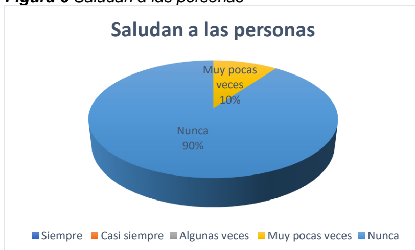
Figura 6 Saludan a las personas

Nota: La figura muestra en términos porcentuales, si los niños saludan a las personas.