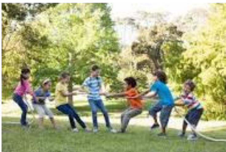
Figura 19 Juego halando la cuerda

Nota: Esta figura muestra el juego halando la cuerda entre los niños.