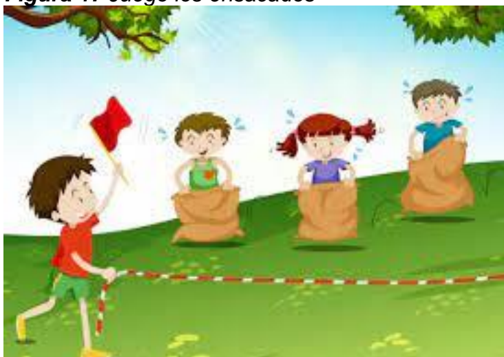
Figura 17 Juego los ensacados

Nota: Esta figura muestra el juego los ensacados entre los niños