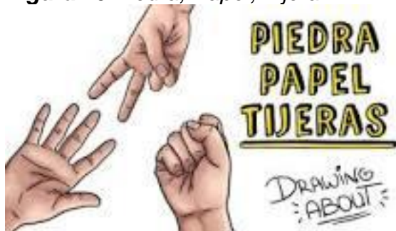
Figura 20 Piedra, Papel, Tijera

Nota: Esta figura muestra el juego piedra, papel y tijera entre los niños.