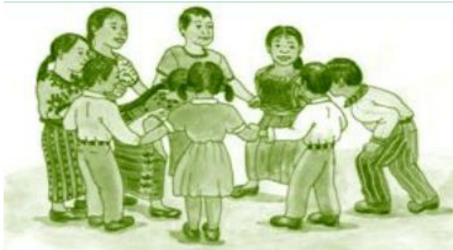
Figura 11 Juego gato y ratón

Nota: Esta figura muestra el juego el gato y el ratón entre los niños