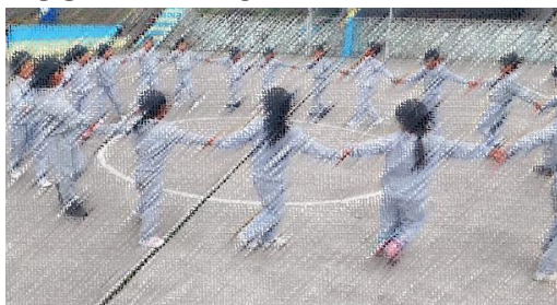
AGUA DE LIMÓN