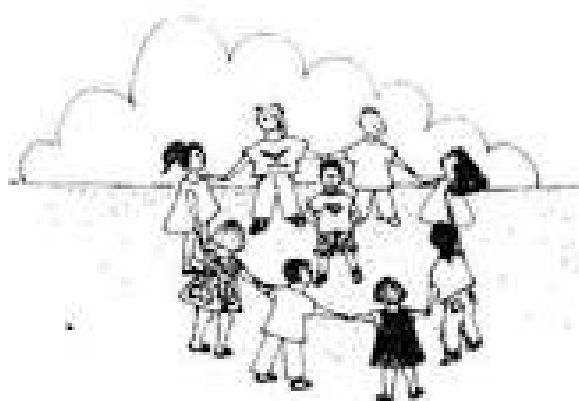
Figura 13 Juego Agua de limón

Nota: Esta figura muestra el juego Agua de limón entre los niños.