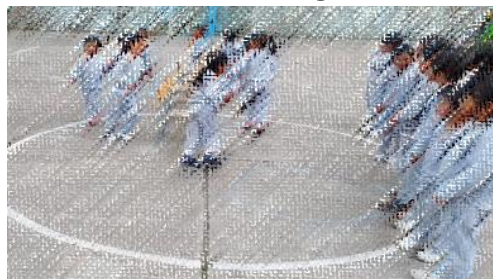
EL BAILE DE LA SILLA