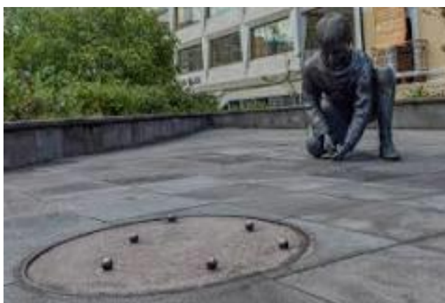
Figura 18 Juego las canicas

Nota: Esta figura muestra el juego Las canicas entre los niños.