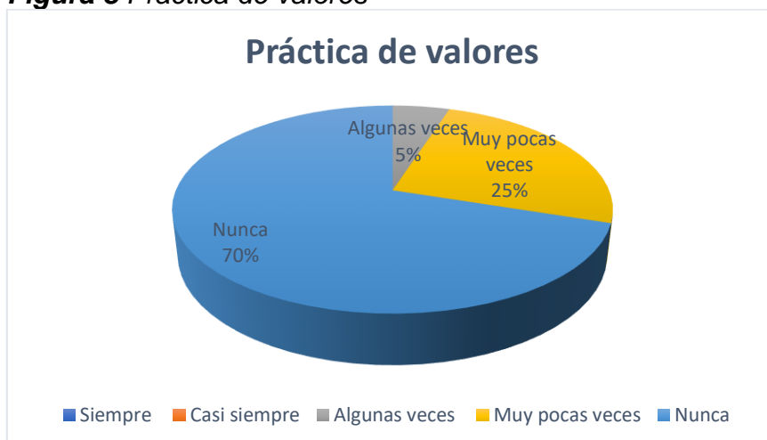
Figura 8 Práctica de valores

Nota: La figura muestra en términos porcentuales, si los niños practican valores entre sí.