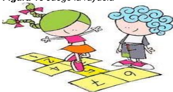
Figura 16 Juego la rayuela

Nota: Esta figura muestra el juego de la rayuela entre los niños