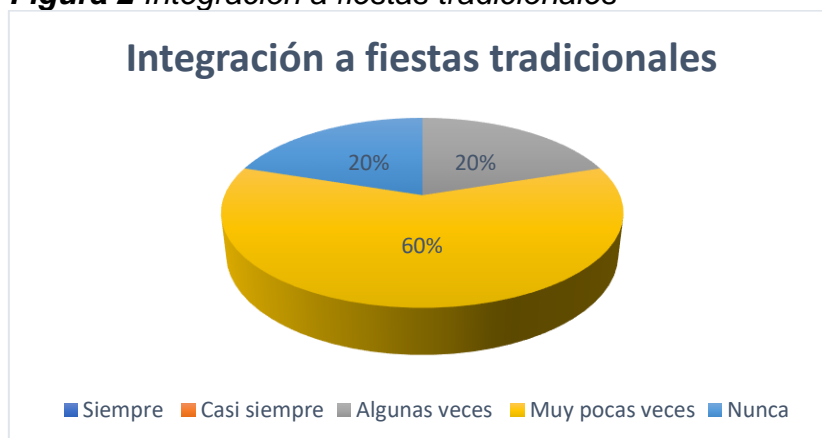
Figura 2 Integración a fiestas tradicionales

Nota: La figura muestra en términos porcentuales, si los niños se integran cuando hay fiestas tradicionales.