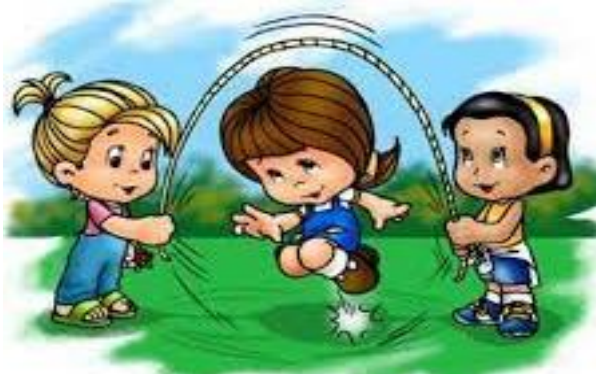
Figura 15 Juego salto de la cuerda

Nota: Esta figura muestra el juego el salto de la cuerda entre los niños.