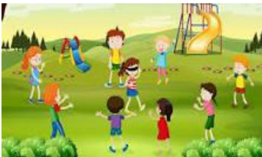
Figura 12 Juego gallinita ciega

Nota: Esta figura muestra el juego de la gallinita ciega entre los niños.