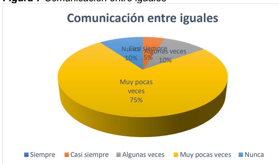
Figura 7 Comunicación entre iguales

Nota: La figura muestra en términos porcentuales, si los niños se comunican entre sí.