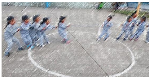
HALANDO LA CUERDA