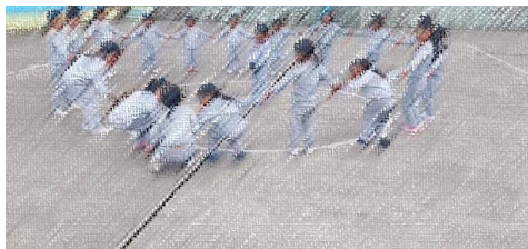
EL GATO Y EL RATÓN