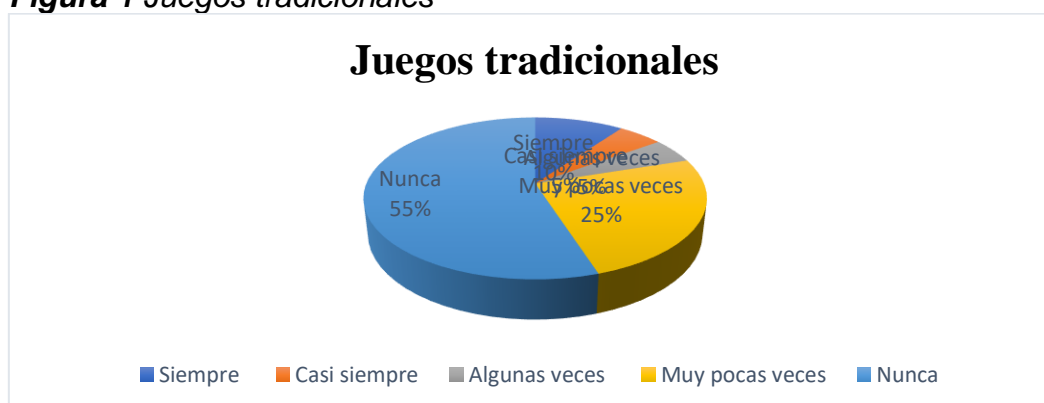
Figura 1 Juegos tradicionales