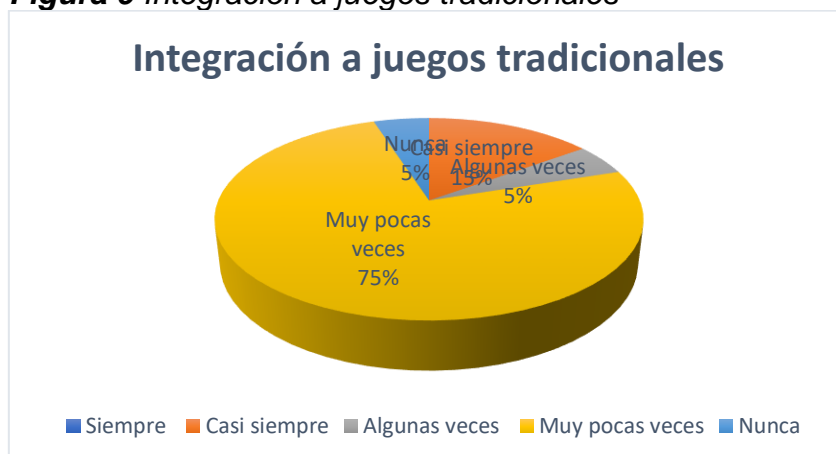
Figura 9 Integración a juegos tradicionales

Nota: La figura muestra en términos porcentuales, si los niños se integran a juegos tradicionales.