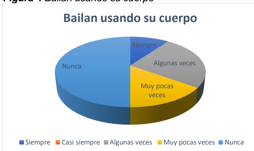
Figura 4 Bailan usando su cuerpo

Nota: La figura muestra en términos porcentuales, si los niños usan su cuerpo para bailar.