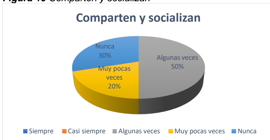
Figura 10 Comparten y socializan

Nota: La figura muestra en términos porcentuales, si los niños comparten sus juguetes con los demás niños.