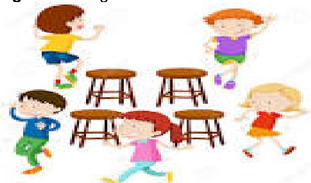
Figura 14 Juego baile de la silla

Nota: Esta figura muestra el baile de la silla entre los niños