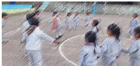
LA GALLINA CIEGA