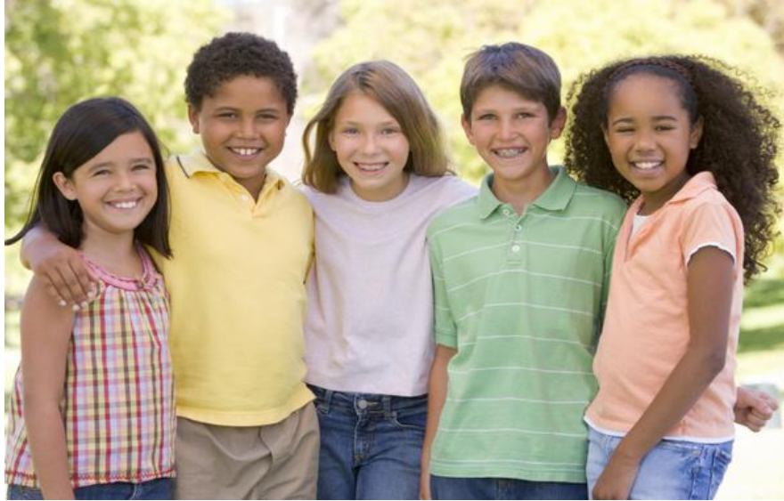
Gráfico 5. Sesión social