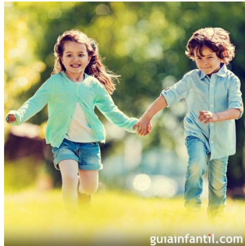
Gráfico 1. Sesión emocional