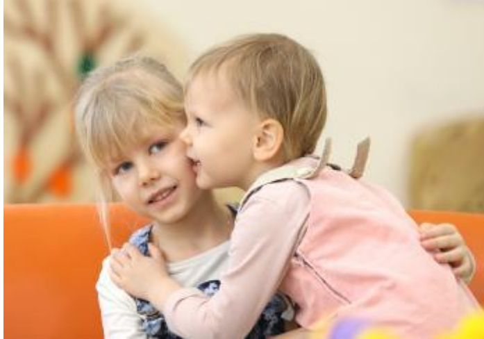
Gráfico 2. Sesión físico