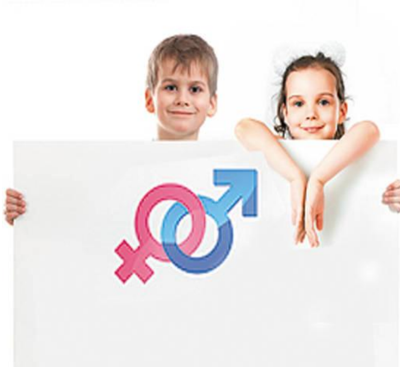
Gráfico 3. Sesión intelectual