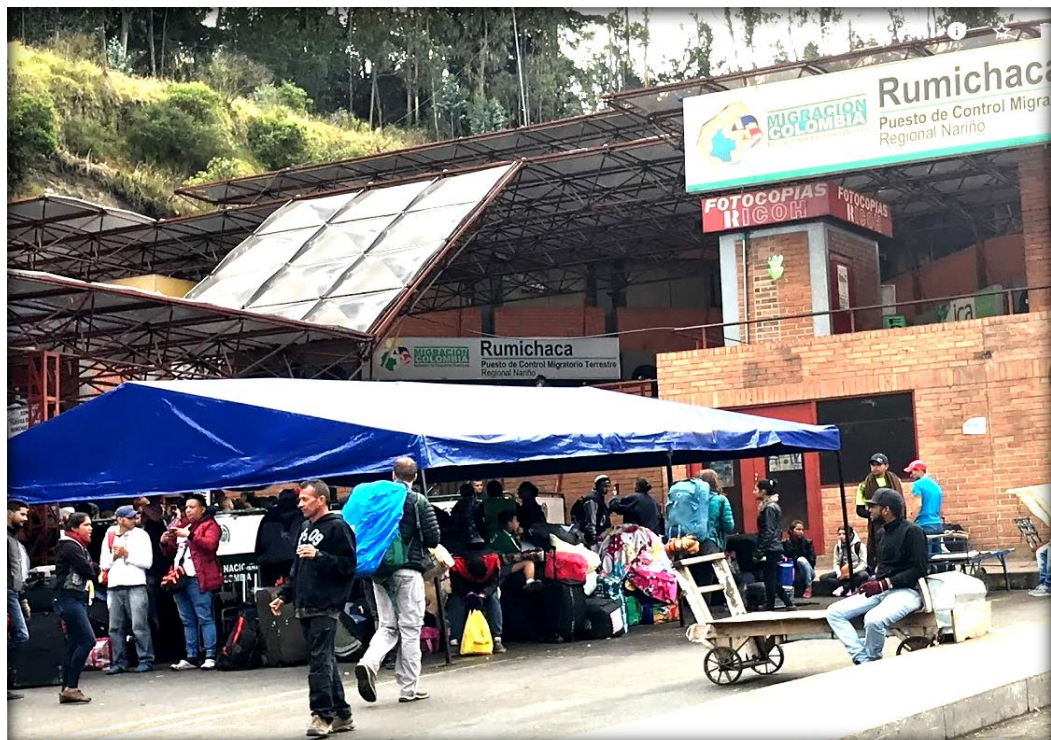
Ilustración N°13 Migración Colombia