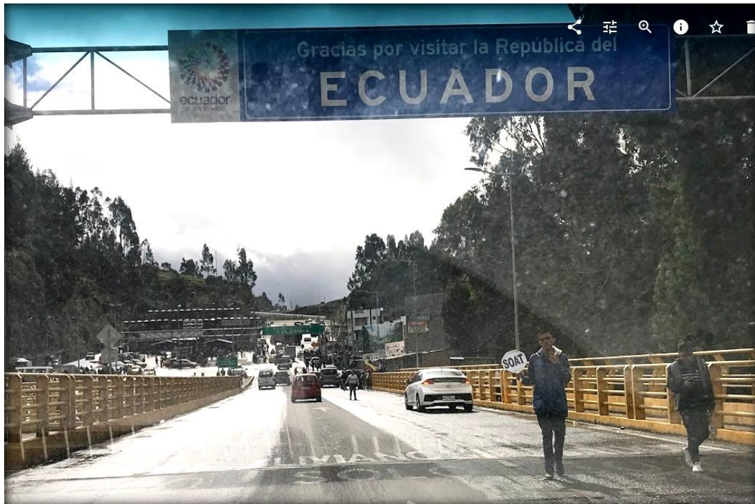
Ilustración N° 12 Puente Rumichaca