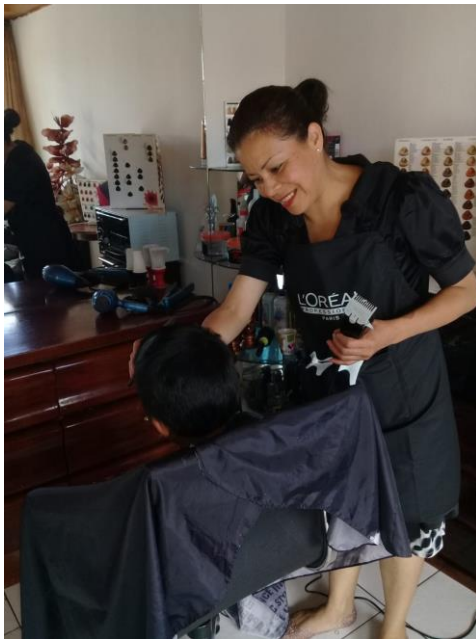
Ilustración N° 9