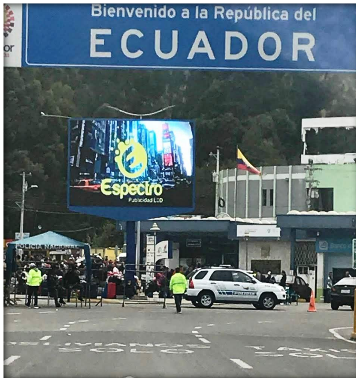
Ilustración N°15 República del Ecuador