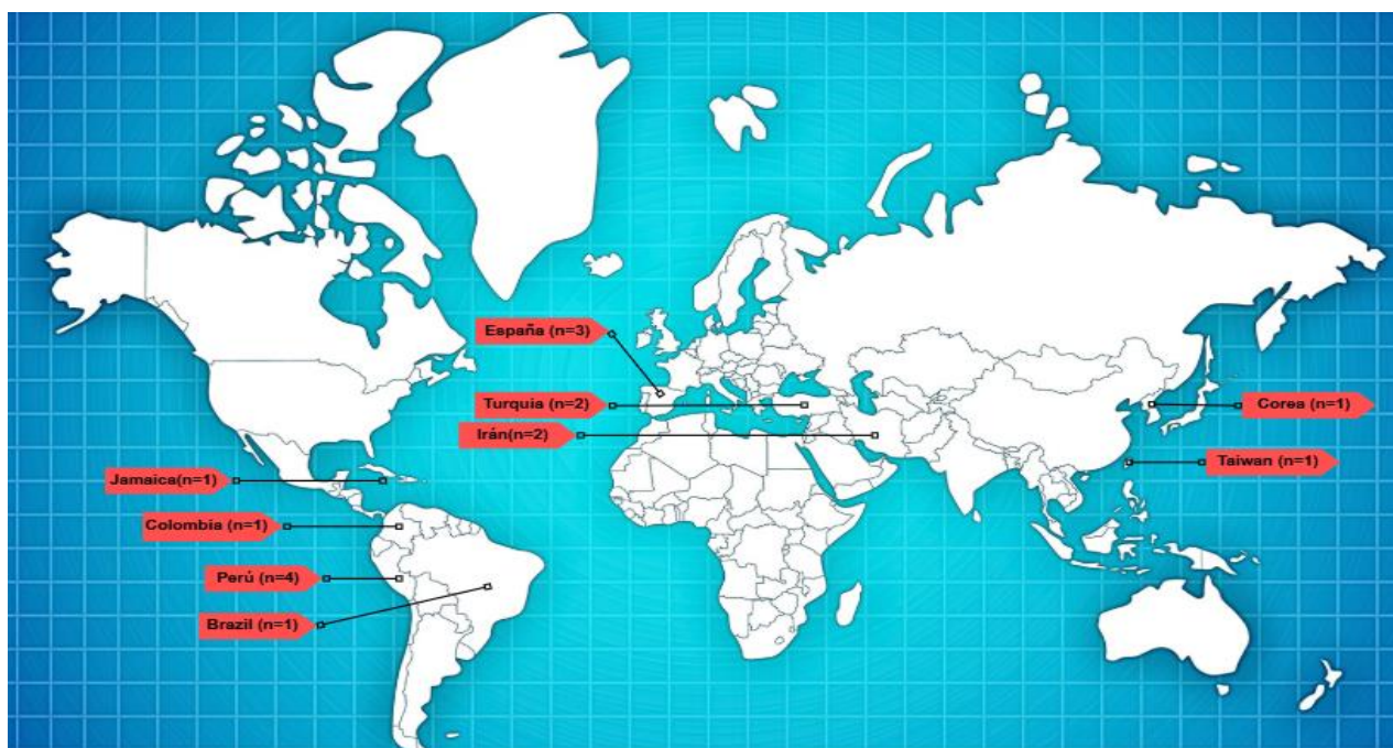
Figura 2. Geografía de las principales investigaciones sobre la empatía y su relación con la calidad de atención.

Esta sección presenta en la figura 1, los hallazgos clave de 16 investigaciones sobre la alianza terapéutica “empatía” de enfermería y la calidad de atención percibida por el paciente en servicios críticos. Estas investigaciones se concentraron entre 2015 y 2024, indicando un interés creciente en conocer el beneficio de la alianza terapéutica en la atención en cuidados críticos. La mayoría de los artículos se encuentran en el idioma inglés, más sin embargo el 50% de las investigaciones fueron realizadas en países de habla hispana lo cual no se aleja de la realidad de nuestro país y nos permite comprender esta temática emergente, ( figura 2 ), no obstante, es necesario expandir la investigación para evaluar la satisfacción del paciente en diversos contextos culturales y clínicos.