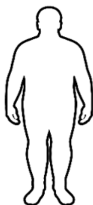
Obesidad IMC 30 a 34,9