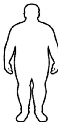
Obesidad Grave IMC 35 a 39,9