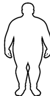
Obesidad Mórbida IMC =>40