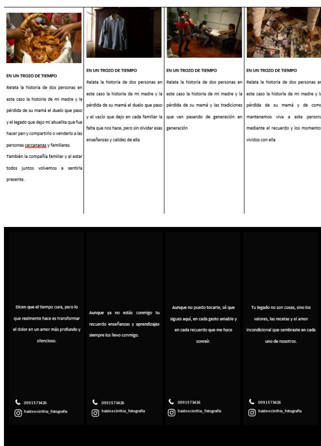
Diseño de separadores de libros

El día de la inauguración fue el 14 de agosto del 2025 fue la inauguración de la exposición, los separadores estaban colocados casi a un lado de la exposición para que no interrumpa la historia, las imágenes se encontraban en diferentes alturas, distancias de la pared y tamaños todo esto tenía el propósito de llevar al espectador a esos sentimientos de vacío, tristeza, pero también la alegría, la superación.