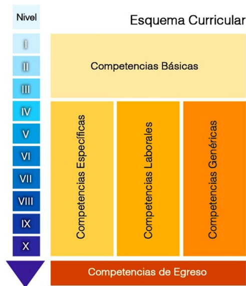
Ilustración 2. Organización Curricular

Para sistematizar el diseño curricular de la Carrera de Diseño Textil e Indumentaria se tomó como referencia el método de análisis ocupacional o DACUM ( Developing a Curriculum ), proveniente del seguimiento a graduados y requeridos por empresarios en el campo y el quehacer ocupacional en los profesionales de pregrado. De estas funciones u ocupaciones se establecieron las competencias profesionales que se consolidaron con la definición de logros de aprendizaje establecidos de manera deductiva: (1) desde el campo disciplinar, (2) desde las áreas de formación de la disciplina y (3) desde las asignaturas. Este entramado aportó para la definición del área de acción denominadas competencias de egreso.