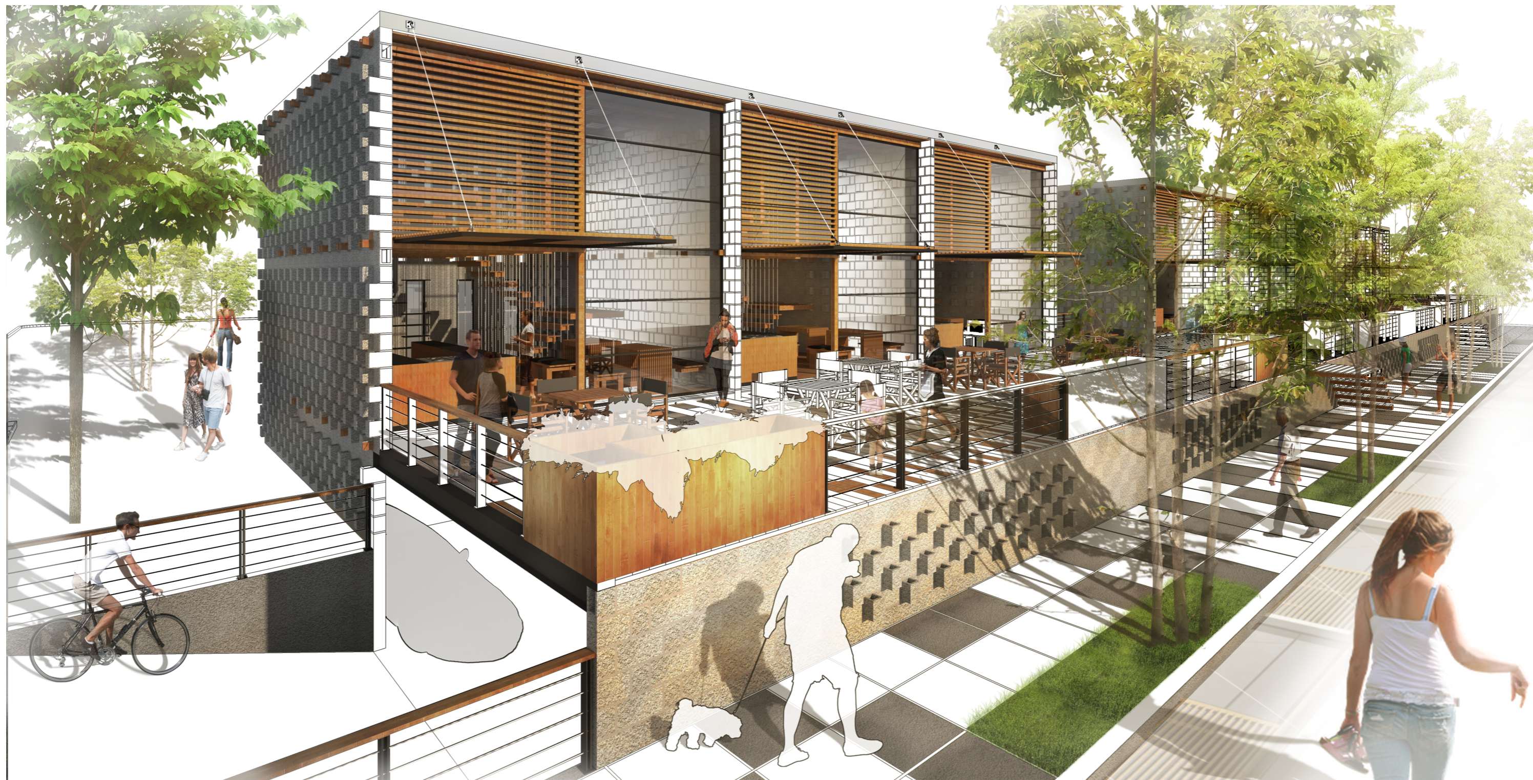
LOCALES + BOULEVARD + ESTACIONAMIENTO