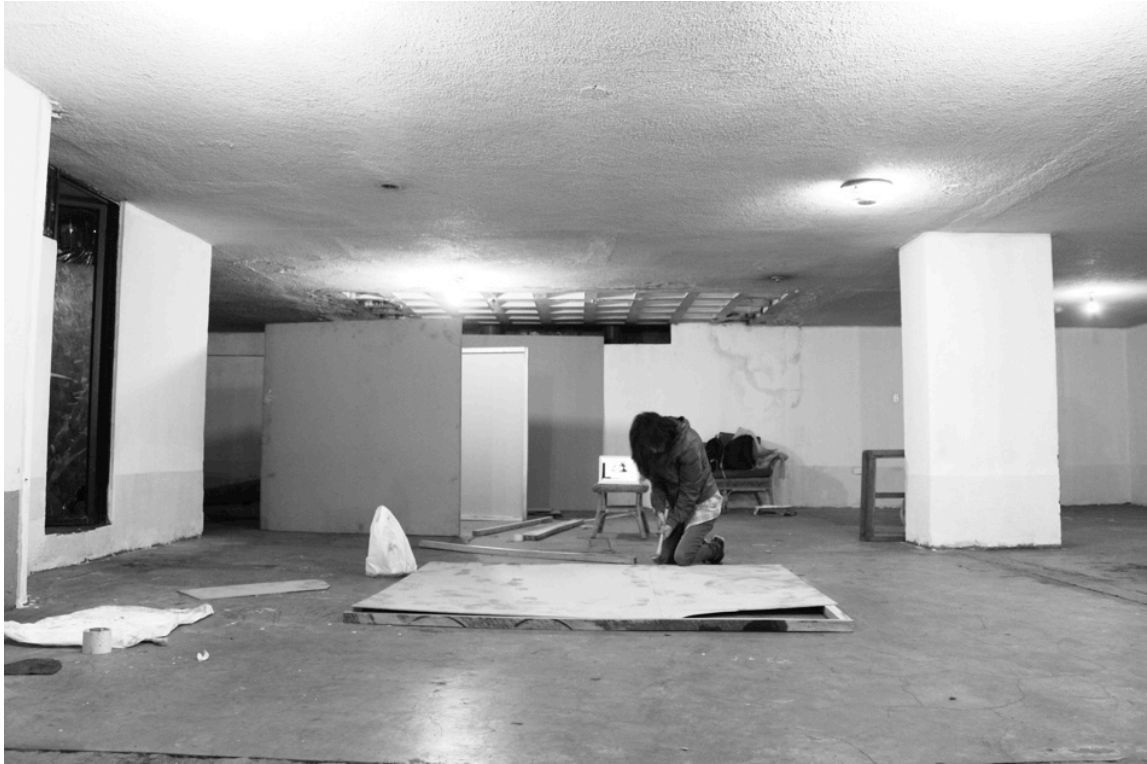
Figura 14: Registro de la construcción de la casa. Joshua Pazos, 2014.