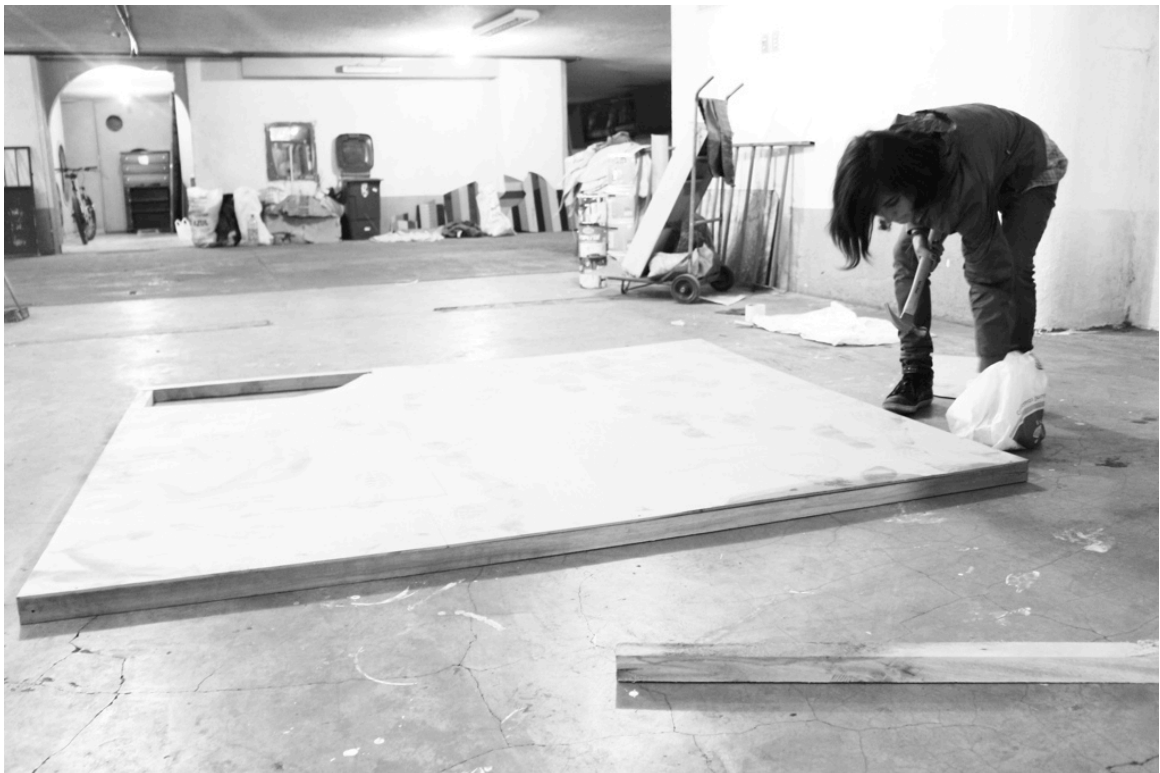
Figura 15: Registro de la construcción de la casa. Joshua Pazos, 2014.