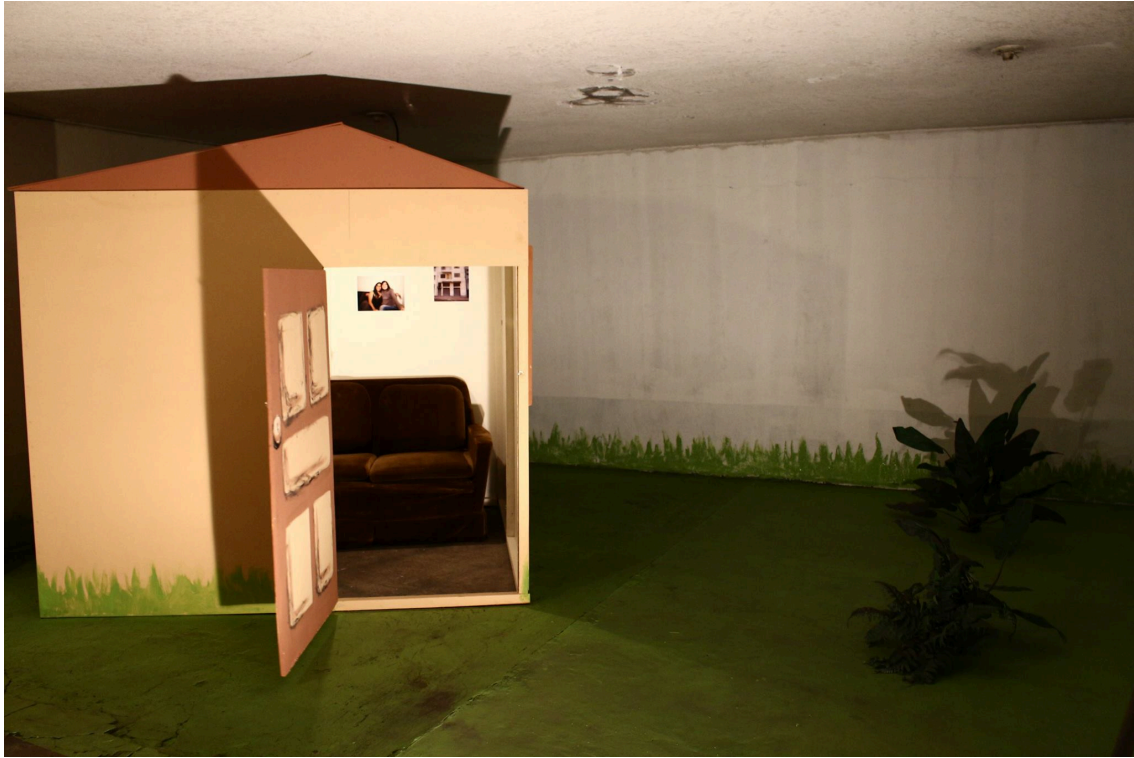
Figura 13: Registro de la casa. Álvaro Espinosa, 2014.