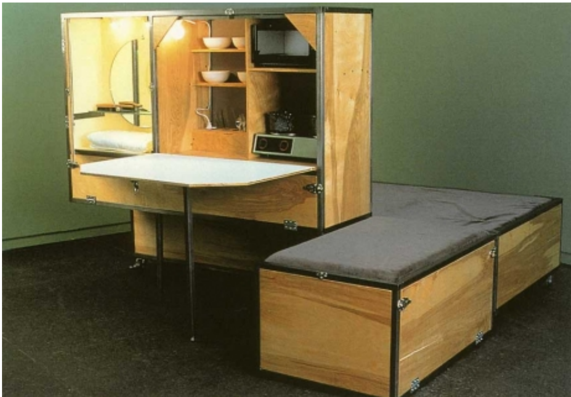
Figura 4: The Living Unit , Andrea Zittel, 1994.

Al mudarse a Nueva York y vivir en un pequeño departamento, ella empieza por construir pequeñas unidades donde tuviese lo suficiente y necesario para vivir. Así es como nace The Living Unit (1994).