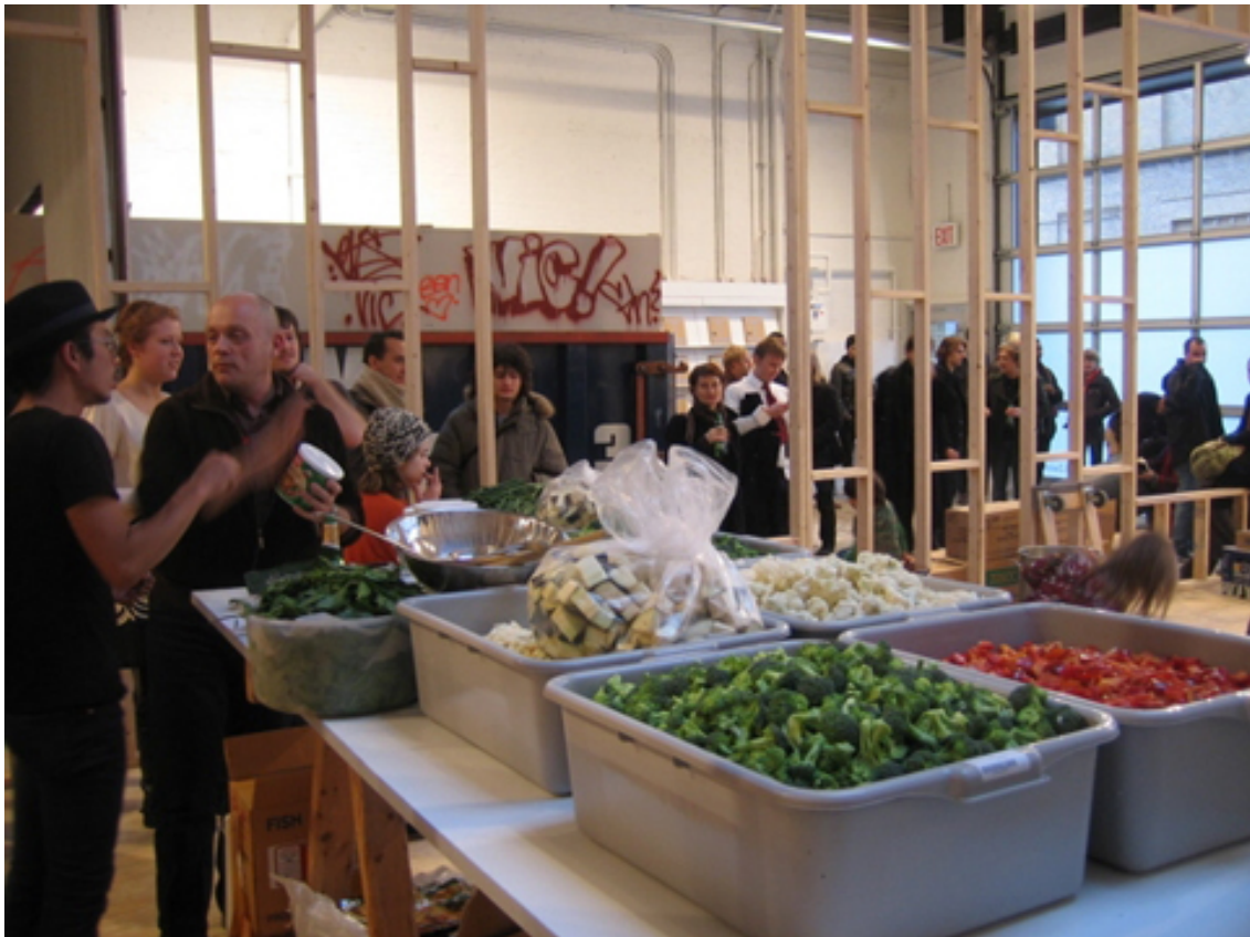
Figura 8: Free , Rirkrit Tiravanija, 1992

En la mayoría de sus obras están presentes las relaciones sociales y la importancia de la participación con el otro. Por esta razón tomo como referente a Tiravanija. La idea de crear un espacio que provoca en mí recuerdos y que en conjunto con el otro activamos ambas memorias, creamos nuevas experiencias y damos sentido a un espacio. En este momento con el espectador a pesar del distinto bagaje de recuerdos, en conjunto se crean nuevos. La noción de compartir se aplica en el sentido de las experiencias. Crear un lugar y compartirlo con los demás permite abrir un diálogo donde el otro se puede identificar en mi experiencia y viceversa: familiarizarse con cosas que deben confrontarse.