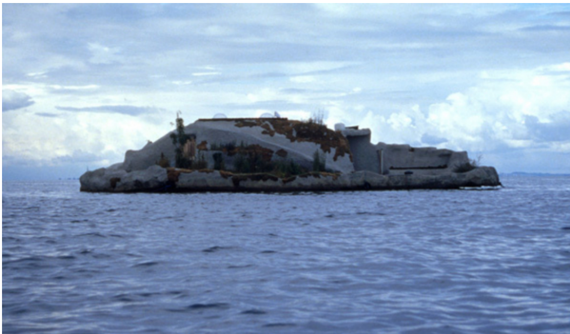
Figura 5: Pocket Property , Andrea Zittel, 1999.

Quiero detenerme en esta parte para hacer una corta observación. Zittel menciona crear situaciones controlables. Es interesante reflexionar que al construir la casa uno adquiere un poder sobre la misma. Es uno quien controla las situaciones que puedan ocurrir, uno pone orden o es permisible ante los hechos. Hago énfasis en cuanto a lo controlable, el poder que se adquiere a partir de la experiencia del habitar.