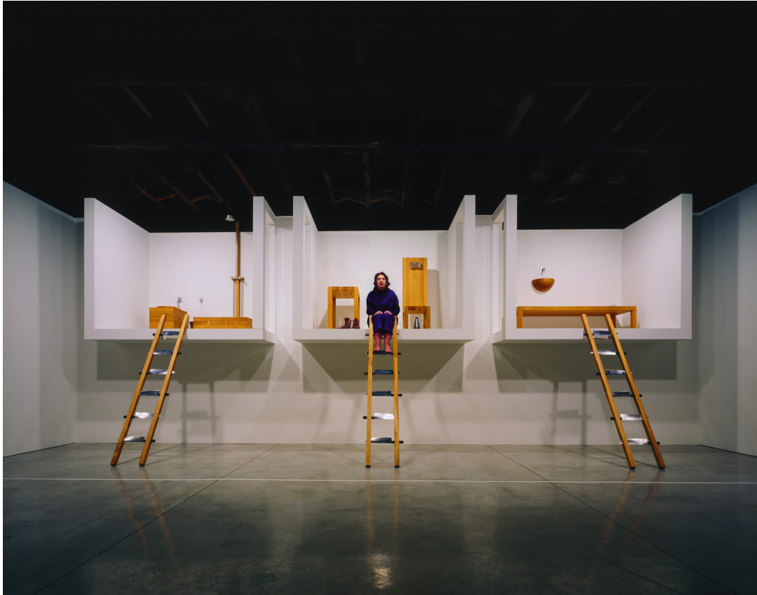
Figura 19: La casa con vistas al océano, Marina Abramovic, 2002.

en Sean Kelly Gallery en Nueva York 22 . Ella expone al espectador acciones de la vida cotidiana como sentarse, dormir y bañarse, acciones que no son ajenas para nadie. El espectador es un observador pero en mi caso quiero que el público sea parte de mi cotidianidad y que juntos activemos este lugar.