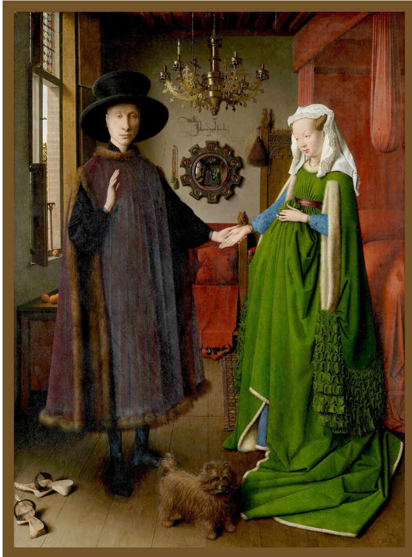
Figura 1: Matrimonio Arnolfini, Jan Van Eyck, óleo sobre tabla, 1434.