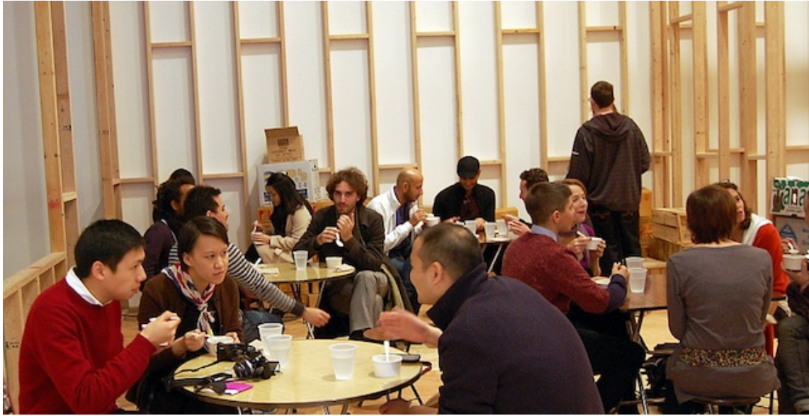
Figura 9: Free , Rirkrit Tiravanija, 1992