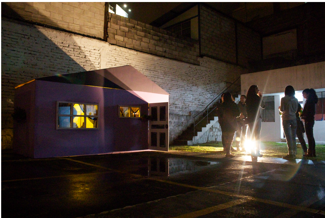
Figura 21: Registro del Huasipichay, Joshua Pazos, 2014.

parece gustarles la casa. Entran, observan las fotos, se sientan y algunos se toman fotos. La Casita invita a que la habiten. Ahora es el momento de vivir en mi Casita.