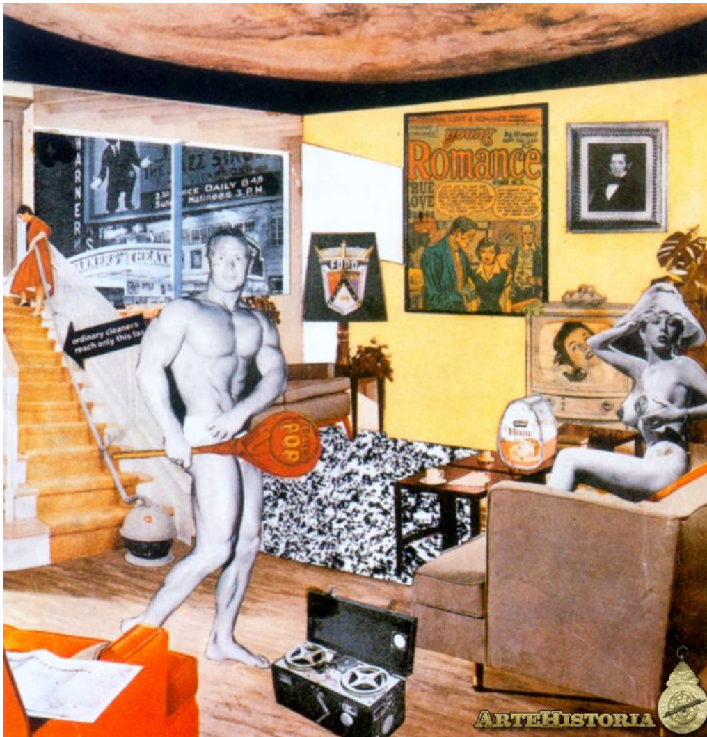
Figura 2: ¿Qué es lo que hace que los hogares de hoy sean tan diferentes y tan atractivos? , Richard Hamilton, collage sobre papel, 1956.