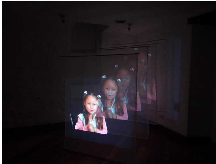
Figura 14: “Memorias Volantes”, Francy Jaramillo, Instalación de video, 0:02:41, 2017

Los niños y las niñas representan la condición humana de víctimas y victimarios frente a grandes hechos históricos: condición frágil e inocente que, con el paso del tiempo, se va haciendo más difusa. Los niños y niñas en esta obra le dan rostro a los testimonios de los protagonistas. De esta manera, los hechos relevantes de la historia de un país hacen eco en las nuevas generaciones. El resultado de lo que somos hoy contiene huellas de lo que fuimos. Las veladuras utilizadas en el montaje connotan lo difuso de la voz y la memoria con el paso del tiempo. El dar un cuerpo a esas voces, desde la práctica con los niños y niñas, al dotarles de un discurso y de una historia durante el ejercicio, hizo que cada uno de los niños y niñas asumiera una condición vengativa, de ira, de fastidio y de tristeza que aporta a la idea que guarda este proyecto: cada ser humano es capaz de ser una esponja de acciones y reacciones provocadas por el entorno.