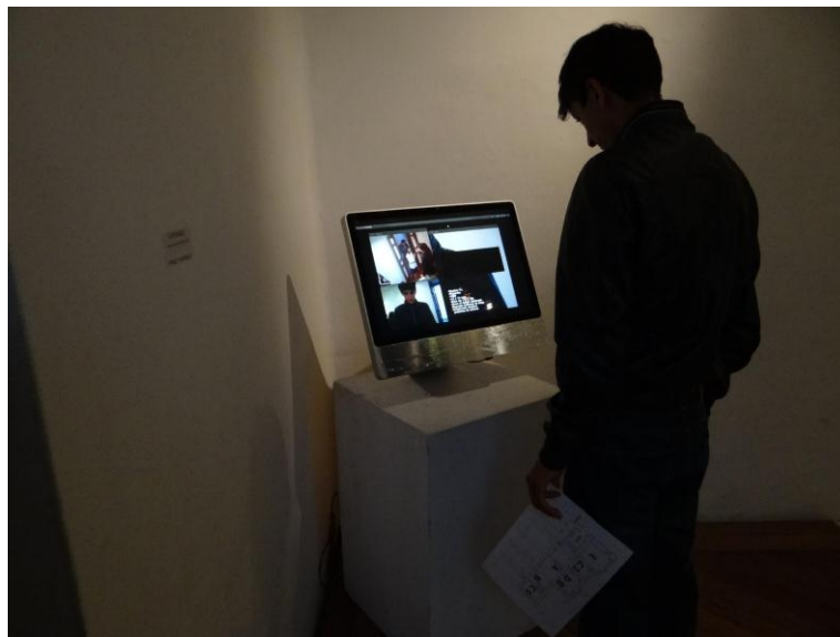
Figura 9: “Capturados”, Francy Jaramillo, Instalación interactiva, 2017

“Capturados” es una obra que interactúa con el público; fue ubicado al inicio del recorrido de la muestra, sometiendo desde el principio al espectador en un espacio vigilado,