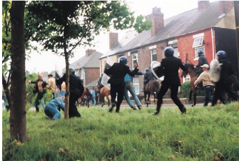
Figura 2: “LA BATALLA DE ORGREAVE”, Jeremy Deller, Video 01:00:00, 2001

dura aproximadamente una hora. En estos dos trabajos artísticos, tanto Kueva (Ecuador) como Deller (Inglaterra), evidencian la forma en que el arte funciona como plataforma de expresión a temas políticos de memoria y violencia en diferentes partes del mundo, teniendo una visión más amplia a estos procesos creativos.