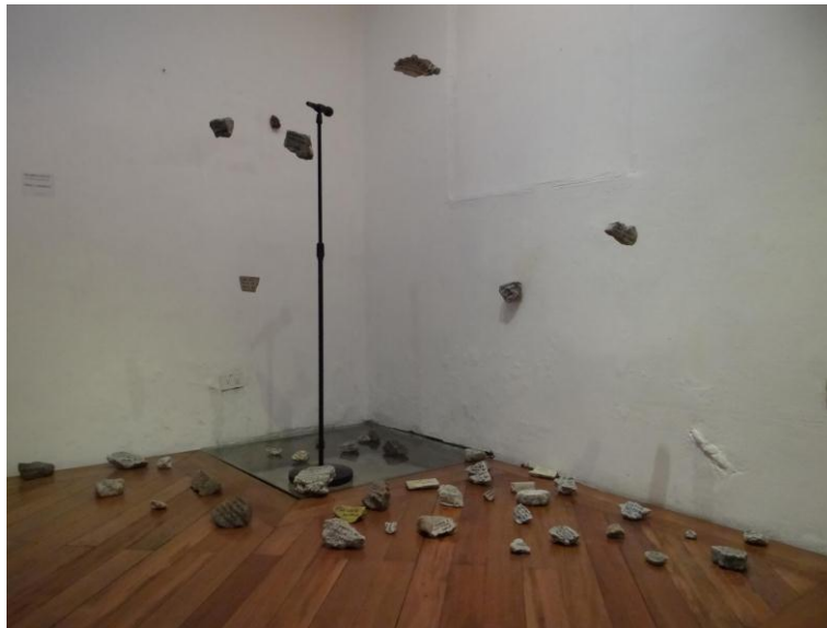
Figura 10: “Palabras Sueltas”, Francy Jaramillo, Instalación, 2017

Milgram en su publicación Los peligros de la obediencia (1974), tras su investigación y experimento sobre la maldad en los humanos, demuestra que la gente es capaz de dañar a su prójimo frente a la orden directa de una figura de autoridad, aún cuando esta persona no esté de acuerdo. Pero, ¿hasta qué punto es necesaria esa figura? ¿Podrían las personas dañar a los demás bajo la orden de esta nueva figura? “Palabras sueltas” busca identificar el detonante central a todos los acontecimientos de violencia en un entorno, en este caso, la figura de autoridad; este proyecto se apropia del discurso dado por Jaime Nebot, alto mando político en este período histórico. Se decide usar este discurso específico por ser un referente visual y sonoro de conocimiento público con el que se reconoce directamente a los Escuadrones Volantes (EV) en la web y, a su vez, es usado como apoyo visual en documentales y reportajes televisivos sobre ese período político, explicado en el capítulo anterior.