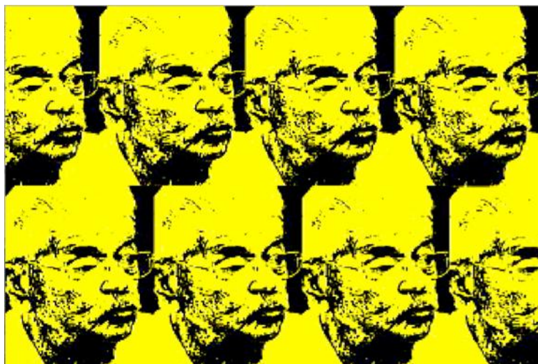
Figura 1: “MALAS PALABRAS”, Fabiano Kueva, Video 00:04:50, 2005.

Esta construcción de discursos y conceptos planteados se pueden ilustrar con el trabajo de Fabiano Kueva, artista ecuatoriano multimedios, cuya obra: Malas Palabras (2005), interpreta y encadena al espectador en una serie de imágenes y fragmentos orales, o “discursos políticos” con un montaje de imágenes envolventes de forma sarcástica y sencilla, pero con cortes en acción precisos, manipulando la imagen según la gravedad del discurso formado, valiéndose de la música para encerrar al espectador al ritmo de imágenes y sonidos que enfatizan el carácter imponente y agresivo del mandatario en el Ecuador de 1984.