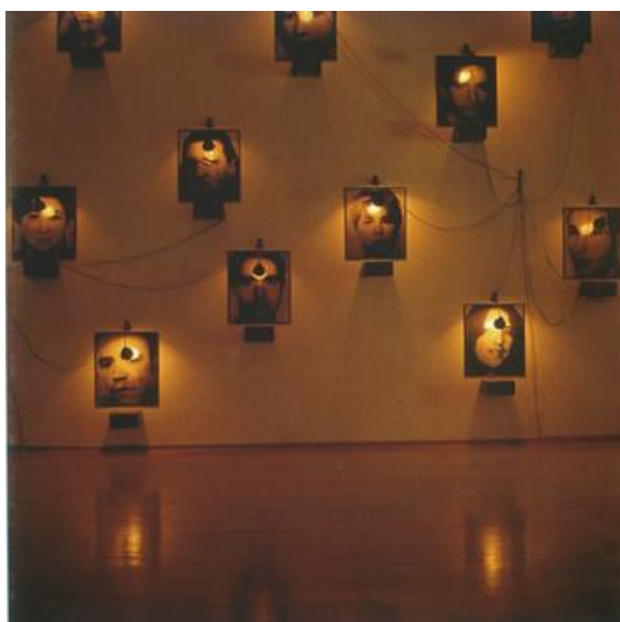
Figura 4: “El caso”, Christian Boltanski, Instalación, 1988

objetos encontrados, etc) y al hacerlos museológicos, lo que hace es rodearlos con un «aura» que transforma estos objetos en reliquias modernas.”(ibíd. p.177). Boltanski contradice los conceptos de memoria y olvido que propone Freud 14 , ya que sus obras funcionan como “(...) mecanismo de “borrado” que deja huellas en el aparato psíquico, (...) sacando contenidos que el inconsciente declaró en su momento “ilegibles” ”. (ibíd.p.176). Finalmente, Guasch propone pensar la obra de Boltanski no como una reconstrucción de un evento del pasado, sino en la “memoria” como un hecho a la vez antropológico y existencial. (ibíd.p.175)