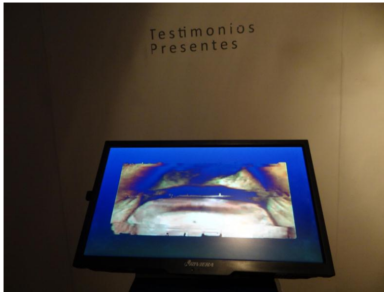
Figura 10: “Civilización”, Francy Jaramillo, Video, 0:03:55 min, 2017