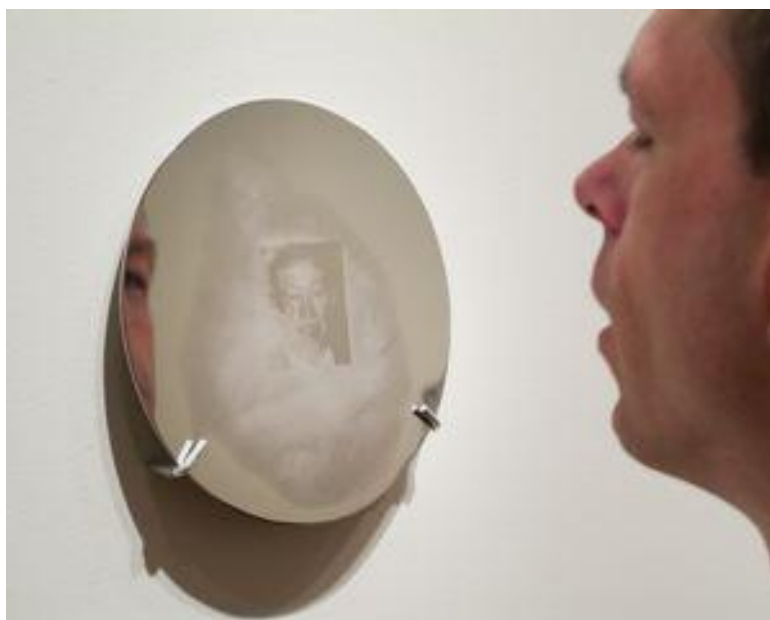
Figura 5: “ALIENTO” (BREATH), Oscar Muñoz, instalación, 1999

Dentro de esta línea de propuestas artísticas, el trabajo del artista colombiano, Oscar Muñoz, revela un interesante manejo de la imagen de archivo: descubre la tinta, el aliento, el soporte, el agua, el vídeo, la fotografía y más elementos creativos, dotando de riqueza visual y plástica a la obra. Trabajar sobre archivo y memoria para Muñoz, implica entrar en una temporalidad desde lo manual hasta la experiencia misma del ser humano: existir y morir, para lo cual es indispensable conocer no solo teoría, sino también técnicas de experimentación con el material de trabajo, en tanto habla sobre memoria, mostrando contrastes entre el tiempo y la fragilidad de la imagen: “(...)partiendo de la premisa de que(...) un documento se consolida como documento o imagen se consolida como imagen, (...) cuando se imprime en un soporte,(...) ese soporte lo uso como metáfora del recuerdo(...)”(Muñoz 15 , 2014).