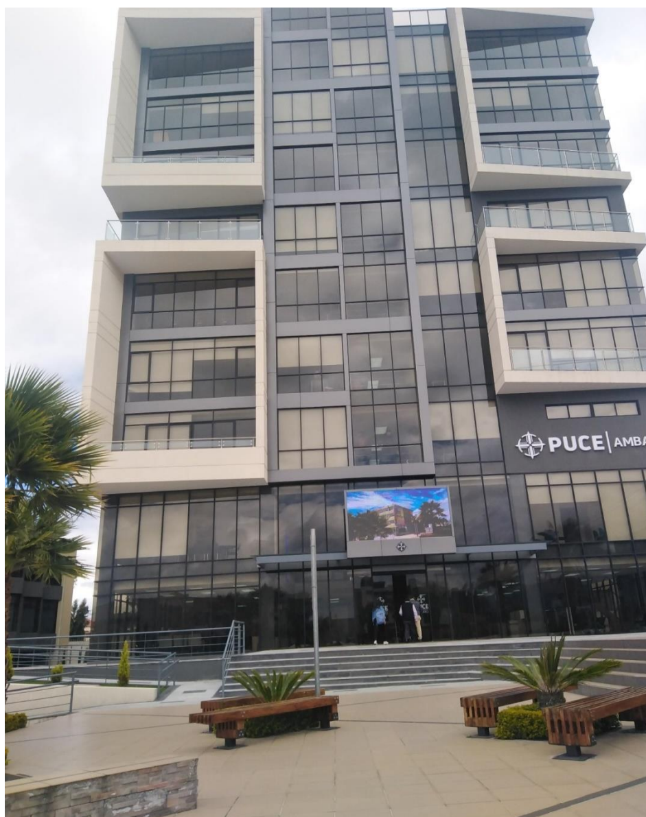
Imagen 1. Nuevo edificio de la PUCESA

proyecto inclusivo, eficiente, en diálogo con su entorno y en constante innovación académica y organizacional, sus valores guían el comportamiento de nuestra institución, los mismos que son interiorizados y vivenciados por nuestra comunidad universitaria y constan en el Estatuto de la PUCE, su ubicación en la provincia de Tungurahua cantón Ambato ciudad del mismo nombre en la avenida Manuela Sáenz y Antonio Clavijo.