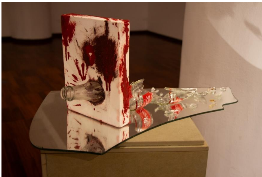
Figura 10 Fotografía de la obra Prescindir de lo útil . Tomada por Amare Jara [Escultura]. Jara, A., 2026.

como en algunas de mis obras pasadas, o abriéndome un poco más hacia un contexto general, en el caso de esta obra, abriéndome hacia Latinoamérica entera.