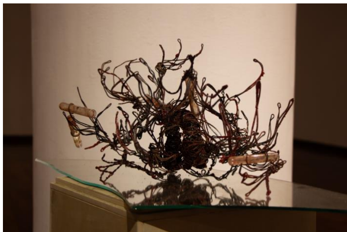
Figura 12 Fotografía de la obra Prescindir de lo útil . [Escultura]. Jara, A., 2026.

Cabe recalcar que, a mi parecer, todo lo mencionado en este subcapítulo no se comunicó de manera directa en la obra, y siento que para poder generar una conexión entre esta idea y el resultado final; podía haber utilizado un mejor título o incluir algo en la cédula que haga alusión y vincule la obra con mi investigación, como por ejemplo algo así: Sobre Meireles, la docencia y mi antigüedad .