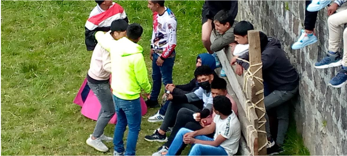
Consumo Aguardiente durante los toros populares