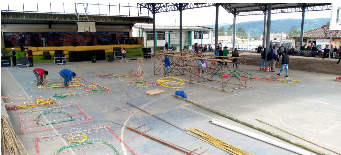
Construcción del Castillo