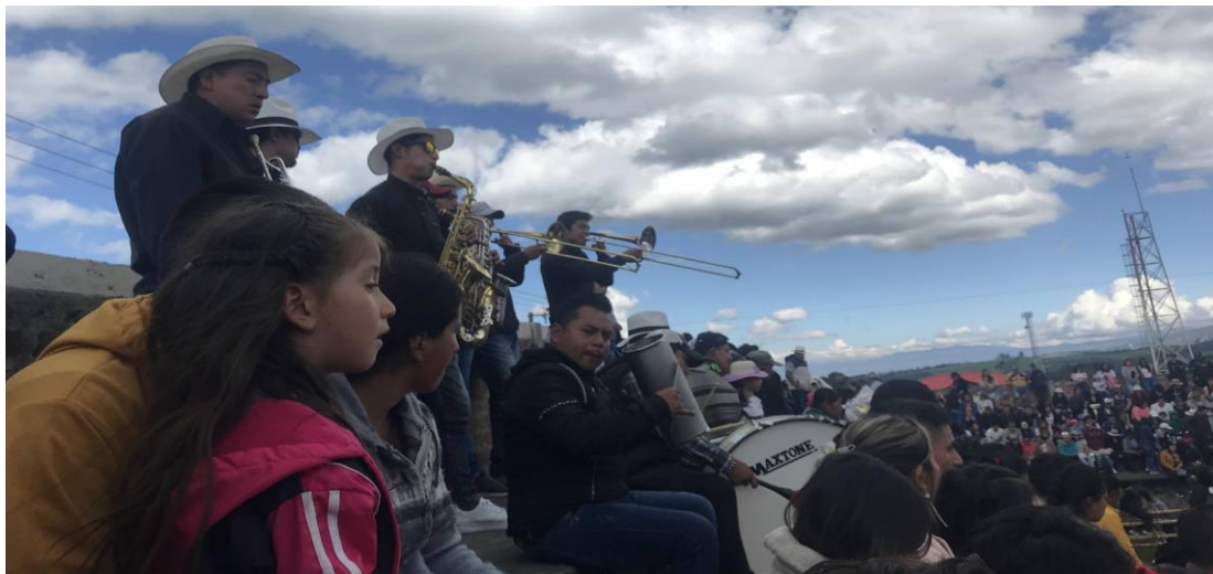
Banda de Pueblo durante los toros populares