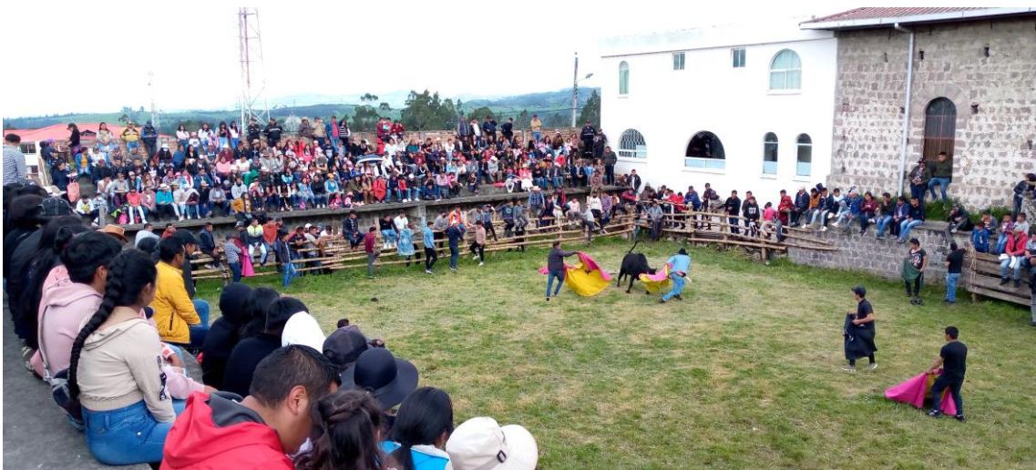
Toros Populares en Tufiño