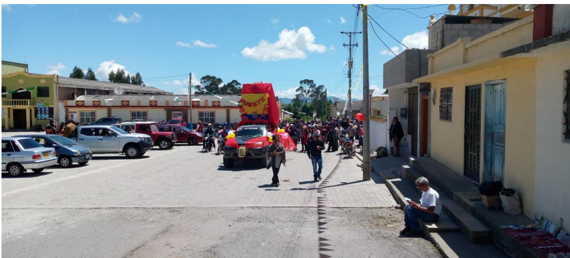
Salida de la procesión de Chiles hacia Tufiño