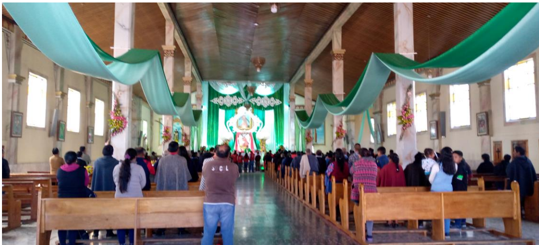
Iglesia del Señor del Río – Chiles (Colombia)