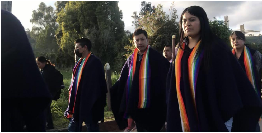
Procesión del Señor del Río