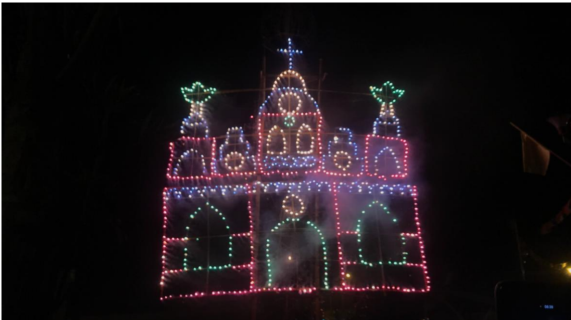
Quema del Castillo