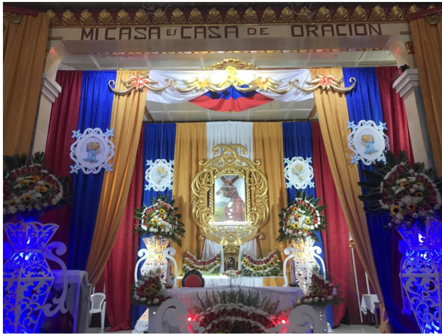
Iglesia del Señor del Río – Tufiño (Ecuador)