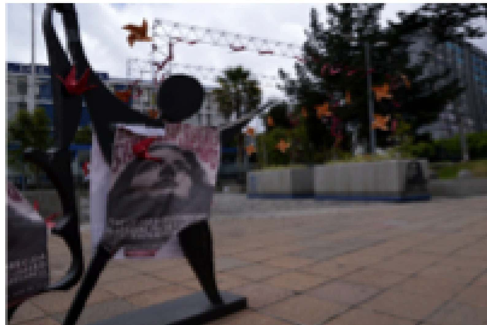
Los ojos que no ven (2019) Intervención en el espacio