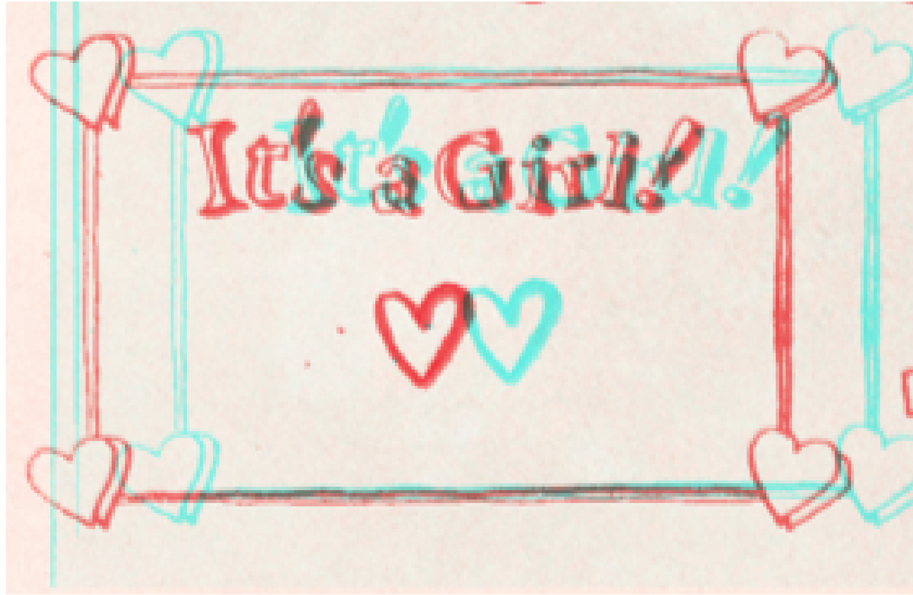
It`s a girl (2020) Ilustración