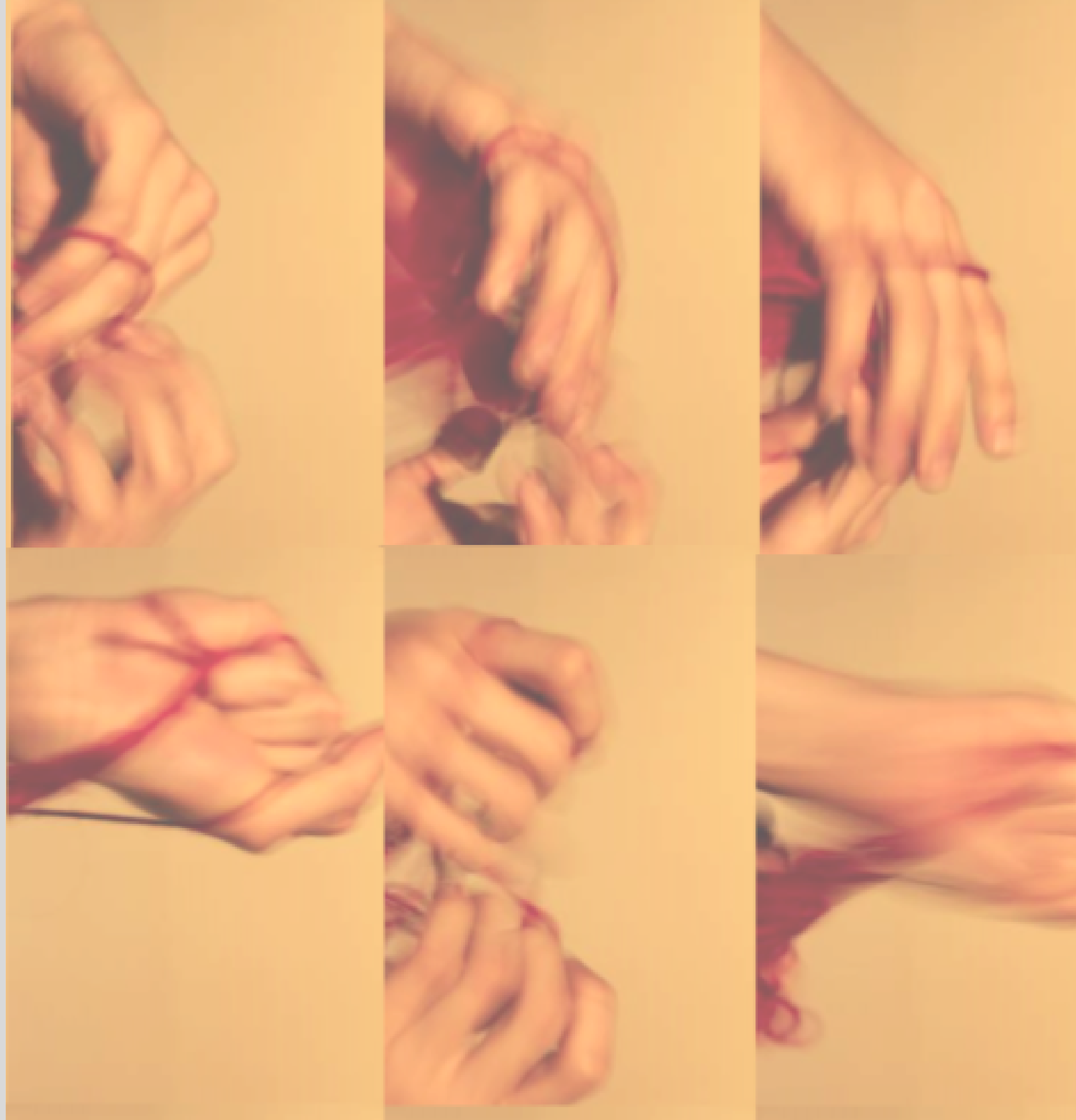
Foto secuencia de 107 fotografías basadas en la deconstrucción de la dependencia emocional y afectiva que se da en la reinterpretación occidental de la leyenda del hilo rojo. La instalación finaliza con el poema "Consejos para una mujer fuerte" de Gioconda Belli.