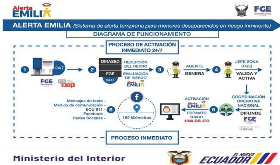
Diagrama de funcionamiento del proceso de activación inmediato 24/7.

Nota. Ilustración descriptiva sobre el proceso de activación inmediato de la alerta "Emilia". Información obtenida del Diario Digital El Telégrafo (2024).