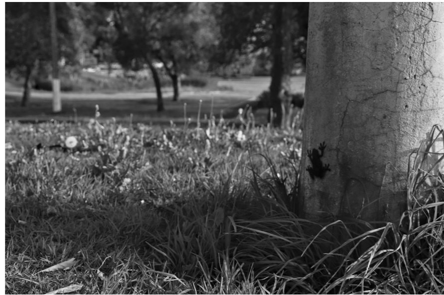
2020 Stencil (street art) Registro fotográfico Intervenciones en diferentes lugares

Esta segunda intervención juego con los significantes, las ramas de la sombra en los postes y diferentes estructuras en la ciudad no “naturales”, una imagen oscura que debería estar interceptada por alguna luz, en este caso no existe ninguna luz que proyecte esta sombra. El significado de estas sombras es la ausencia de estos anfibios que están en peligro de extinción, en una ciudad donde una rana no es tomada en cuenta, una sombra que nos recuerda una clandestinidad en silencio.