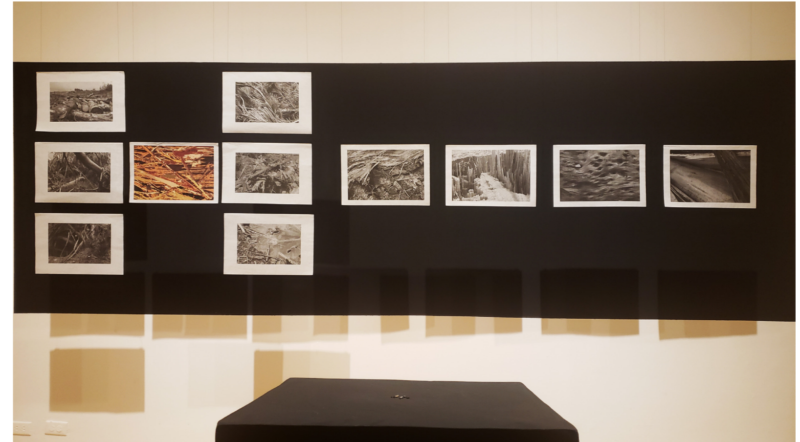
Registro de la sala de exposición