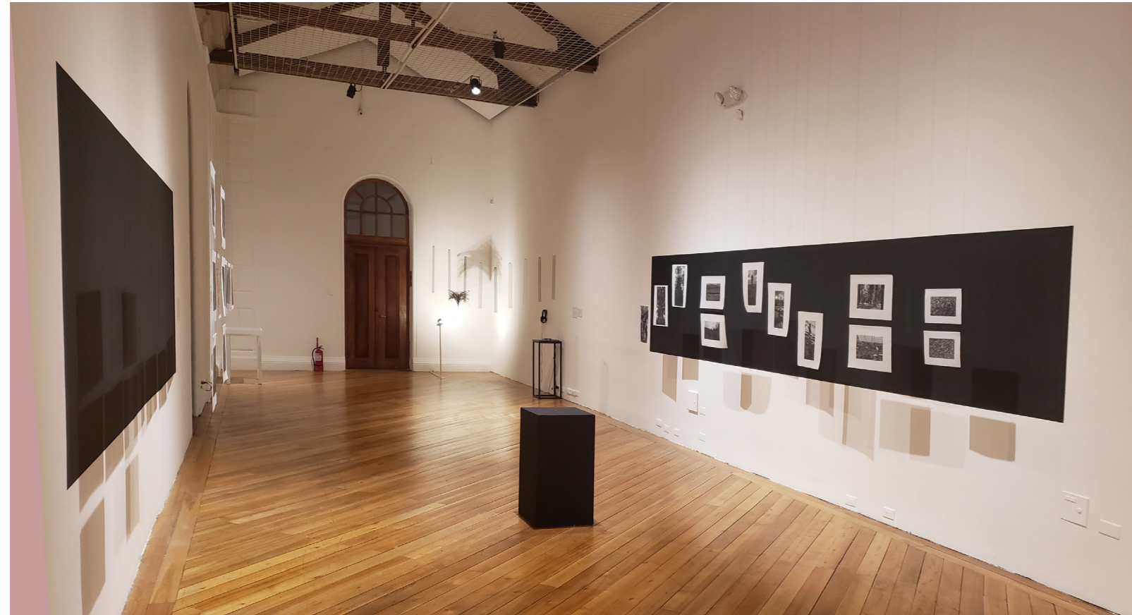
Registro de la sala de exposición