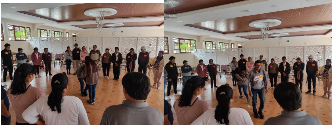
Fotografía 6. Técnica del ser sujeto social y objeto social del taller del día 25 de marzo del 2023