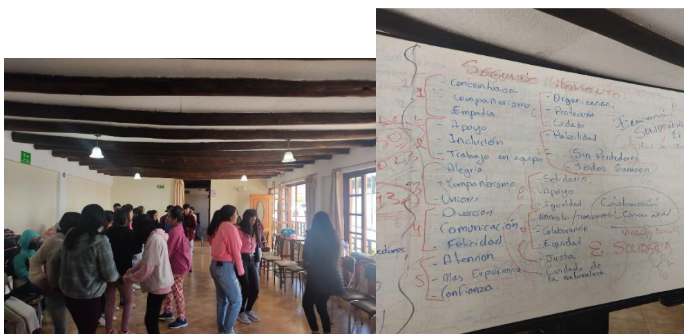
Fotografía 3. Técnica de las islas en el taller de los días 26 y 27 de agosto de 2023