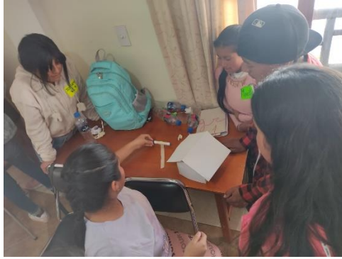
Fotografía 4. Técnica de la construcción de la casa en el taller de los días 26 y 27 de agosto del 2023