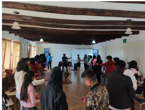
Fotografía 2. Ejercicios de respiración en el taller de los días 26 y 27 de agosto de 2023