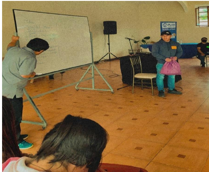
Fotografía 5. Técnica del origami del taller del día 25 de marzo del 2023