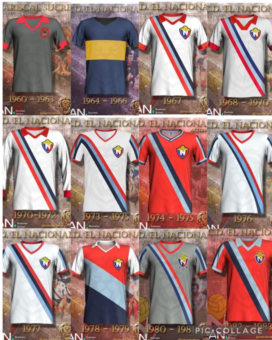
Figura 11. Diseño de camisetas del Club Deportivo El Nacional.

En la década de 1960 la primera casaca del Club Deportivo El Nacional, en ese entonces denominado Mariscal Sucre, tenía una combinación de colores que establecía una conexión con la identidad del club y su relación con las fuerzas armadas. Debido que el equipo de esa época estaba conformado por los seleccionados de fútbol del ejército ecuatoriano que disputaban los torneos de segunda categoría de la provincia de Pichincha. Por esta razón lleva la camiseta lleva el escudo del ejército.