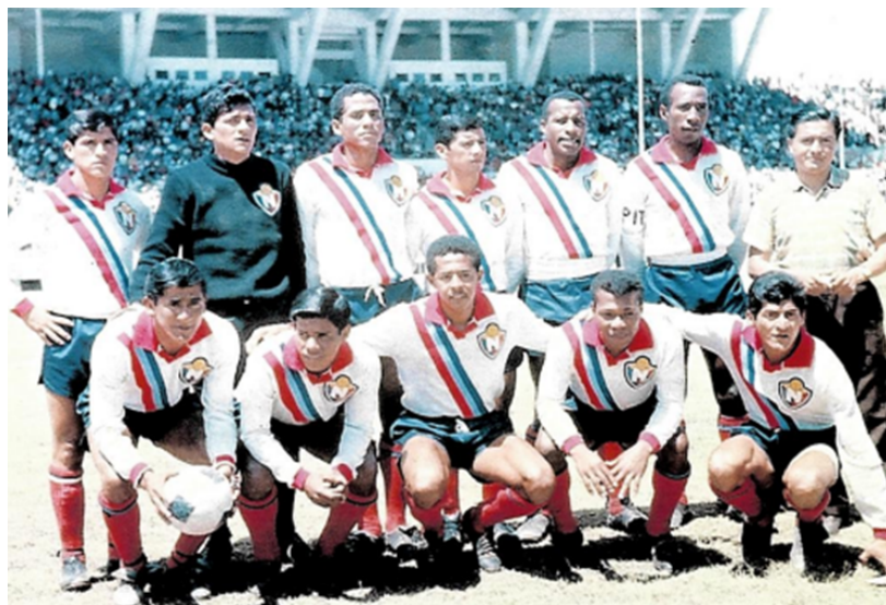
Figura 2. El Nacional 1967 .

El Nacional con una participación de 12 victorias en condición de local y un empate, se consagraron campeones del torneo. Por esta razón, los hinchas comienzan a nombrar al equipo con el distintivo de “Maquina Gris” según Chela (2019) debido al color de su uniforme y forma de juego que demostraba en las canchas.