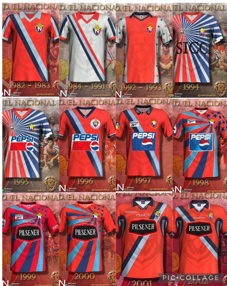
Figura 12. Camisetas del Club Deportivo El Nacional 1982-2002.

En los años 70 y 80, el equipo mantuvo el color gris como predominante en la camiseta, aunque se introdujeron algunas variaciones. Por ejemplo, se utilizó una camiseta a rayas horizontales rojas y blancas, lo cual agregaba un elemento visual distintivo al uniforme. En ocasiones, también se empleó un uniforme completamente rojo, reforzando aún más la asociación del equipo con este color.