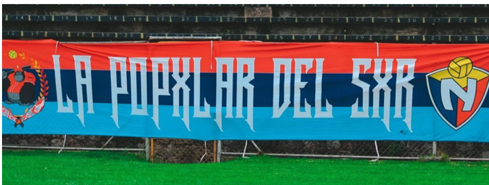
Figura 15. Bandera del Sur .