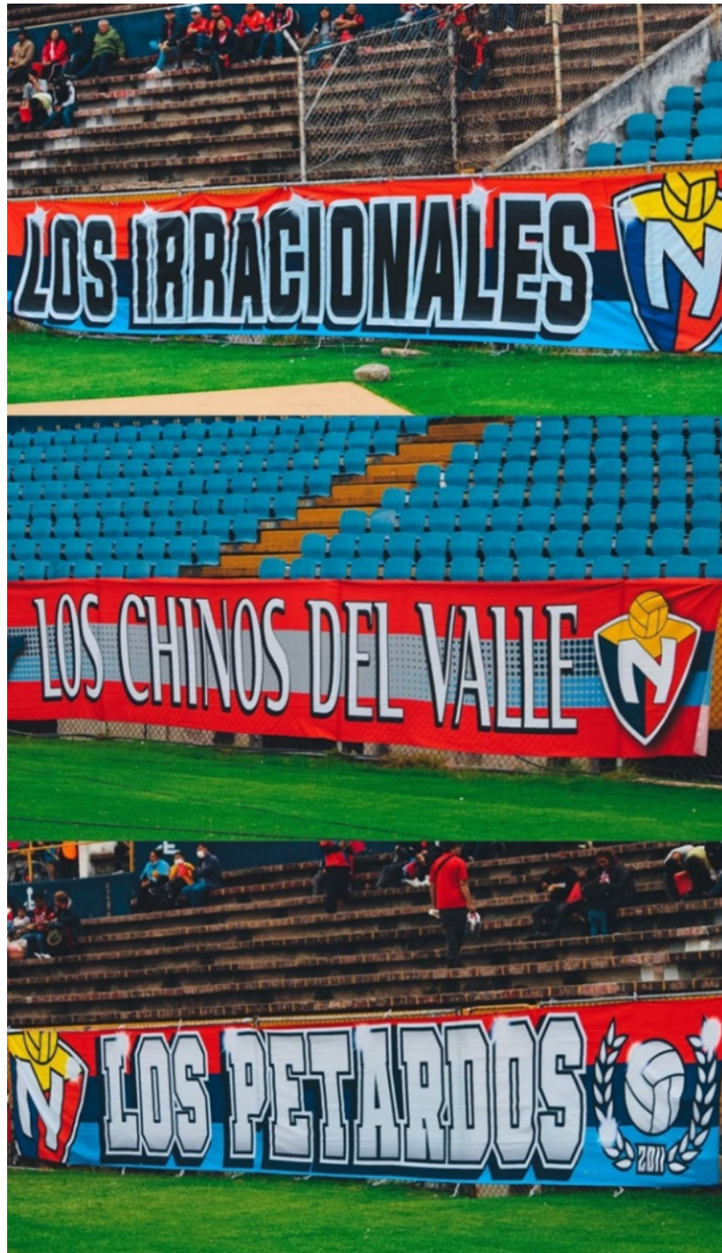
Figura 19. Trapos de la Barra Marea Roja .