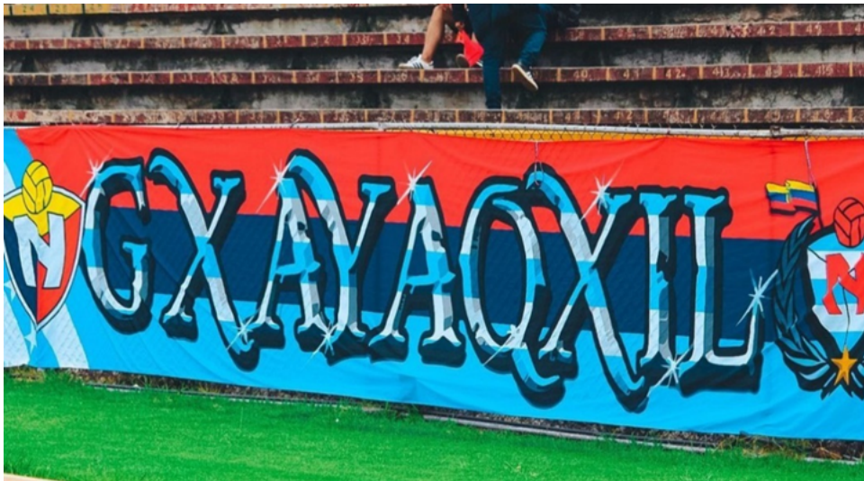
Figura 14. Bandera de Guayaquil.