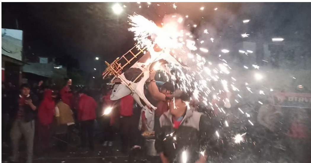
Figura 25. Festejo con la Vaca Loca.

La "Vaca Loca" constituye un evento arraigado en la tradición de festividades populares y celebraciones comunitarias. Se realiza como un símbolo de alegría, ya sea en conmemoración de fechas o eventos relevantes. Su ejecución durante el encuentro futbolístico representa una manifestación de identidad y cohesión grupal, reforzando los lazos emocionales entre los miembros de la barra brava.