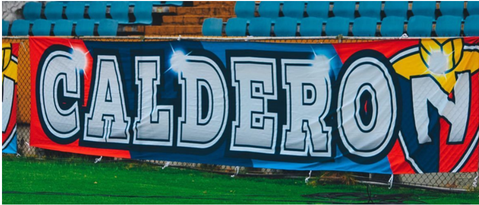
Figura 16. Bandera del barrio de Calderón .