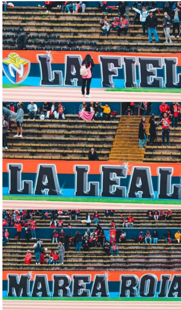
Figura 18. Bandera Principal de la Marea Roja .