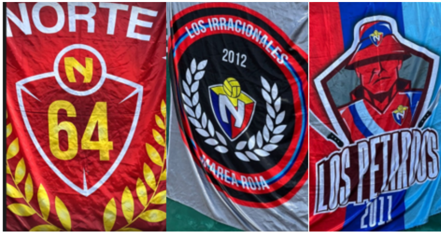
Figura 17. Adaptaciones del escudo .