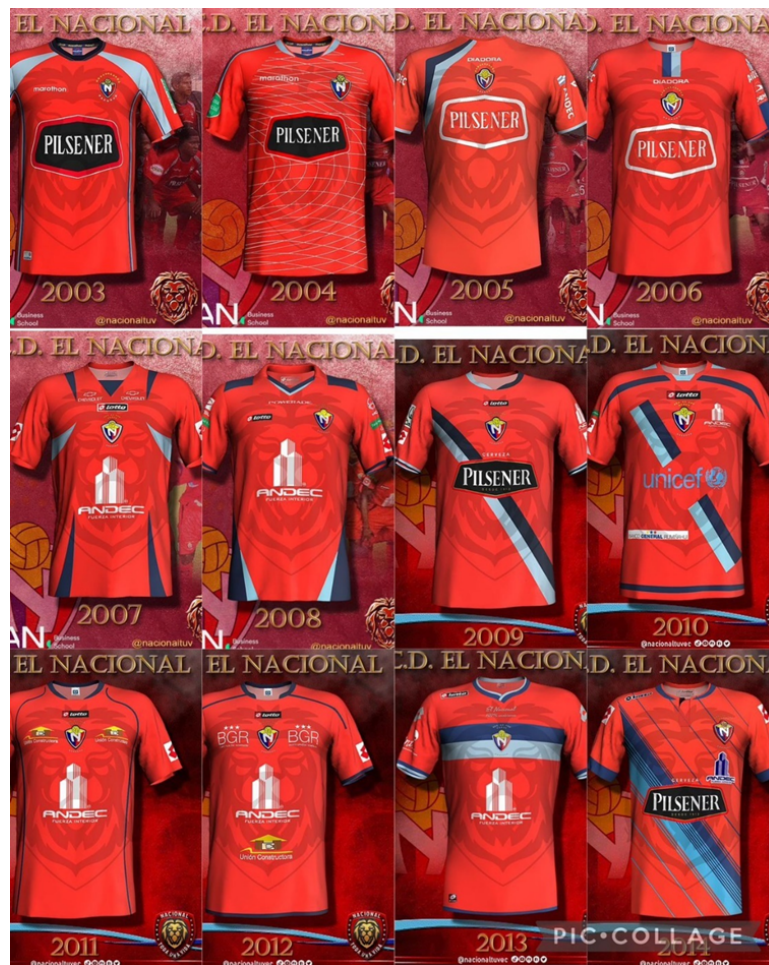
Figura 13. Último diseños.

Durante los períodos de los años 90 y 2000, el uniforme principal del club consistió en una camiseta roja con vivos y pantalón blancos. Esta combinación de colores reflejaba un estilo clásico y elegante. A veces, se utilizaron detalles adicionales en negro o dorado, añadiendo un toque de sofisticación al uniforme. El uniforme de visitante varió entre camisetas y pantalones blancos o negros, con vivos rojos, manteniendo la presencia del color rojo como un elemento distintivo en ambas equipaciones.