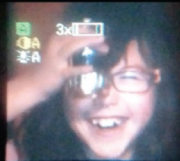
Fotogramas de Oceano JVC - Santiago Quevedo B.