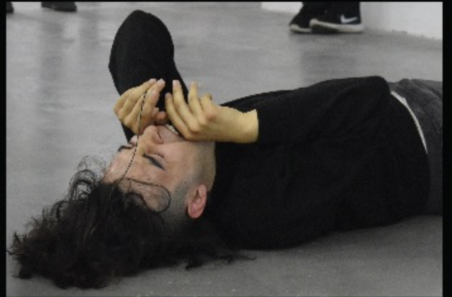
Fotografías por Paula Hinojosa "Hálito trunco" - Santiago Quevedo B.