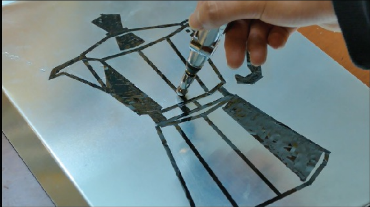
Imagen referencial de cotidiano y registro de pruebas de interacción de usuario con la obra - Santiago Quevedo B.