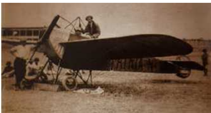
Imagen 2 6

Teniente Cosme Renella a bordo de un avión de la Aviación Italiana durante la I Guerra Mundial.