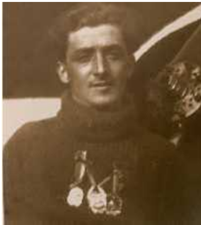
Imagen 5 11

Esta histórica comunicación fue la llama que prendió el entusiasmo del Presidente electo, Dr. José Luis Tamayo, para obtener del Congreso Nacional el histórico Decreto del 27 de octubre de 1920, para el establecimiento de la primera escuela de aviación en el Ecuador. ( Fuerza Aérea Ecuatoriana , 1999, p.23)