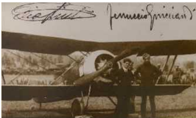
Imagen 6 12

Fotografía de Elia Liut y Ferruccio Guicciardi frente al Telégrafo I en Cuenca, la misma se encuentra firmada por los aviadores.