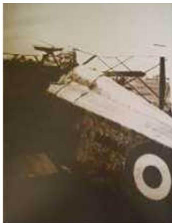
Imagen 1 5

Teniente Cosme Renella a bordo de un avión de la Aviación Italiana durante la I Guerra Mundial.