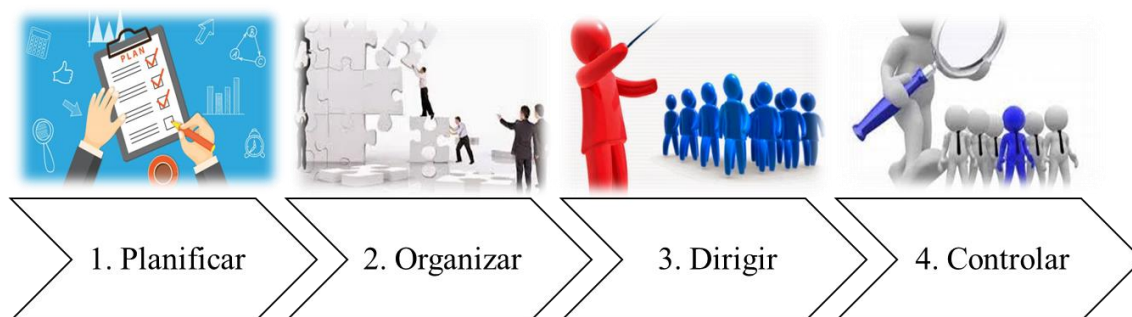
Ilustración 2 Componentes de la gestión administrativa

Los dueños de las PYMES deberían dominar los instrumentos o herramientas necesarias para llevar una mejor administración teniendo mayor efectividad en sus procesos y de esta manera generar menos gastos, procesos eficientes, un personal capacitado y mayor productividad. Además, las PYMES están posicionándose en el mercado local siendo fuentes de empleos a los ciudadanos, generando el desarrollo económico local como el de los habitantes y con ello ayudar a dinamizar la economía. Cabe resaltar que las PYMES deben de estar en constante mejora para permanecer en el mercado y así hacerles frente a las otras pymes que están en innovación ya que esta le permite captar más clientes, y así elevar las ventas convirtiendo esto en una oportunidad de desarrollo local.