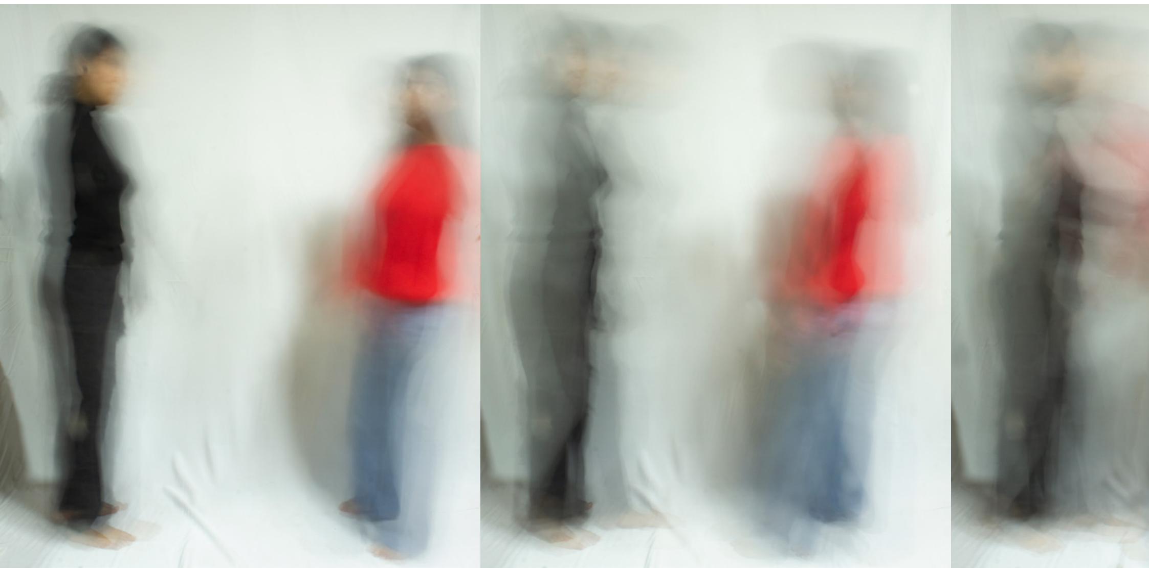
Movimiento incontenible, detalle de fotografías. 2022