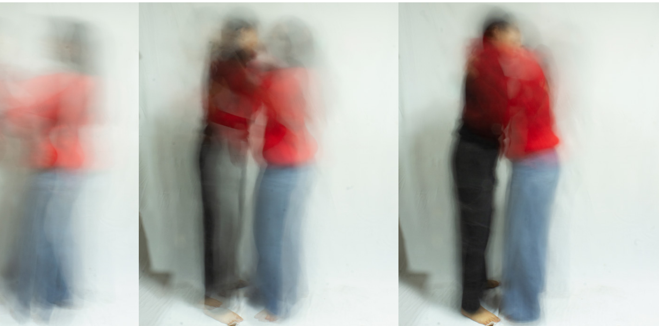
Movimiento incontenible, detalle de fotografías. 2022