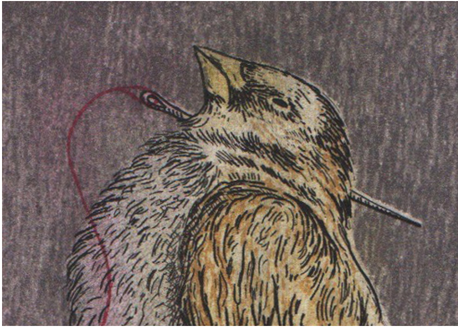
Aguja e hilo 1/7 Detalles 2022