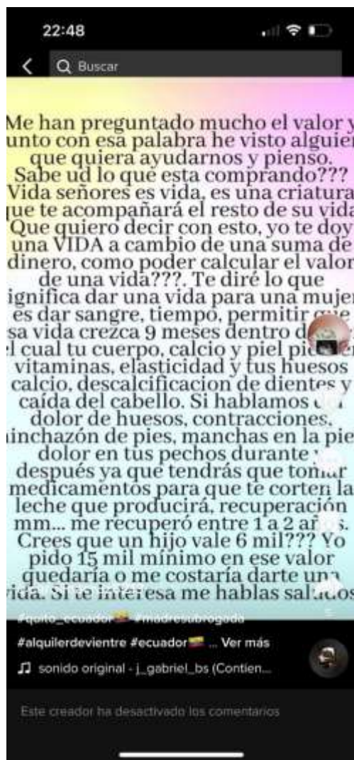
Ilustración 2

Con este caso antes mencionado podemos evidenciar que en el Ecuador existe un mercado negro de vientres de alquiler, el cual muy notoriamente no se encuentra regulado o normado, de tal forma que puede inferir en la vulneración de derechos de cualquiera de las partes involucradas en el proceso.