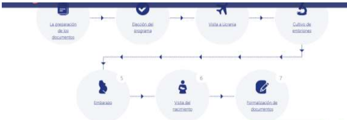
Ilustración 1

En igual sentido se presenta una gráfica propuesta por Ucrania, estos son los pasos por seguir para la maternidad subrogada propuesta por una página web https://vittoriavita.com/spa/maternidad-subrogada-en-ucrania/ , en donde los padres contratantes accederían a investigar información respecto a esta práctica.