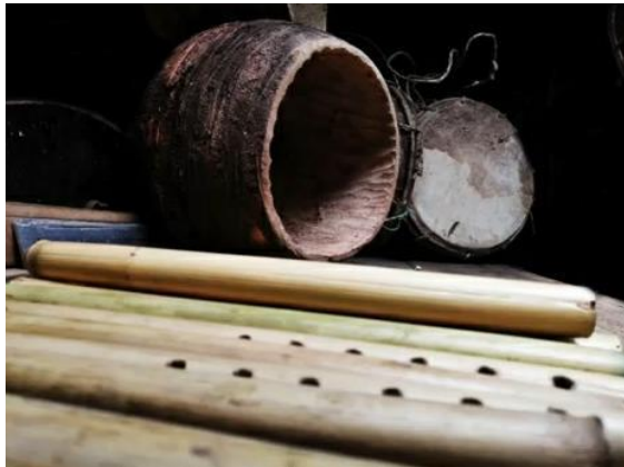
Figura 1. Bombos y flautas

inmemorables. Conlleva una herencia de sus antepasados constructores de las pirámides y portadores del patrimonio cultural material e inmaterial de la comunidad (Núcleo de Pichincha, 2021).