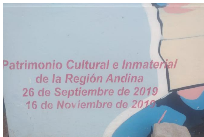
Figura 2. Declaratoria de Patrimonio Cultural e inmaterial

Surgen diversas apreciaciones a partir de la no preservación de este patrimonio inmaterial como es el caso de la fabricación de los instrumentos, el impacto que sería de la implementación de nuevos instrumentos y el sonido cambie o a su vez que este legado se pierda por el escaso interés de los jóvenes por aprender. Por tal motivo, con la elaboración de este producto final artístico; que es el video documental con carácter educativo e informativo de la música tradicional de este sector como fuente de conocimientos ancestrales, se pretende que la idea preservación de esta manifestación cultural promueva por un lado el conocimiento de los habitantes del entorno, así como de los que se encuentran directamente involucrados en la obligación de preservar este legado cultural. A la par de esto, es importante que exista una difusión adecuada de este producto con el fin de preservar y dar reconocimiento de este legado cultural. También, transmitir un sentido de conciencia de cuán fundamental es mantener nuestras manifestaciones culturales vivas, y, sobre todo, trasmitirlas a las generaciones venideras (Núcleo de Pichincha, 2021).