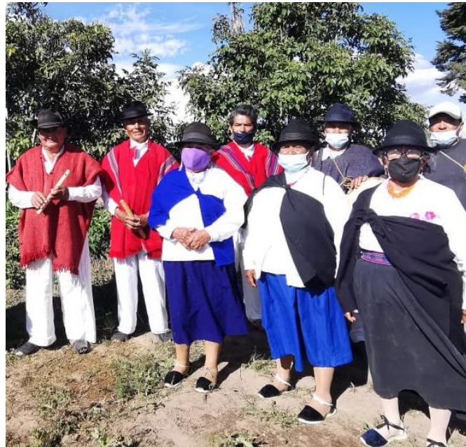
Figura 11. Vestimenta autóctona de Cochasquí

La vestimenta tanto de los hombres como las mujeres han adoptado de sus antepasados, por ejemplo, las mujeres su vestimenta tradicional es su centro azul, blusa blanca, el mantelillo, alpargatas y sombrero.