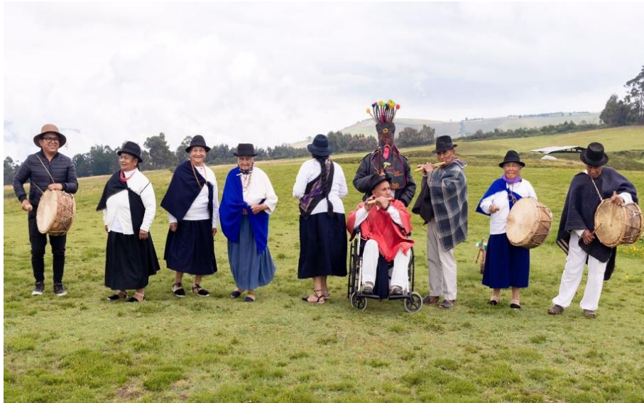
Figura 10. Danza

Dando lugar a un estilo de música tradicional que trasmite lo aprendido de generación en generación. Estos personajes integran una misma familia que tocan los tambores, cajas, flautas y danzantes. Logrando ser reconocido como Patrimonio Cultural Inmaterial de Cochasquí del Ecuador, debido a la gran importancia que genera la entonación de diferentes melodías antiguas (Andino, 2019).