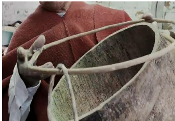
Figura 5. Proceso de Armado del bombo