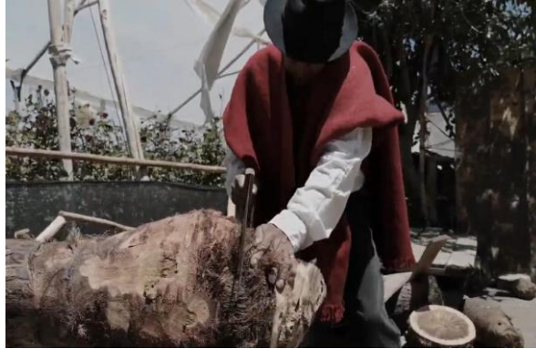
Figura 4. Proceso de obtención de la materia prima