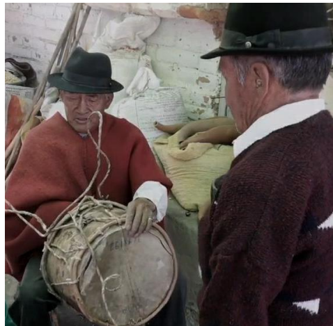
Figura 3. Fabricación del bombo

El bombo se elabora en base a una planta conocida como penco o cabuyo que es característica de la zona y de la cual se obtienen muchos productos como el mishqui que es la sabía que sale del tronco, también se obtienen otros productos por ejemplo de su raíz se obtiene el shampoo, de las hojas la fibra y de su tronco seco se obtiene la base para la elaboración de instrumentos musicales (Novillo, 2016).