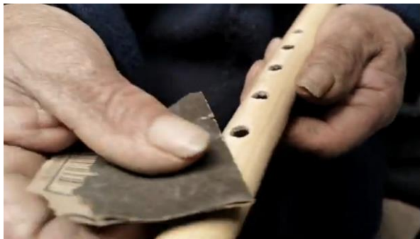
Figura 7. Elaboración de la flauta

Para la elaboración de la flauta el carrizo debe ser grueso, posterior se procede a vaciar y lijar el carrizo. Los orificios de la flauta están acorde a la separación de los dedos de la mano la cual se toma como referencia para fijar los siete orificios de la flauta.