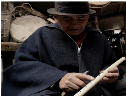
Figura 8. Acabados de la Flauta