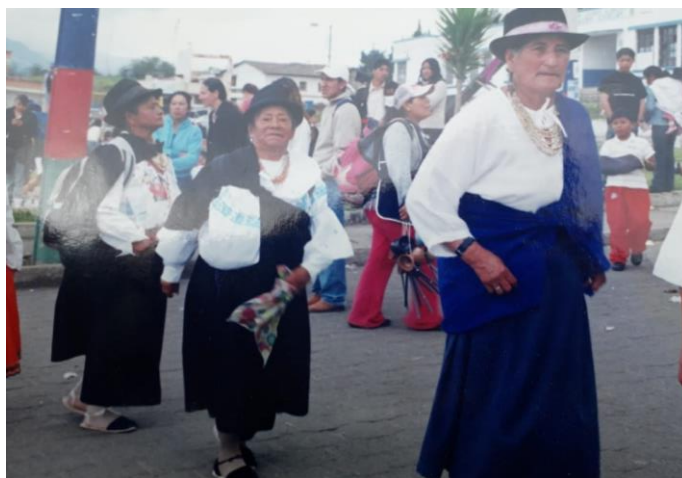
Figura 9. Presentación del grupo de Danza en las festividades