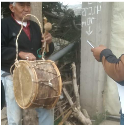
Figura 6. Caja

Una vez conseguidos los materiales, se procede a vaciar completamente el tronco del penco hasta dejarlos fino, después se procede a cortar el cuero alrededor de la boca del tronco del penco y seguir cosiendo en sig sag y ajustando, el chichavo o planta que sus ramas sirven para ajustar el contorno del bombo se pone en el fuego para irle moldeando.