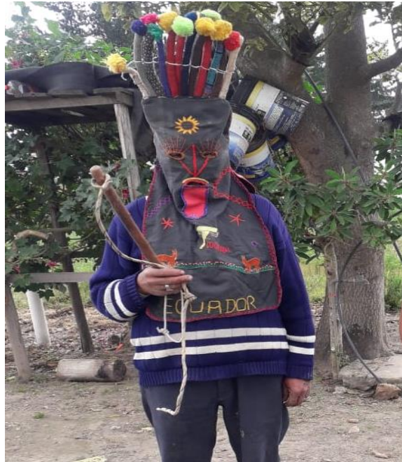
Figura 12. Diablo Huma