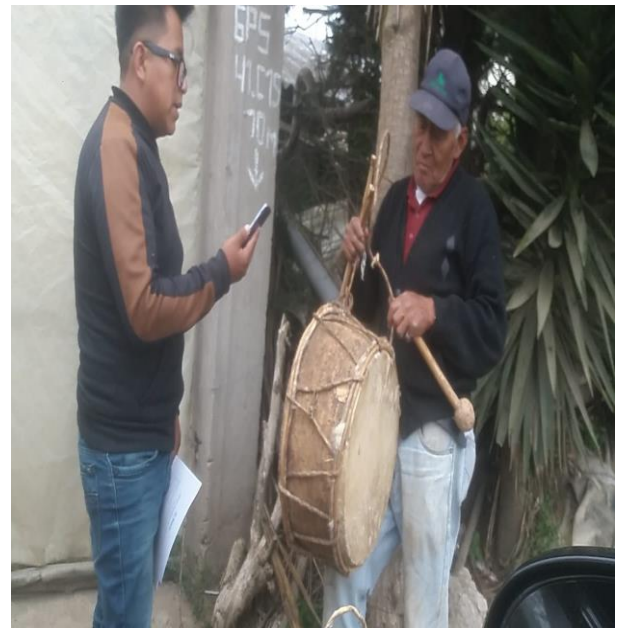
Anexo 4 Producción del Video documental