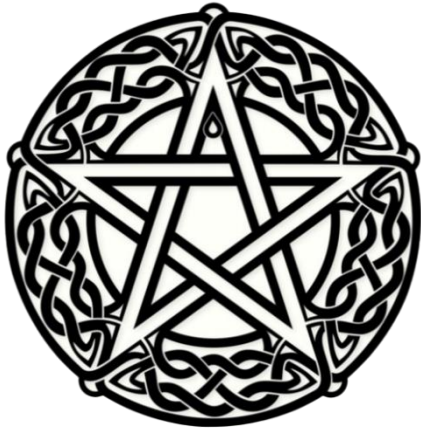
Figura 3. Pentáculo Wicca

Es una estrella de cinco puntas rodeadas por un círculo, representa los cinco elementos de la naturaleza: Tierra, Fuego, Agua, Aire y Éter, siendo este último el espíritu y la mente, se ubica en la punta de la estrella porque en el Éter reside el sentido y orientación para llevar a cabo los rituales mágicos (Cunningham, 2001). El círculo que lo rodea es el espacio sagrado desde donde el espíritu trabaja con los cuatro elementos. Es símbolo de tierra y abundancia.