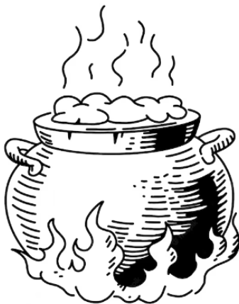
Figura 4. Caldero de bruja

El caldero simboliza a la Diosa, es considerado como la matriz de los rituales Wicca, en el ocurren