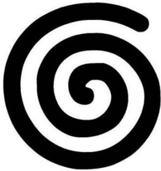
Figura 2. Espiral celta

La espiral es un símbolo celta, su significado se le atribuye a la vida eterna. Representando la transformación de la naturaleza, la evolución de la energía y símbolo de nuevo comienzo es un símbolo de importa en la festividad de Yule.