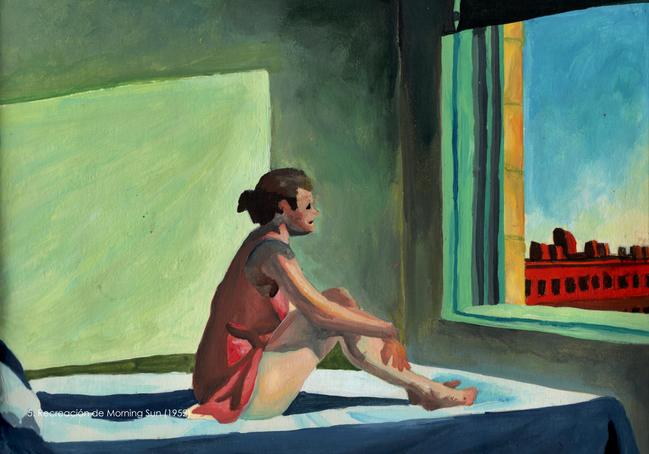
5. Recreación de Morning Sun (1952)