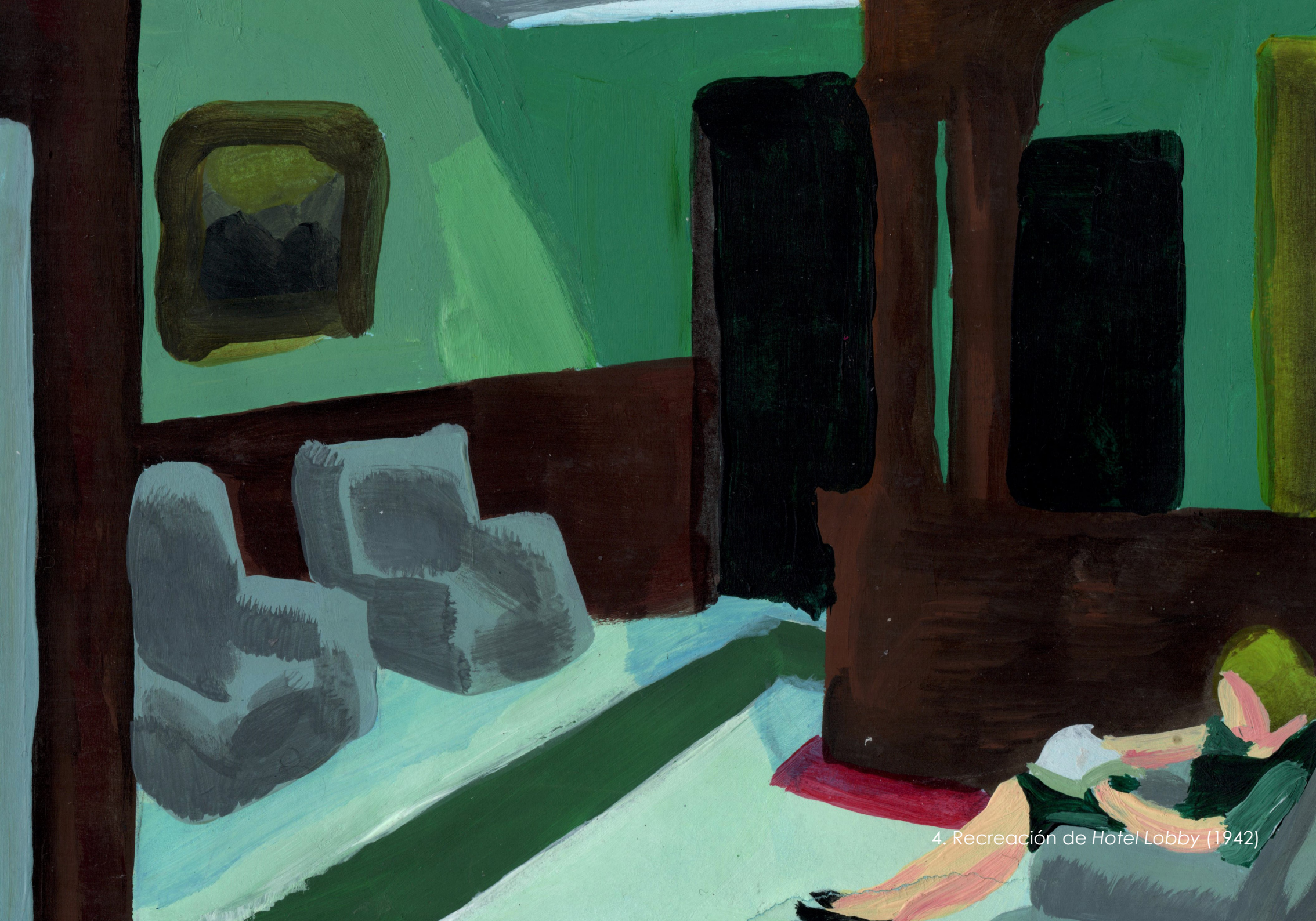
4. Recreación de Hotel Lobby (1942)