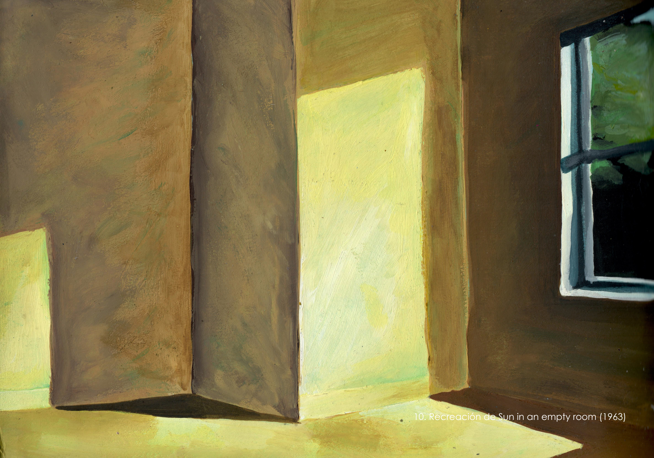
10. Recreación de Sun in an empty room (1963)