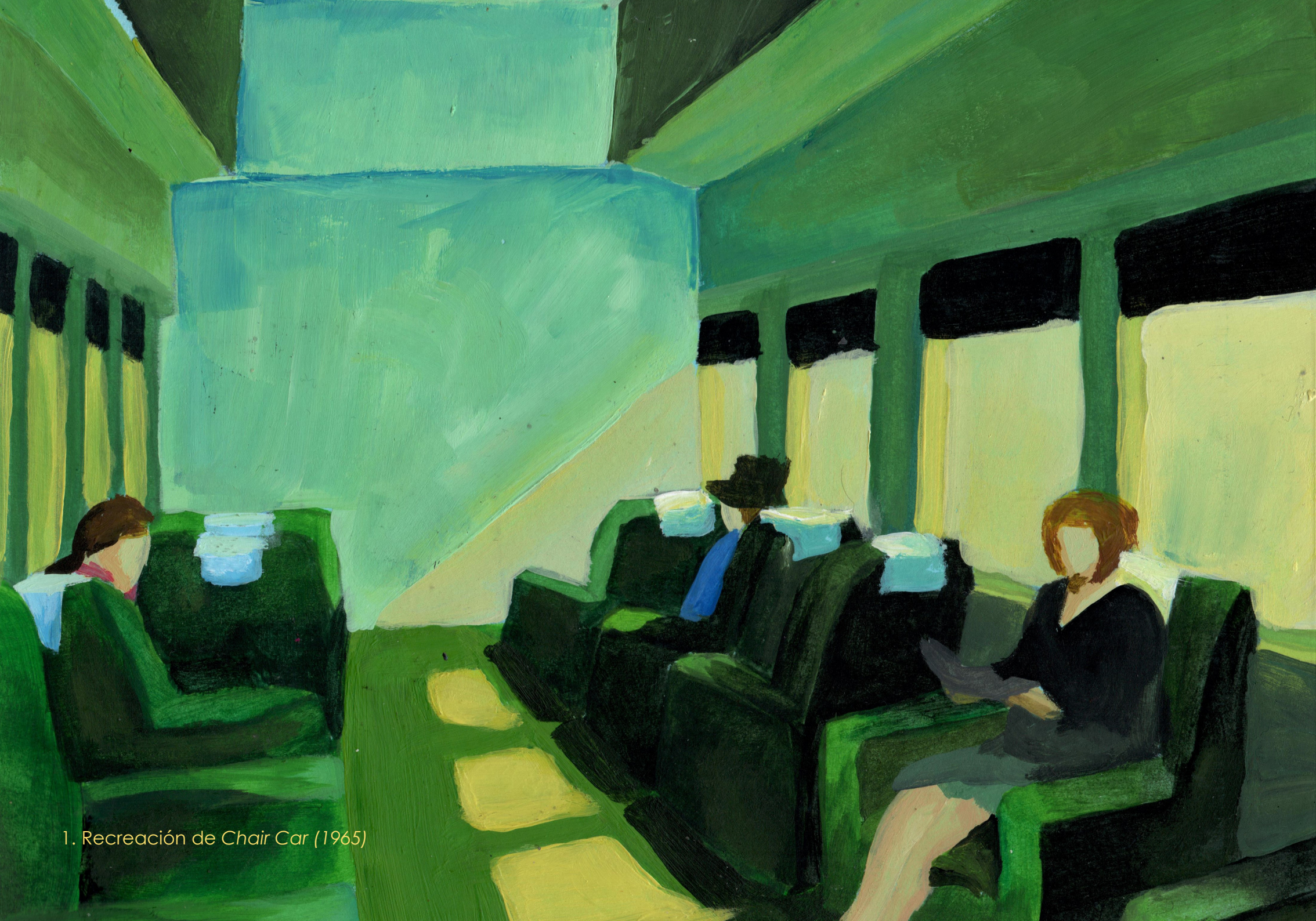
1. Recreación de Chair Car (1965)