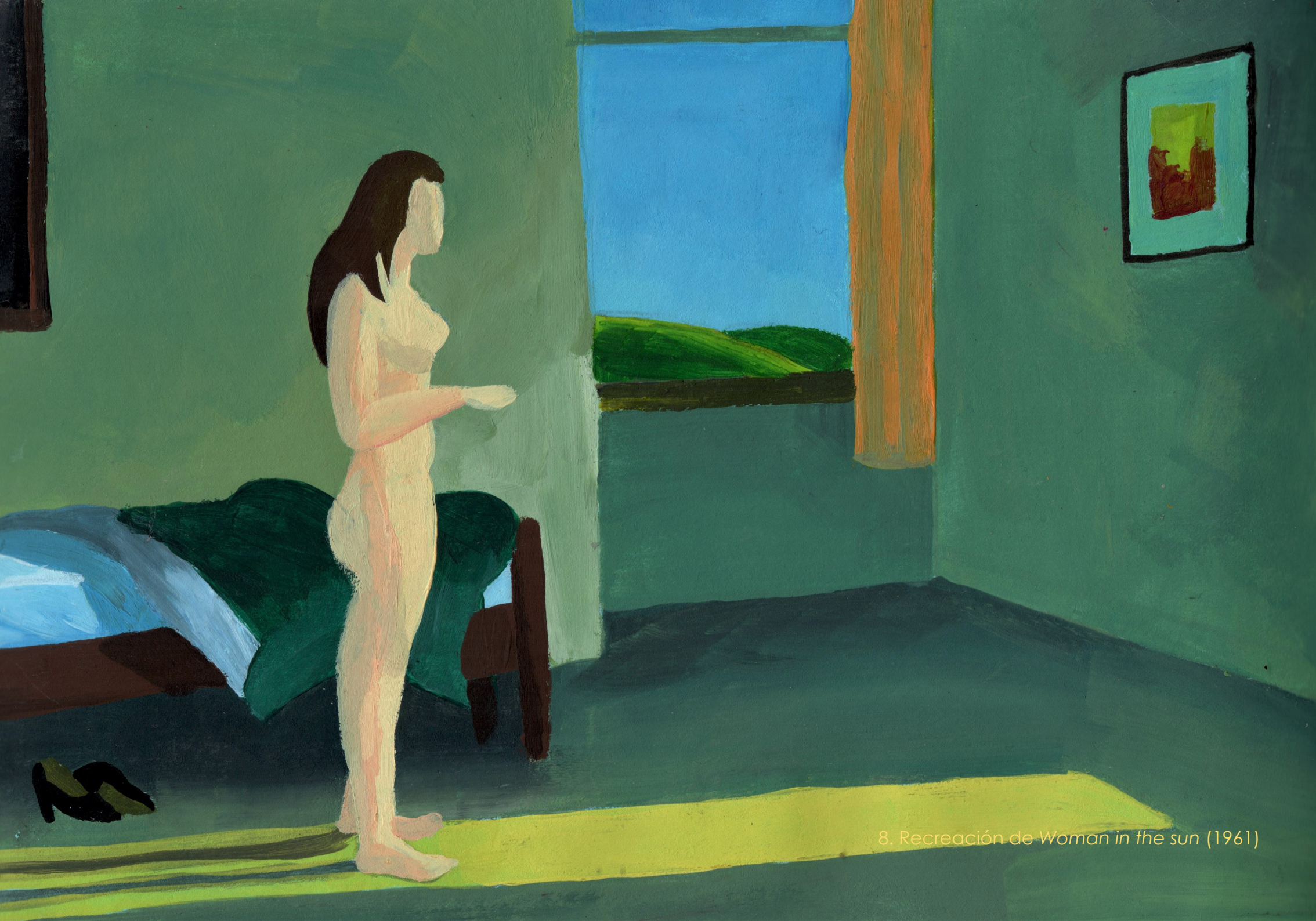
8. Recreación de Woman in the sun (1961)