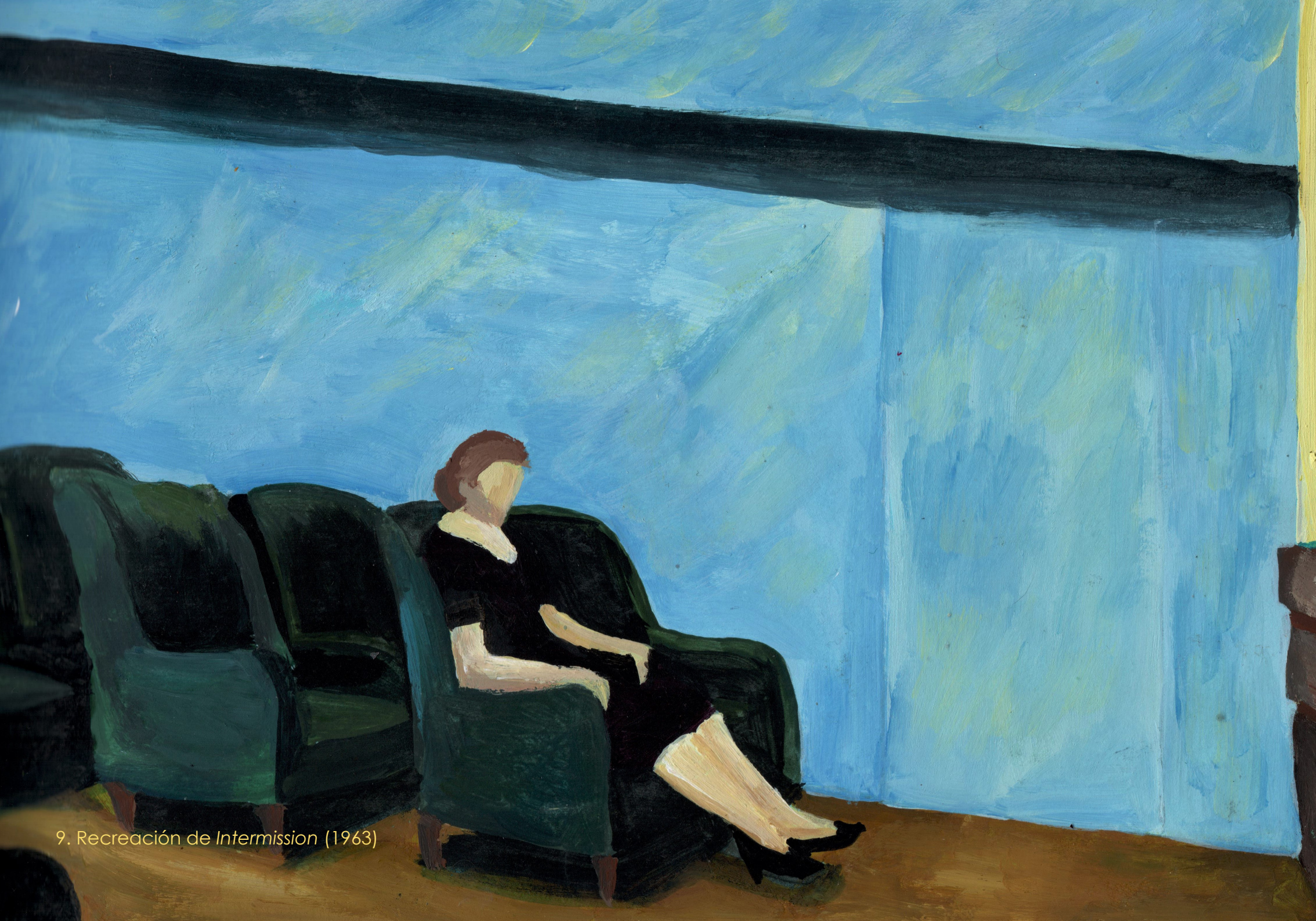
9. Recreación de Intermission (1963)