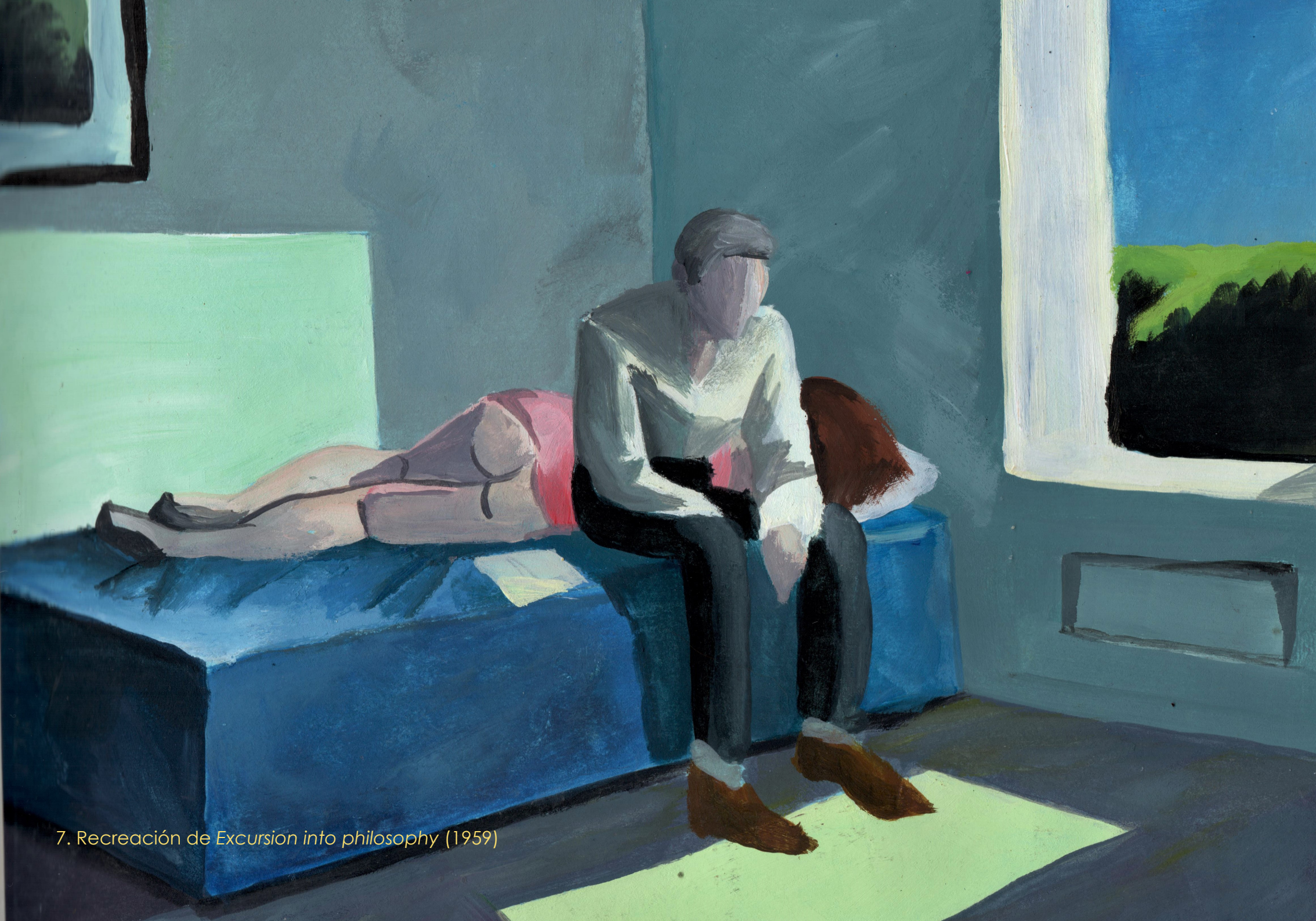
7. Recreación de Excursion into philosophy (1959)