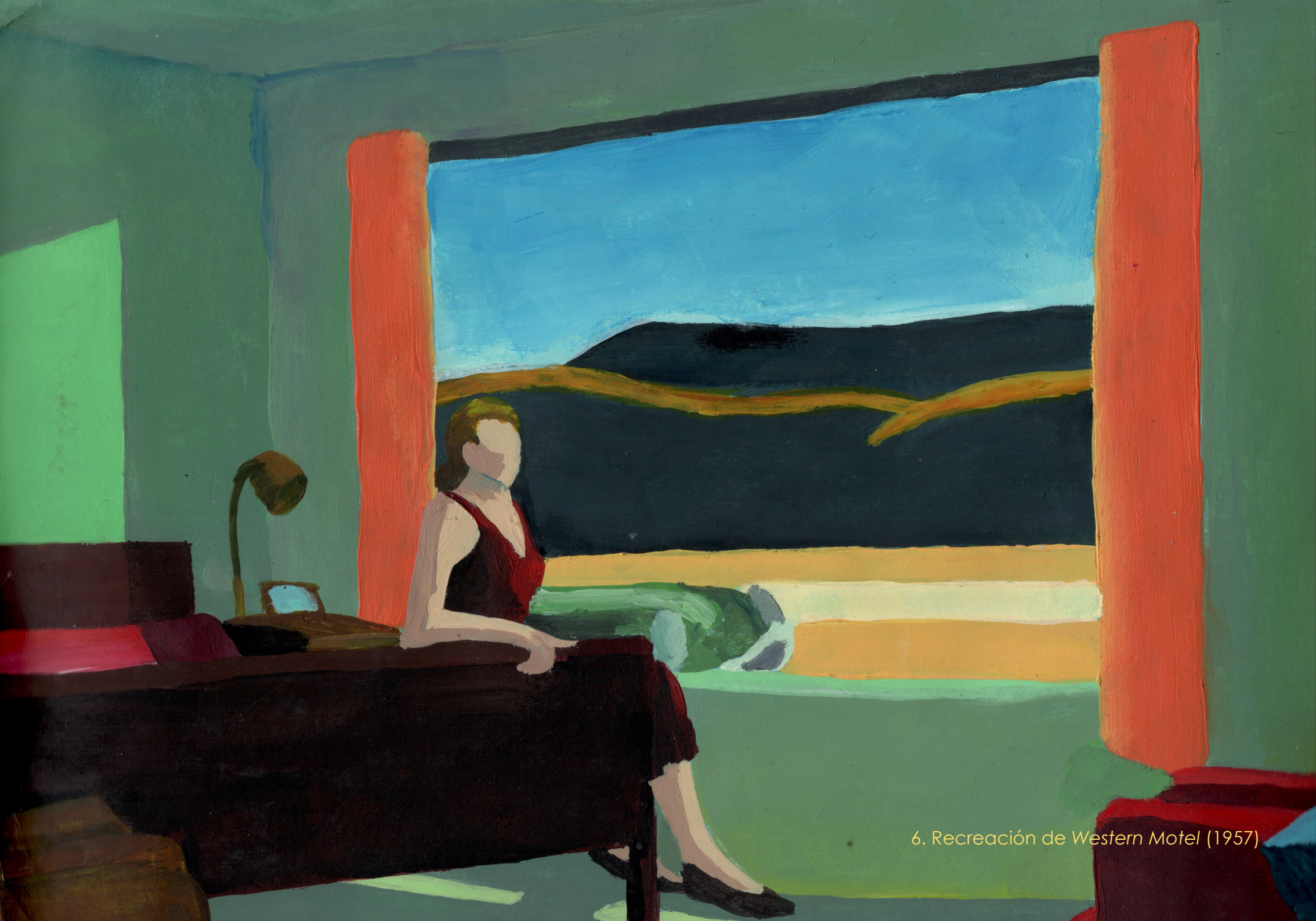
6. Recreación de Western Motel (1957)