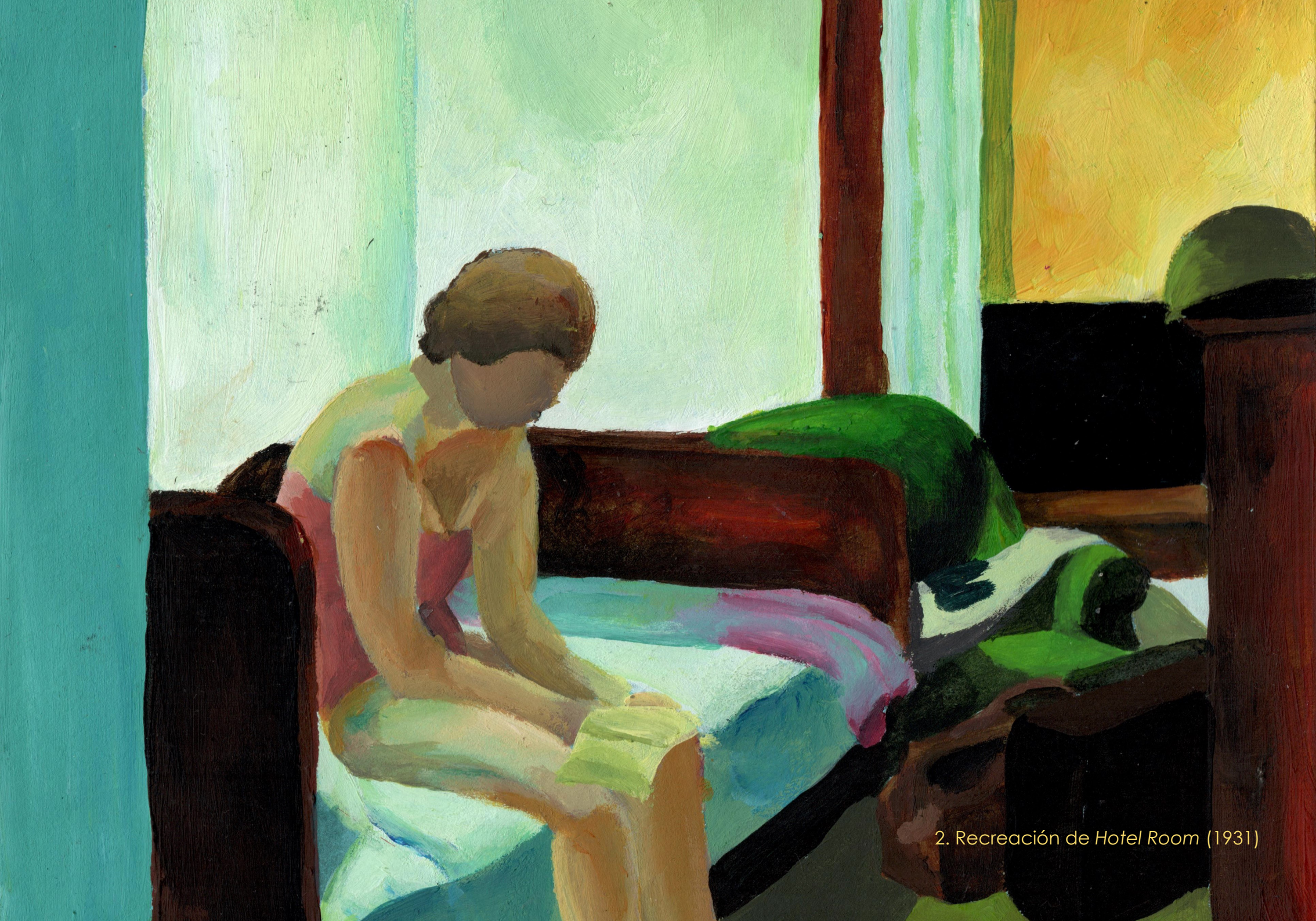
2. Recreación de Hotel Room (1931)