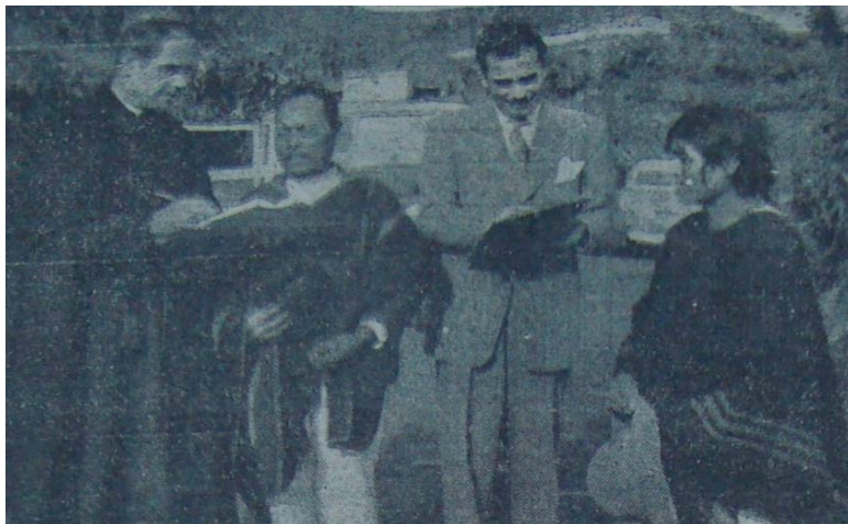
El Gobernador de Imbabura junto a un cura tomado datos a la población indígena

otros factores de la población, principalmente anotamos: edad, sexo, estado civil, nivel educacional 236 .