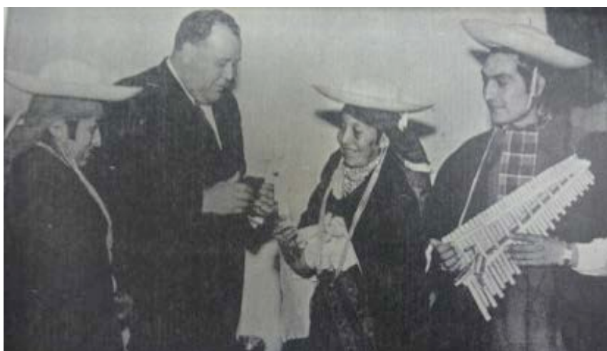
El Presidente de la ONU con la delegación otavaleña Foto: Talleres Gráficos Nacionales, 1949

“... está muy optimista en cuanto a conseguir que sus coterráneos de Peguche, en Imbabura, sean más trabajadores, más honrados; que procuren ganar más dinero, pues ahora estamos en una época de crisis...” 213