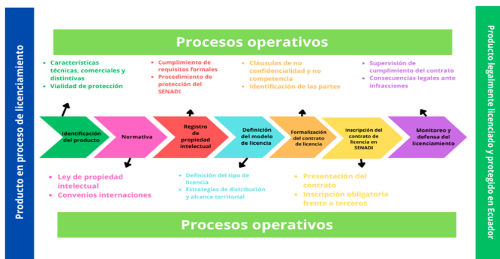
Gráfico 3. Propuesta de procedimiento legal para el licenciamiento de un nuevo producto en el Ecuador

La propuesta de procedimiento legal abarca las dimensiones establecidas en la matriz de operacionalización, incluyendo en los procesos las variables obtenidas del concepto emergente (Gráfico 3).