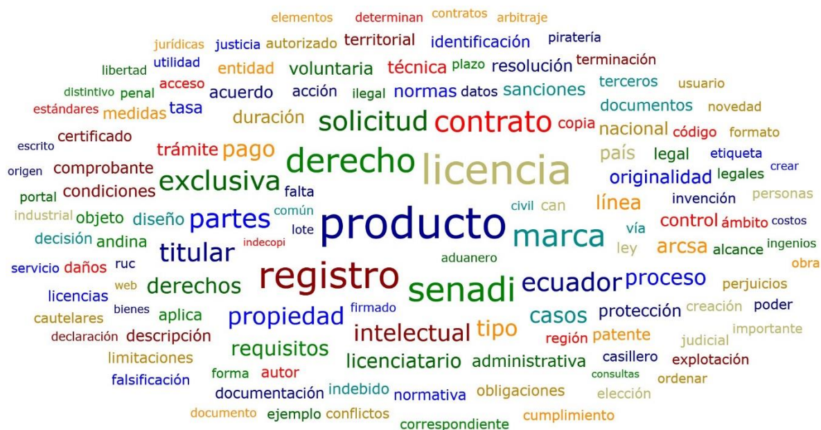
Gráfico 1. Nube de palabras del procedimiento legal para el licenciamiento de un nuevo producto en el Ecuador

La información cualitativa obtenida a partir de la realización de las entrevistas semiestructuradas se procesa con la ayuda del Software Atlas.ti. De esta manera, el primer paso que se lleva cabo para el correcto análisis de contenido fue la elaboración de una nube de palabras (Gráfico 1).