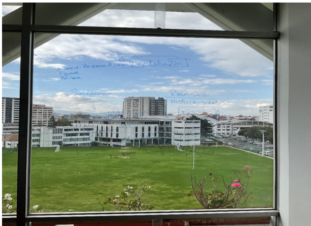
Nota: Recuerdo del armado de nuestras sesiones, vista desde la ventana del lugar donde trabajábamos

Las prácticas, teorías, saberes y opiniones no suelen ser unánimes la mayor parte del tiempo cuando se decide trabajar con otros. No obstante, sí pueden tener puntos de equilibrio si se decide aceptar las diferencias y respetar los espacios, los modos de intervención y las bases teóricas. Los procesos toman tiempo y tienen que ser trabajados en colectivo para llevar la palabra a la acción y que, con gran nobleza, los miembros sostengan la insoportable levedad del ser (Kundera, 2006), haciendo que hilar sea posible en relación con la palabra.