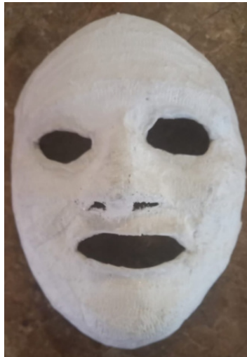
Nota: Máscara creada por una de las participantes del taller.

Desarrollar las creaciones nos llevó dos semanas, por lo laboriosas que son, pero su resultado fue impresionante. Durante la segunda semana, los participantes mencionaron cómo se habían sentido mientras moldeaban sus características. Muchos recordaron accidentes, enfermedades o cambios significativos que quizás antes no se habían hecho presentes. A todo esto, se le dio una contención por medio de la escucha, mientras los otros sujetos continuaban el proceso de creación de las máscaras.