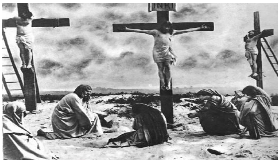
LA PASSION DE NOTRE-SEIGNEUR JESUS CHRIST (1907), de Ferdinand Zecca, fue la primera gran película sobre Jesús.