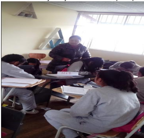
Taller 9.- Viaje por las principales culturas tungurahueses