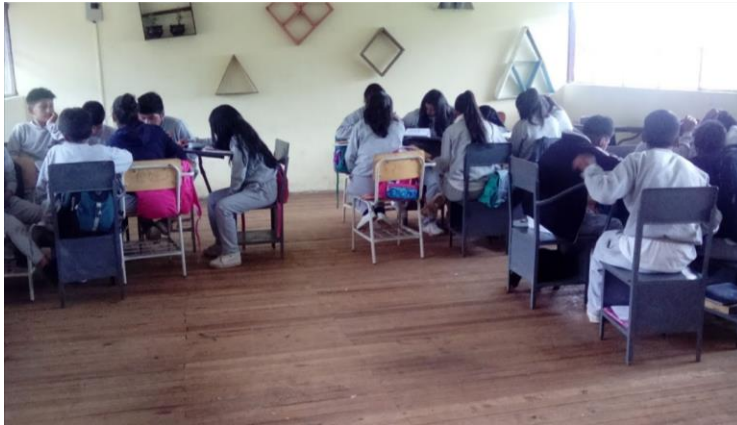
Taller 8.- Inti Raymi y sus elementos principales