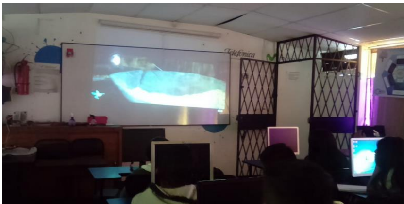
Taller 2. Pérdida de las culturas y tradiciones en Ecuador