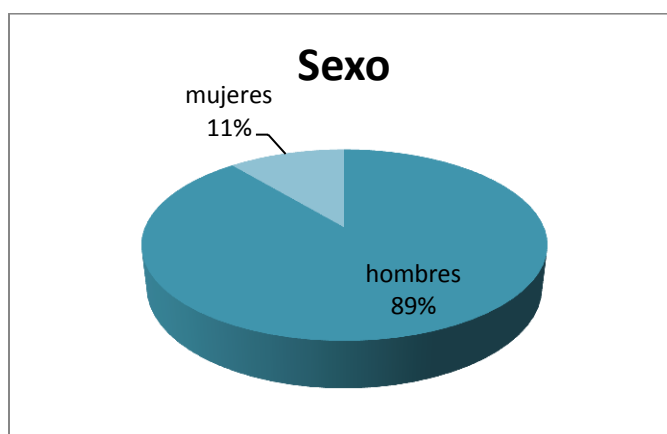
Figura 1 Género Elaborado por Yohama Calderón en Septiembre 2015

Del total de nueve participantes del taller, el 89% (8 participantes) son hombres y el 11% (1 participantes) es mujer.